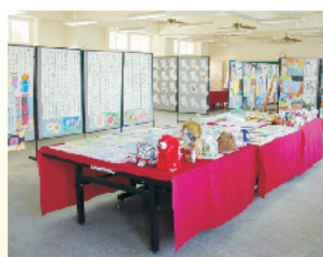
平時的巧手慧思，創造出一件件傑出作品，畢業生藝文展覽佳評如潮。