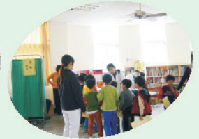
一、四年級學生健康檢查