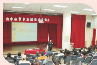
孩子未來競爭力如何，且聽親職教育專家精闢的分析與探討。

見職孝女月日活重 本學期的親職教育日活動，安排親子同歡、親職講座、藝文展覽、教學活動以及親子趣味競賽，並藉由親師生互動交流，增進親職教育效能。