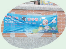
新法上路菸害不再 一菸害宣導標語

為達成健康促進學校願景，本校積極推動菸害防制及健康體位實施計畫，提升教師專業認知，藉由融入教學過程建立學生健康的觀念與態度，結合衛生所及其他社團宣講，並利用教職員工及家長健檢宣導，校內外成效漸現，目前校園內全面禁菸與檳榔，學生藉由樂活運動及各項體育競賽養成運動習慣，家長與社區人士到校園運動人口倍增，提高健康活動的參與度與關心度，成效已延伸至家庭與社區中。