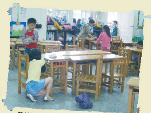
學校同學認真做消毒工作一起防治傳染病