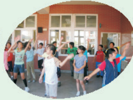
下課時間活動筋骨，做健康操。