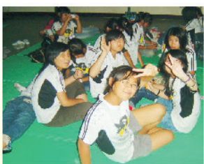
同窗好友在宿營活動中有說不完悄悄話，這真是難忘的雙龍之夜。