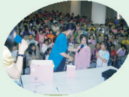
有獎問答， 答對了有神秘禮物喔！