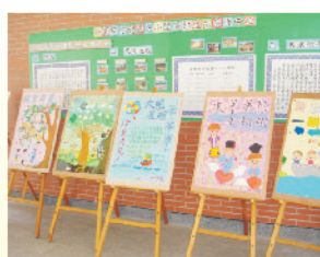
學弟學妹用心製作的歡送海報，帶給學長學姊溫馨的祝福。