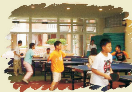
桌球排名賽戰況激烈