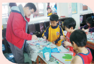
三年級親子彩繪風箏，繫上祈願卡，和家長一起放風箏。