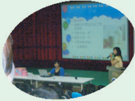
衛生局人員到校宣導 健康的飲食習慣