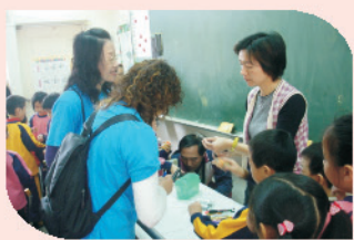
二年級教學活動，親子製作童玩，彩繪作品後同樂分享。