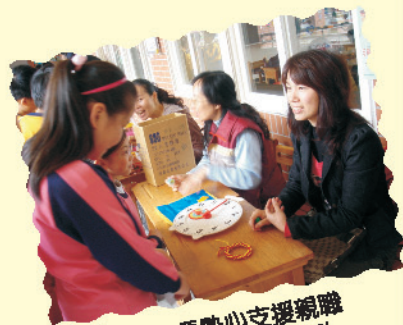
感謝家長熱心支援親職教育日學生團關活動