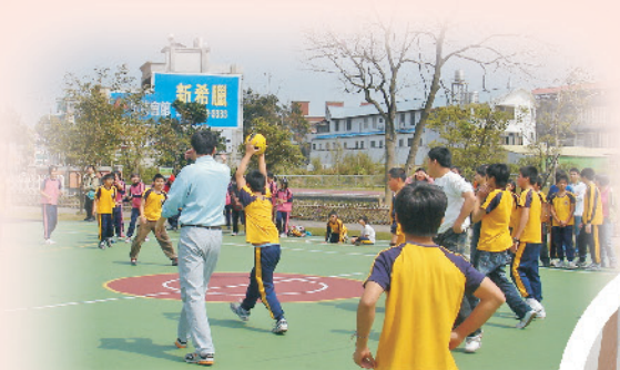
六年級的親子趣味躲避球賽，家長和小朋友同歡樂。