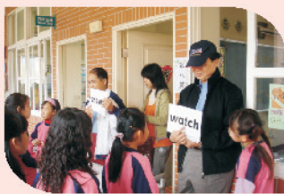
四年級的闖關活動，上知天文、下知地理，小朋友個個勝券在握。