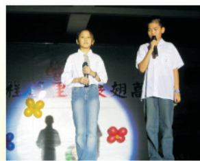
在校生代表致歡送詞，恭賀學長姊立下良好典範，也感謝提攜與照顧之情。