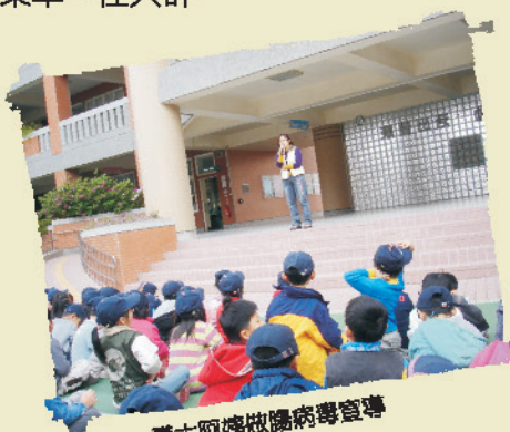
護士阿姨做腸病毒宣導