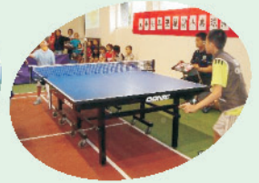
桌球排名賽，高手雲集。