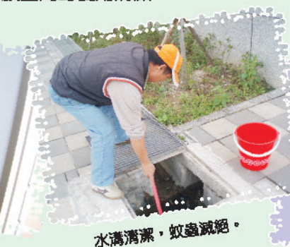
水溝清潔，蚊蟲滅絕。