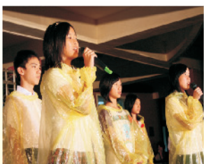
畢業生代表用國、台、英語致答謝詞，充分展現語文學習的成果。