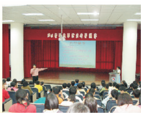
學區國中主任、老師蒞校辦理升學輔導，說明未來的學習環境與學習方法。