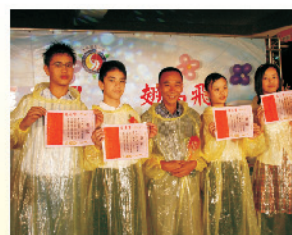
平時的努力不懈，換來得獎的喜悅，讓我們再接再厲，獲得更高的榮譽。