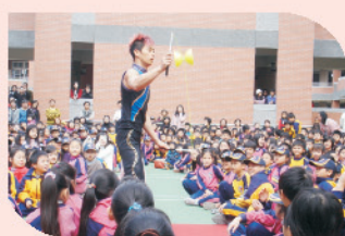
響譽國際的扯鈴好手表演拿手絕活，全場驚呼聲連連，高潮迭起。

見職孝女月日活重 本學期的親職教育日活動，安排親子同歡、親職講座、藝文展覽、教學活動以及親子趣味競賽，並藉由親師生互動交流，增進親職教育效能。