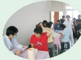
教職員工健康檢查