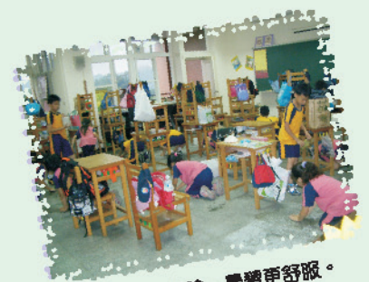
每月大掃除，學習更舒服。