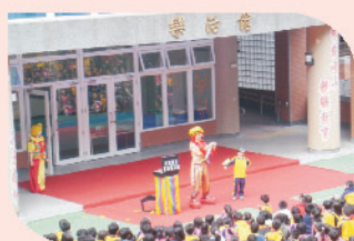
小丑表演精彩的魔術，逗趣地與小朋友互動。