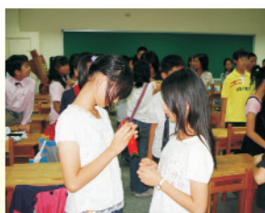
學弟妹為畢業學長姊配上胸花，恭賀學有所成，是畢業典禮的前奏曲。