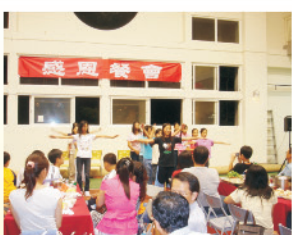
學生和家長自製餐點，舉辦溫馨的感恩餐會，節目精彩，親師生同歡樂。