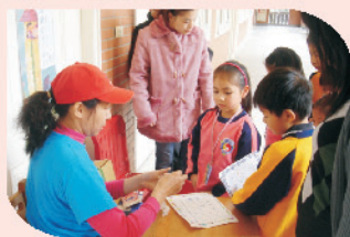
一年級的跳繩、摺衣、找單字等十八個關卡，難不倒聰明的小朋友。