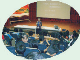
衛生所護理師到校宣導 口腔保健