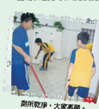
廁所乾淨，大家高興。