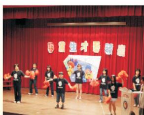
秀舞蹈、展歌喉、耍特技、飄琴藝，畢業生的才藝表演頗有專業水準。