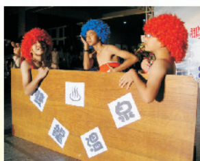
這個精彩的劇情畫面，可見學弟賣力的演出，使畢業典禮更加有聲有色。