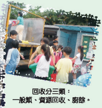
回收分三類： 一般類、資源回收、廚餘。