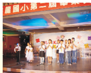
學弟妹演奏笛笛與小提琴，用優美的音樂，祝福畢業生萬里，展翅高飛。