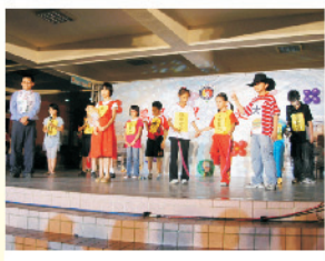
學弟學妹精湛演出雙龍德往故事劇，喚起畢業生甜蜜的回憶。