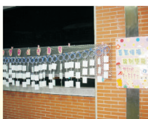
謹以感恩惜福之心，話別母校，今日我以雙龍為榮，來日雙龍以我為榮