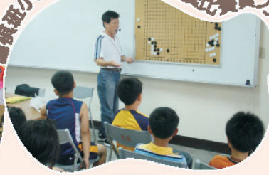
小朋友認真學習，培養比賽實力。