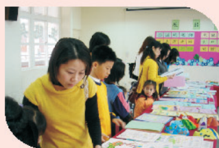
親師生的藝文作品展，呈現多元學習的成果。