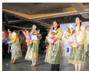
畢業生獻給導師最高的敬意，感謝老師平日辛勞的教誨。