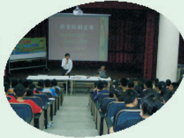
衛生局人員到校進行菸害 防制宣導