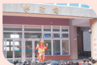
邀請國內知名小丑劇團到校演出，親子共度歡樂時光。