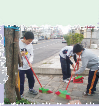
隨手戶外掃，週遭環境好。