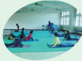
教師彼拉提斯研習