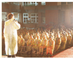
雖然下著雨，來賓仍然熱情參與。校長致詞勉勵畢業生，也祝福畢業生。