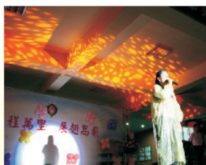
感性的時刻，畢業生導師代表的叮嚀祝福，句句要謹記在心。