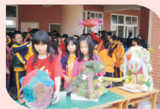
五年級利用回收素材，動動腦，巧手成就創意環保秀。