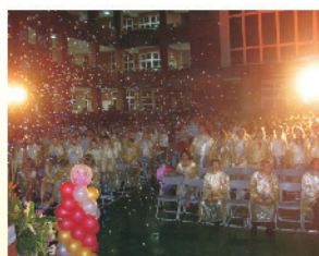
畢業典禮用燈光、氣球、煙火等特效，營造與星光閃耀互相輝映的氣氛。