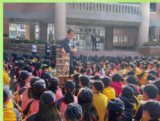
台上宣導台下認識新興毒品樣貌