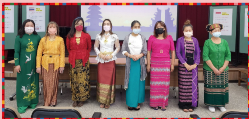
印尼.緬甸.泰國.越南等新住民文化介紹