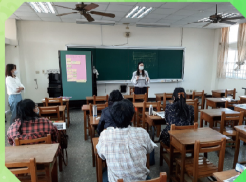
本校教學組長與他校分享實施成果