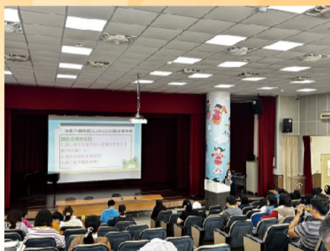
教師會議，午餐秘書進行午餐指導說明宣導