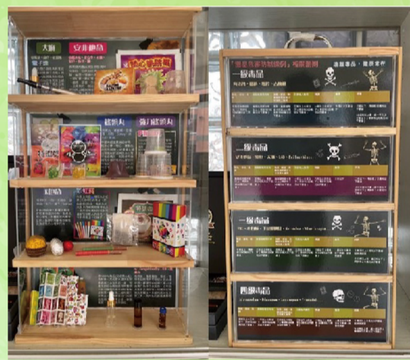
水晶牆櫥窗-展示毒品模型