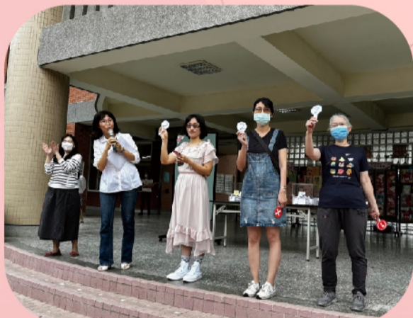
評審老師鼓勵孩子的優異表現