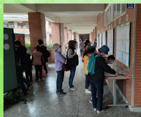
家長參觀書法及硬筆書法展