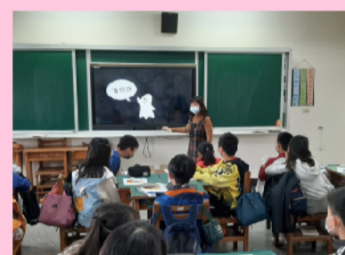
校長公開課介紹多元文化