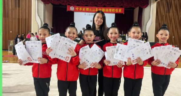
榮獲中年級團體第四名