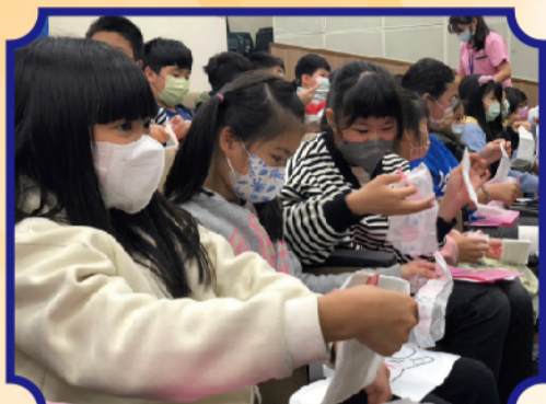
小朋友分組練習如何正確使用衛生棉