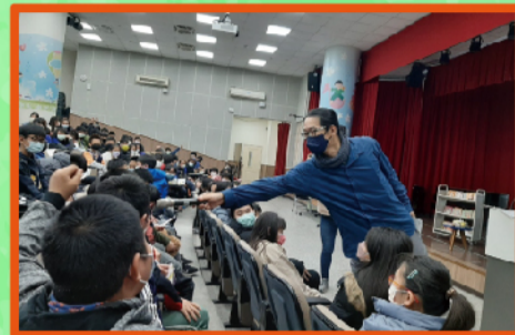
林哲璋老師與孩子互動