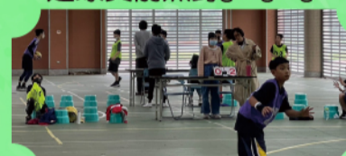
專注--只為投進關鍵一球!