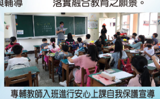
專輔教師入班進行安心上課自我保護宣導