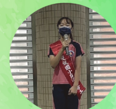
自治市市長陳莉恩發表感言