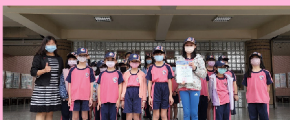
頒發母親節優良作品獎狀