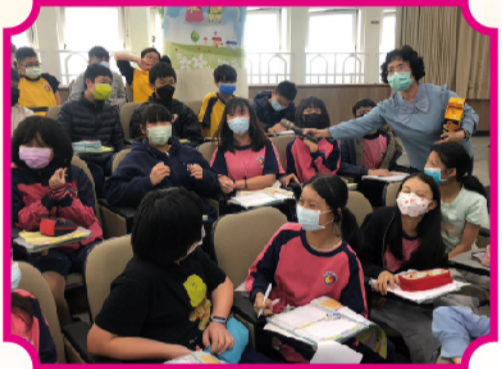
六年級學生筆記與有獎徵答