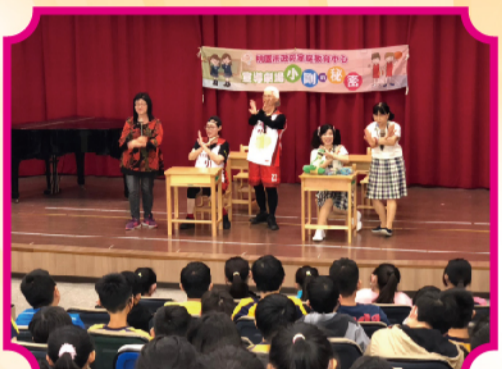
小剛的秘密戲劇展演