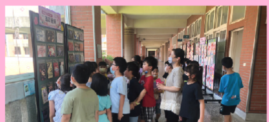
高年級母親節優良作品展示