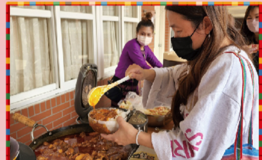
緬甸咖哩雞腿馬鈴薯飯及緬甸拉茶