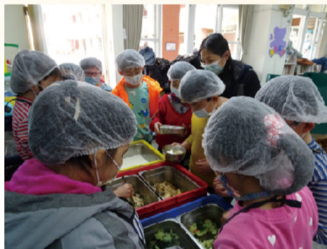
老師用心指導，學生有秩序盛裝石斑魚料理