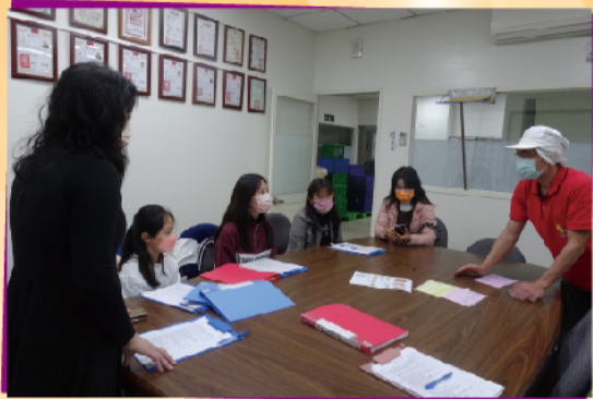
由家長、老師、學生和行政代表一起抽訪午餐廠商公司