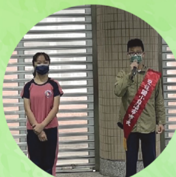
新舊任自治市市長交接