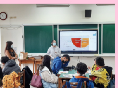
學生進行發表與分享