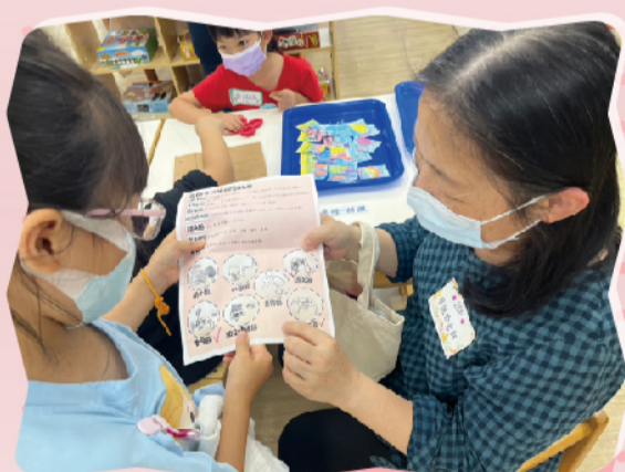
和小天使討論要挑戰哪一個學習區