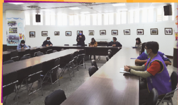
每月午餐會議，邀請廠商及家長參與，控管午餐品質