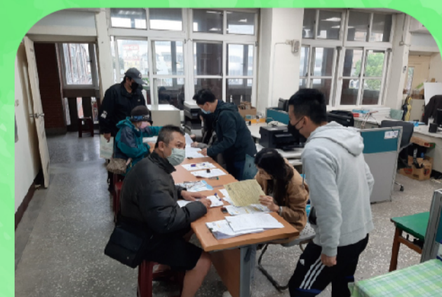
家長詢問新生入學事宜