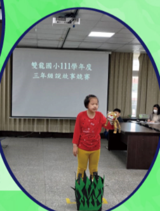
雙龍國小111學年度 三年級說故事比賽