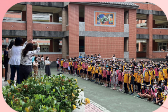
一年級小朋友以英語祝福母親節