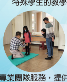
專業團隊服務，提供 有愛無礙的教育環境