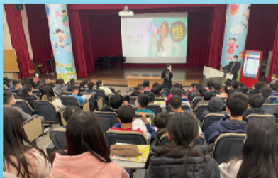
邀請十所公私立中學進行升學說明會