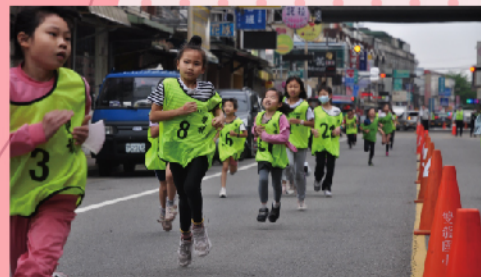
雖然筋疲力竭依然踏出堅定的每一步