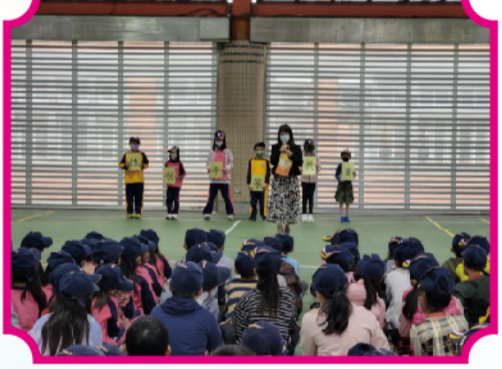
兒童朝會全校性別平等教育宣導