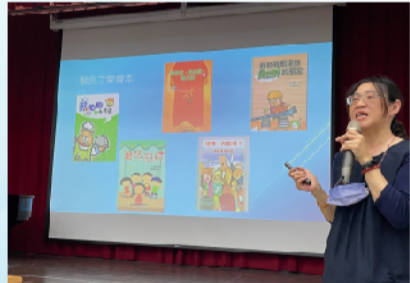
特教知能教師研習 特殊學生的教學與輔導