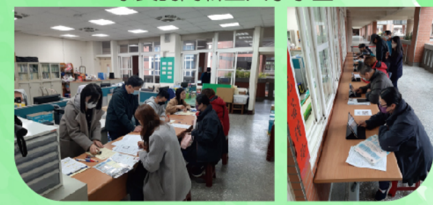
登記過程井然有序