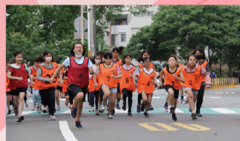
奮勇向前只為拔得頭籌