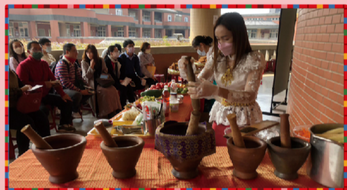
泰國組異國文化美食體驗