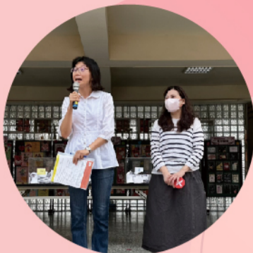
主持人莉梅老師及麗瑾老師開場