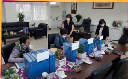
雙龍午餐深獲訪視委員讚賞