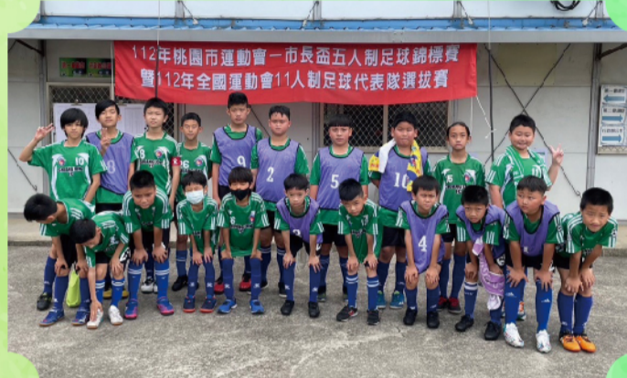
雙龍足球隊選手合影