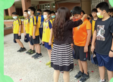
校長為籃球賽優勝選手掛上獎牌