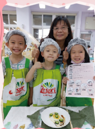
健康與美感兼具的料理體驗