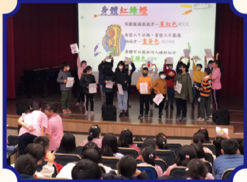
小朋友畫出身體隱私部位並上台分享