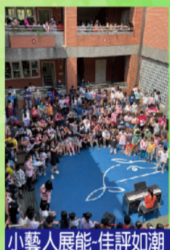
小藝人展能-佳評如潮