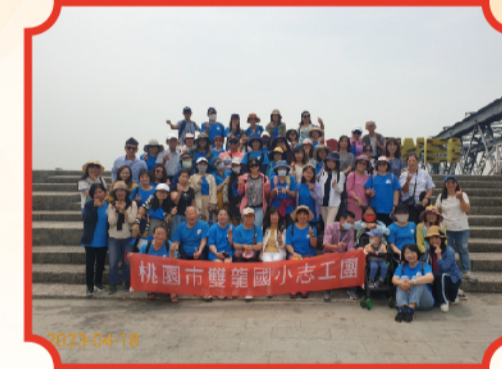
雲林風光虎尾鐵橋