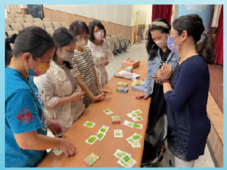
國語和數學桌遊融入教學，教師增能研習