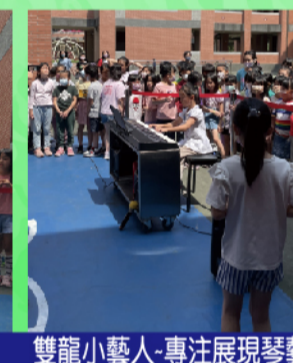
雙龍小藝人-專注展現琴藝