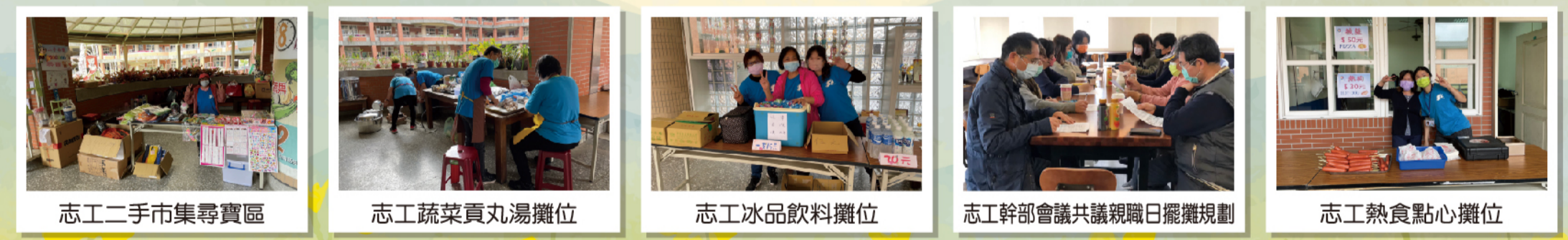
志工二手市集尋寶區