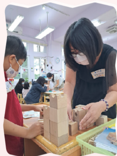
設計彈珠的運行軌道