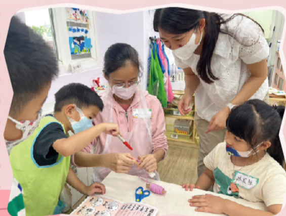
教老師編織手環的秘訣