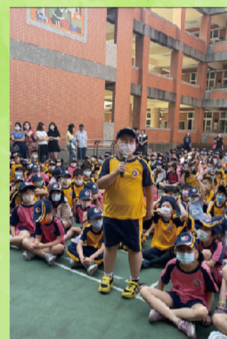
學生回饋-行人要停看聽囉!