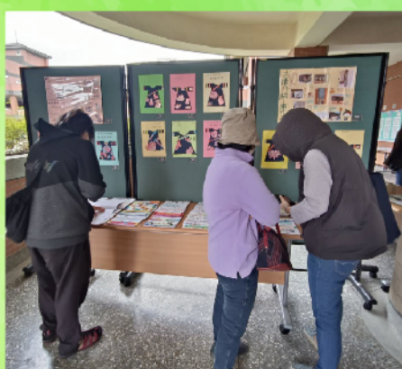
家長觀賞學生作品