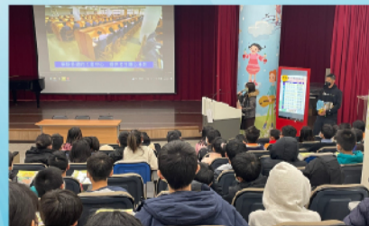
學生專心聆聽筆記各校特色