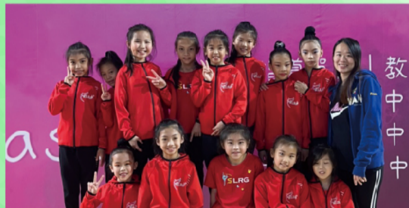
韻律體操參賽隊員及教練賽後合影