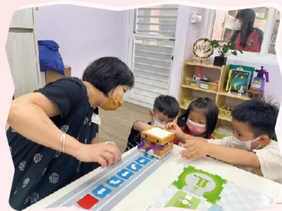
研究機器人指令語言

培養幼兒能自理、願合作、會自律、樂學習，順利銜接小一新生活，一直是我們在幼小銜接課程面向所努力的目標！在幼兒園的生活中，孩子們覺察生活環境並學會照顧自己，願與他人合作，學習群體生活，穩定調節情緒，遵守團體規範，養成閱讀習慣，主動探索嘗試。過程中不只需要生親師一起努力，更必須與小學合作，才能發揮雙向互惠的銜接課程精神。