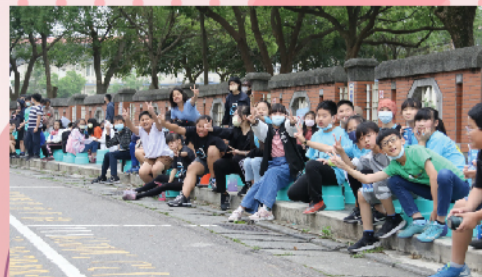
熱情加油聲是向前的動力