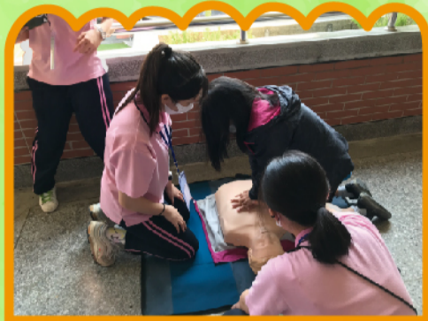
學生在走廊上實地操練