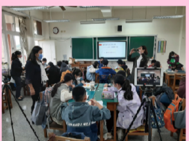
他校校長蒞臨觀課