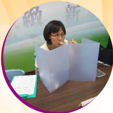
邀請家長入校品評午餐交流意見