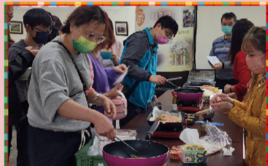
印尼沙嗲.椰奶果凍製作體驗