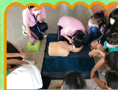
新生醫專姐姐專注示範動作