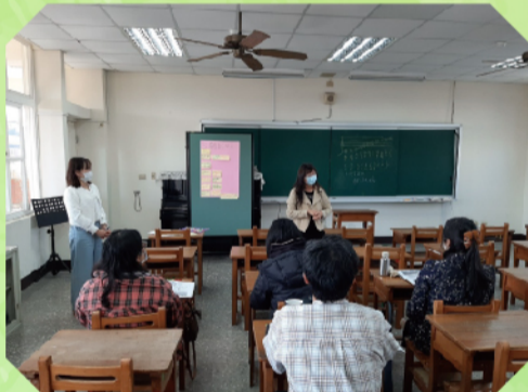
分組報告校長引言