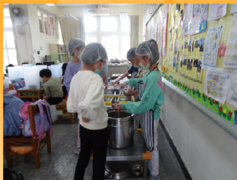
午餐小幫手穿戴整齊，協助打菜