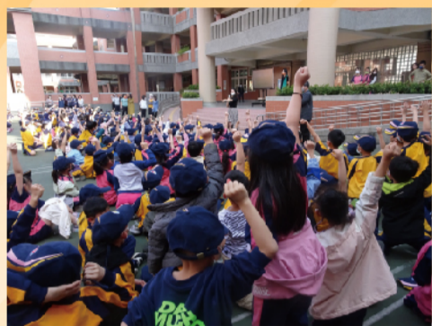
營養教育宣導由松晟營養師主講鈣質對人體的重要