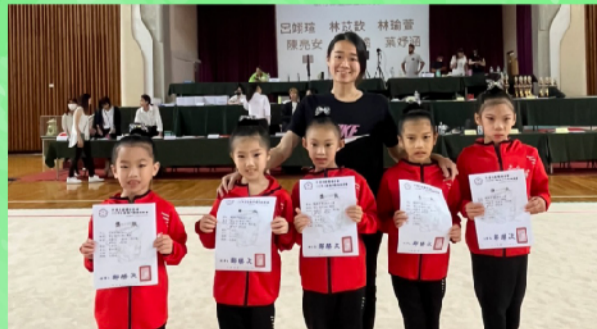
榮獲低年級團體第四名