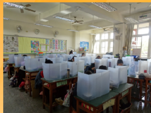
午餐防疫不鬆懈，使用隔板不說話不分食不共食