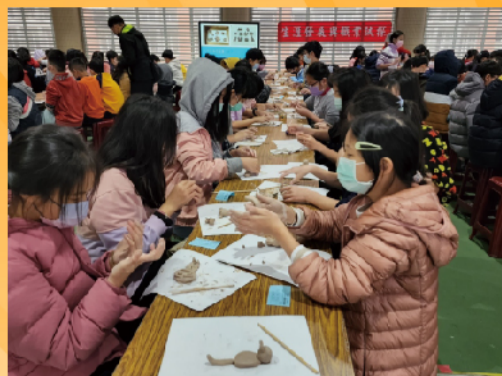
五年級藝術職群職業探索—陶藝筷架