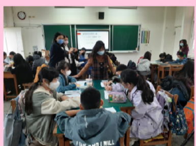
校長引導學生討論