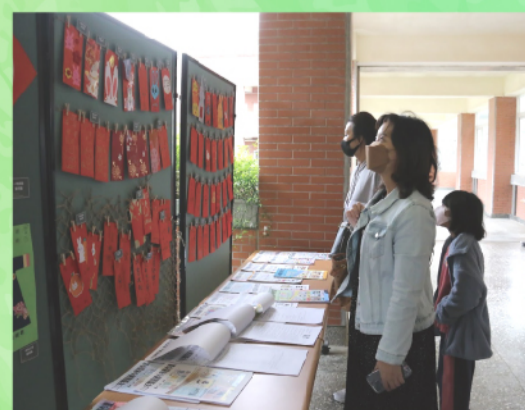
家長參觀優良寒假作業展