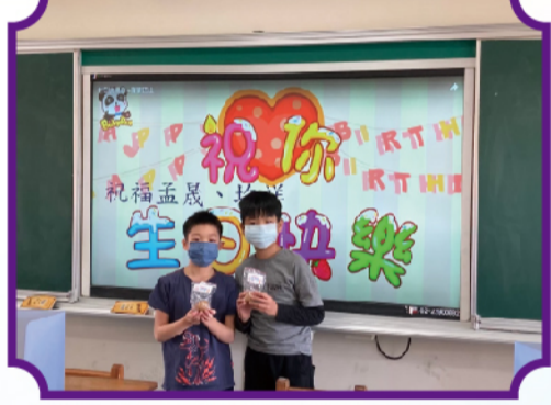
感謝家長會贊助學生慶生茶葉蛋