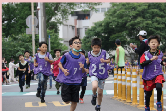
有氧耐力大口吸氣