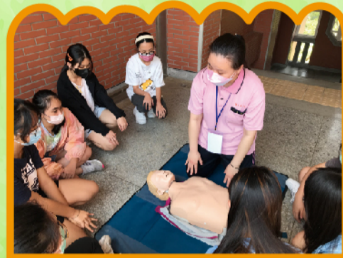
操練結束再提醒改進的地方