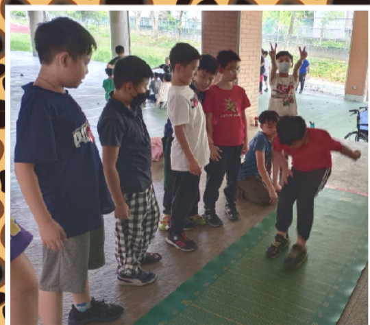
立定跳遠--奮力一跳