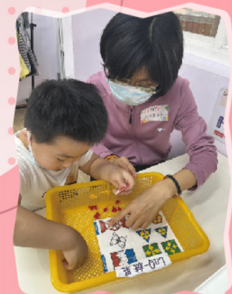
依據題卡圖示完成作品