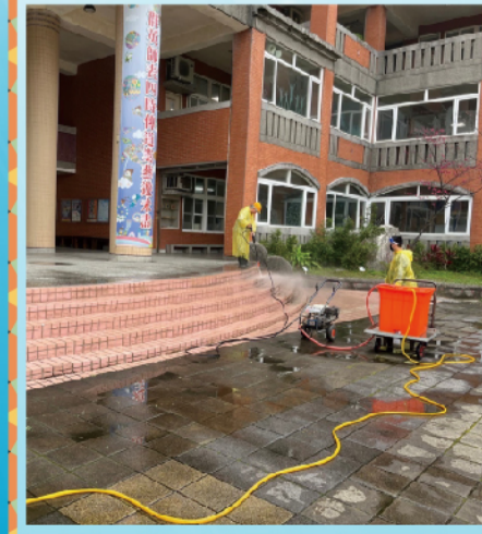
龍遊具拆除前中後