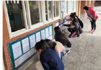
積極辦理特教宣導活動， 落實融合教育之願景。