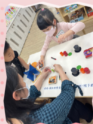
數學區的桌遊關主