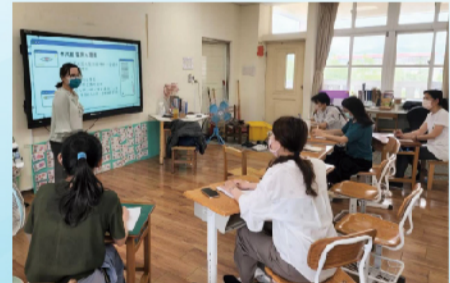
青少年網路成癮與網路陷阱研習