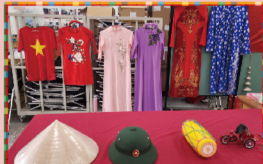
越南組傳統服飾和文物展示