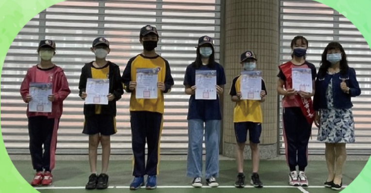
校長頒發自治市團隊當選證書