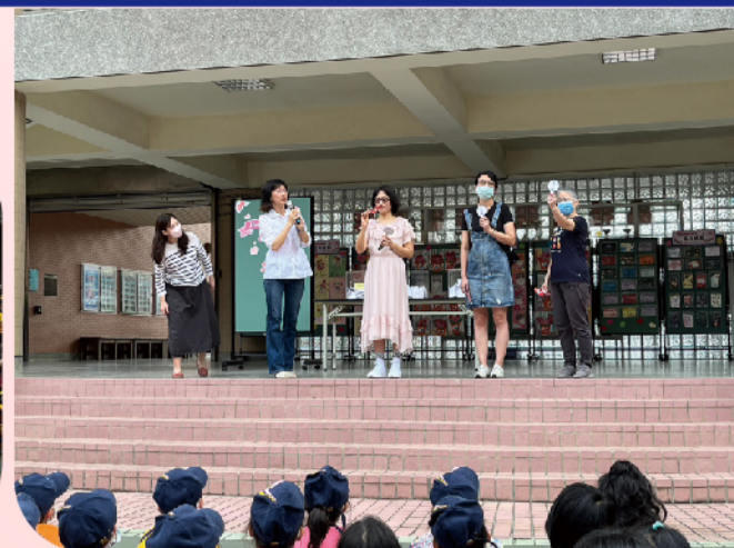
老師進行各年級英語祝福母親節活動評分