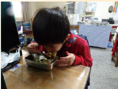
學生開心享用石斑魚料理