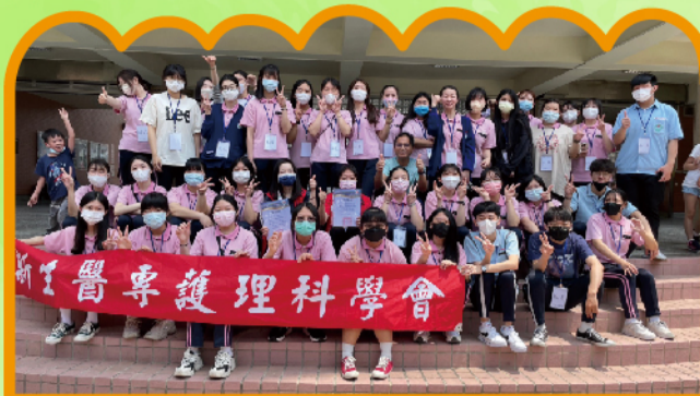
CPR課程圓滿完成-頒贈感謝狀