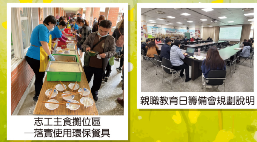
志工主食攤位區 —落實使用環保餐具