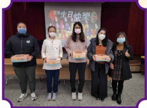
感謝家長會致贈師長慶生蛋糕