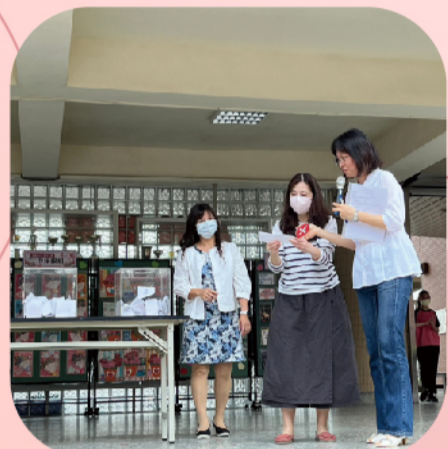
主持人唱名校長抽中的學生