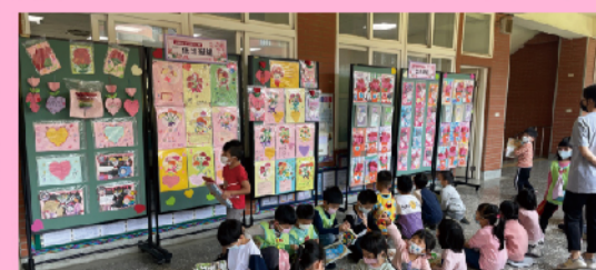
低中年級母親節優良作品展示