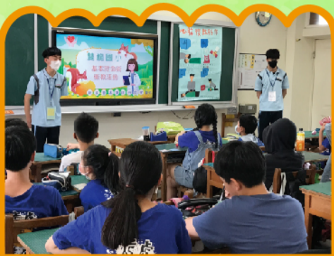
大哥哥大姊姊仔細地講解課程內容