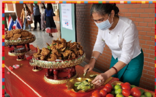
從異國文化與美食看見新住民的力量