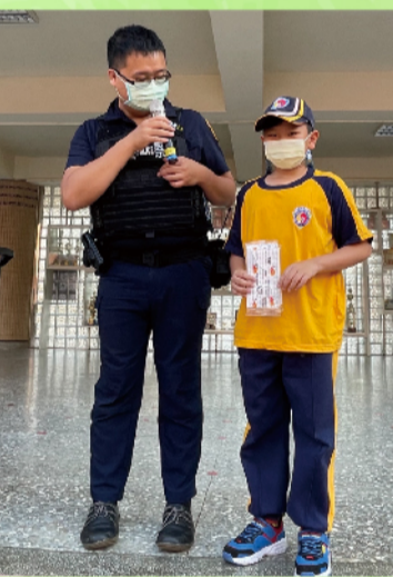
yes-標準答案上台接受表揚!