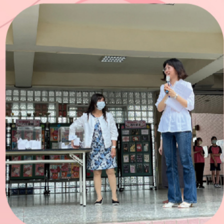
校長抽出幸運的call out小朋友