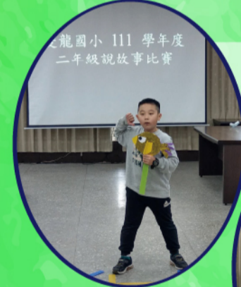
龍國小 111 學年度 二年級說故事比賽