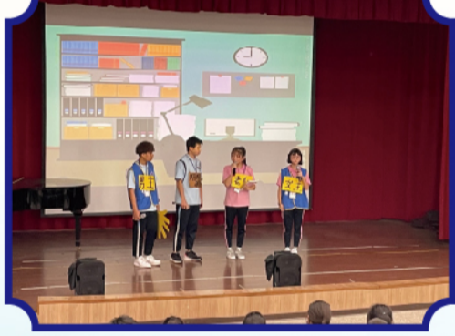
新生醫專師生們介紹身體界線戲劇展演