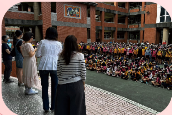
四年級小朋友以英語祝福母親節