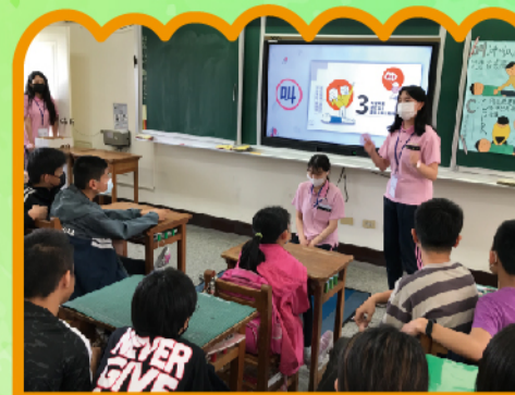
姐姐們賣力的講解-學生認真的聽講