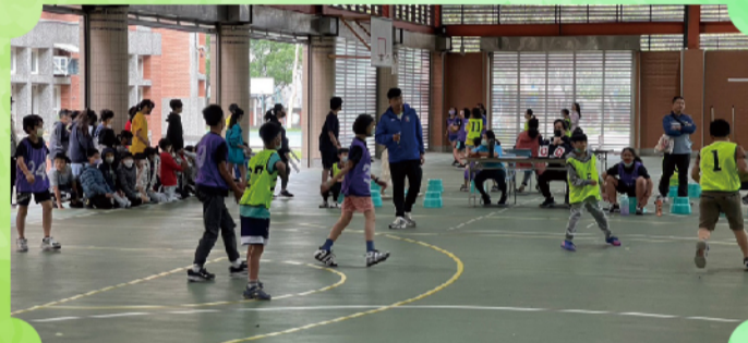
接應--為隊員製造得分機會!