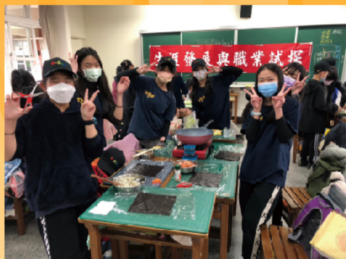
六年級食品職群職業試探—摺疊壽司