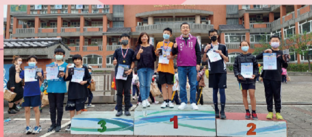
恭喜優勝者開心與校長及會長合影