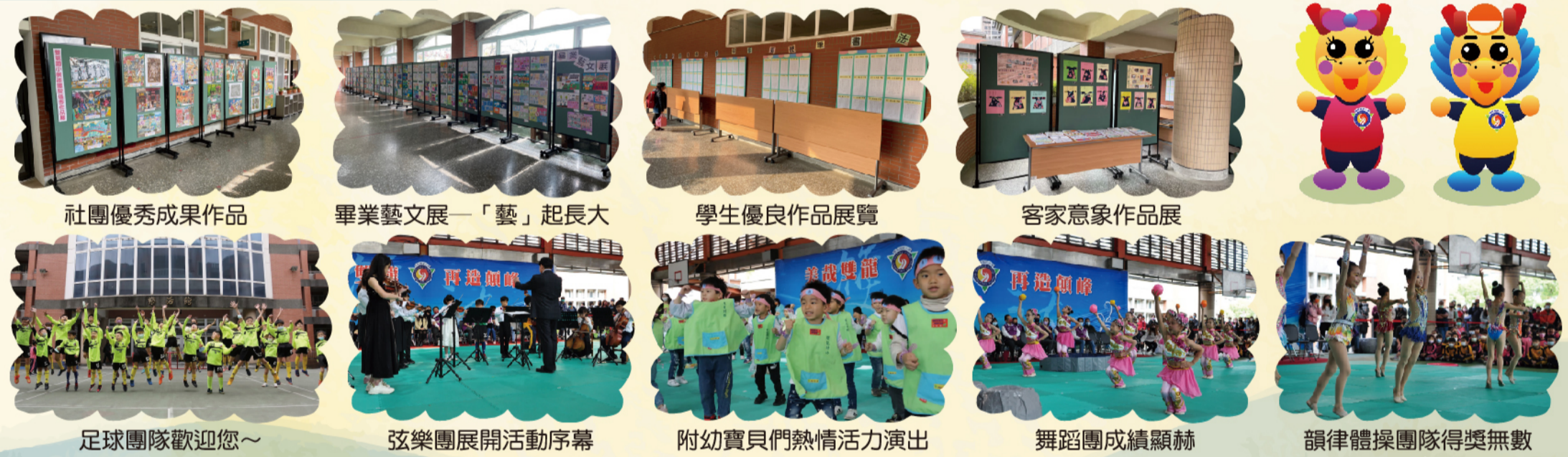
社團優秀成果作品