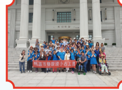
嘉義佐登妮絲生技園區