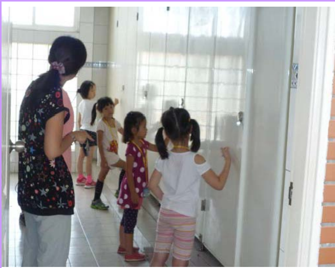
廁所禮儀—應先輕輕敲門看是否有人