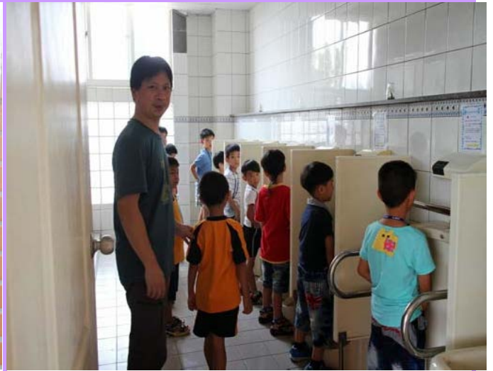
練習正確如廁方式