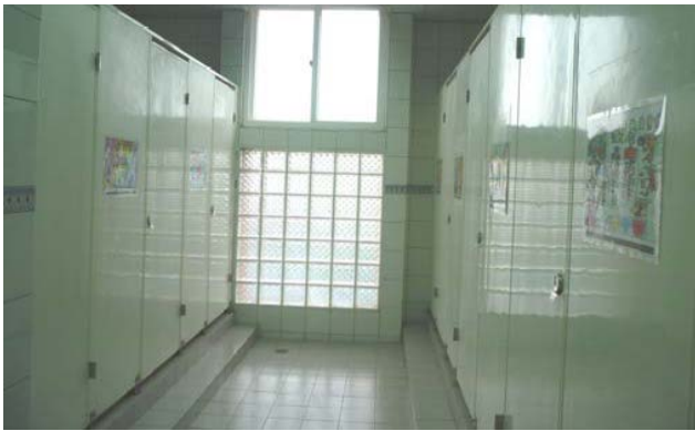
寬敞明亮又潔淨的六星級廁所