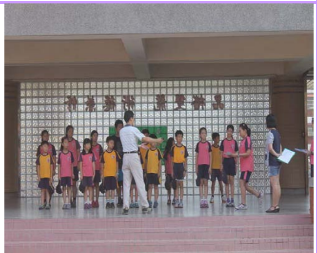
每週四的朝會頒獎給優質廁所獲獎的班級