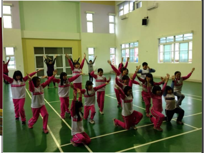
結束時的 ENDING POSE