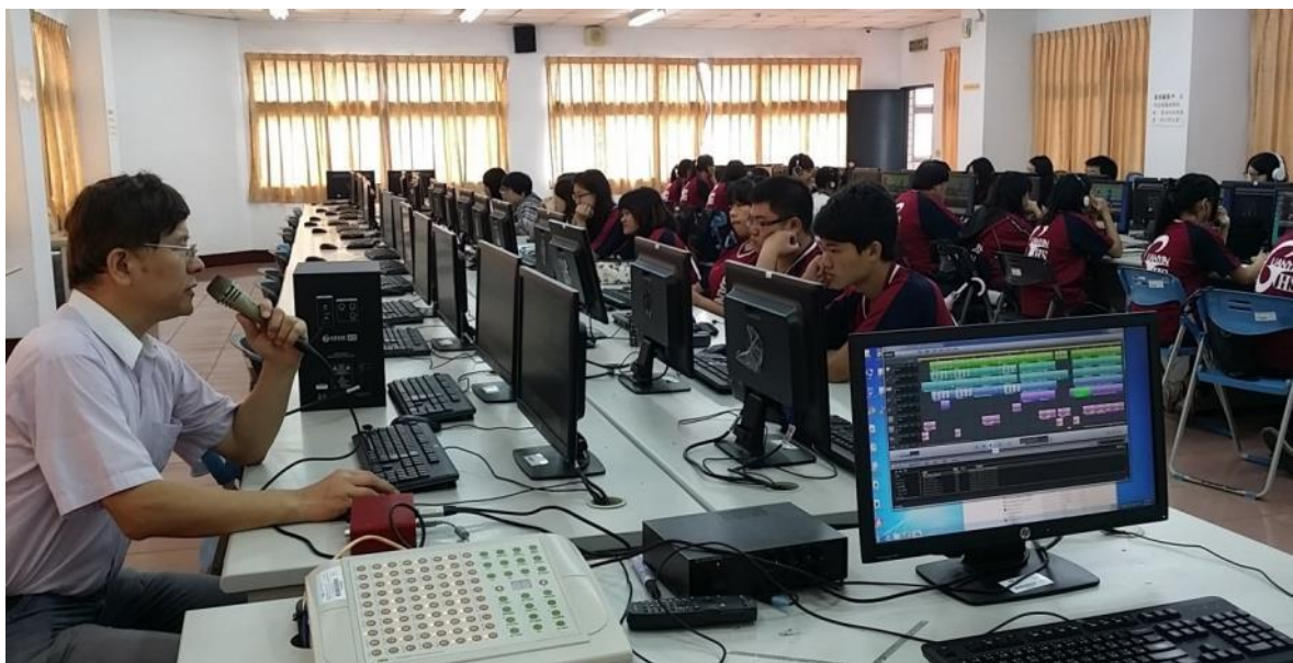
教授講解數位音樂軟體操作。