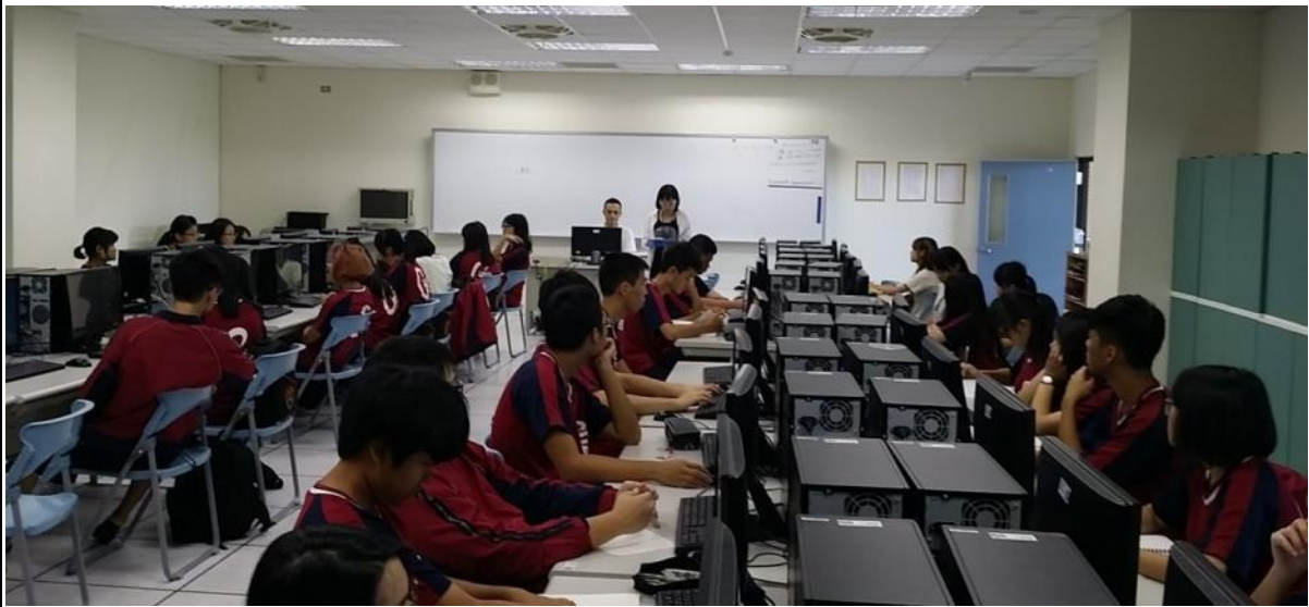
專業證照培訓營始業式-科主任致詞勉勵和課程說明。