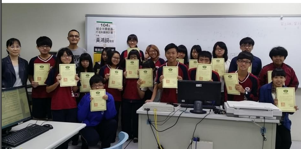
專業證照培訓營結訓頒發結業證書合影。