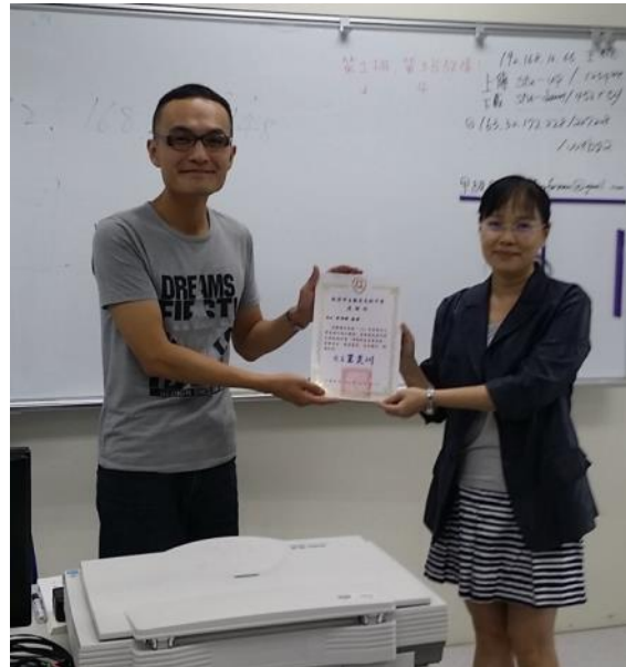
科主任致贈感謝狀給萬能科技大學教授。