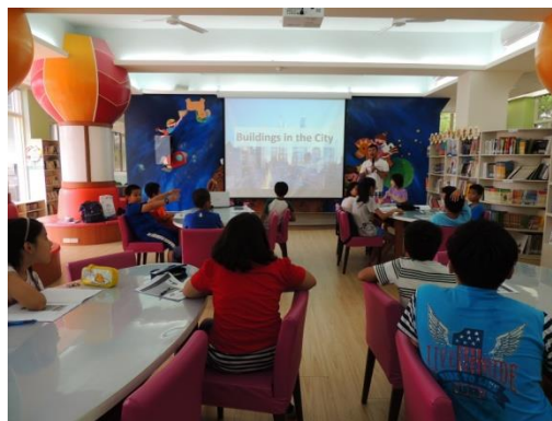
中年級講師上課的情形