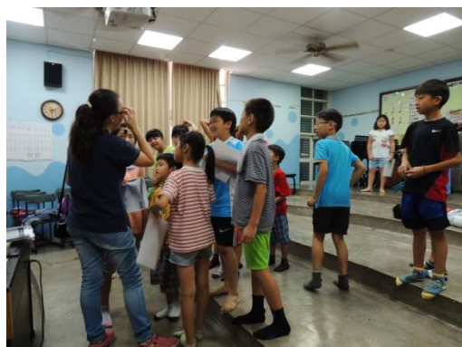
中年級講師上課的情形