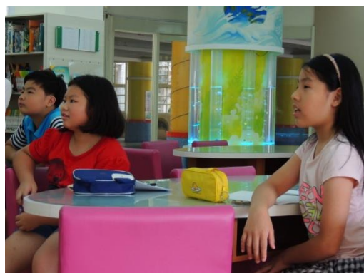
高年級講師上課的情形