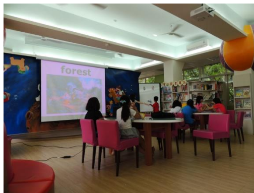
中年級講師上課的情形