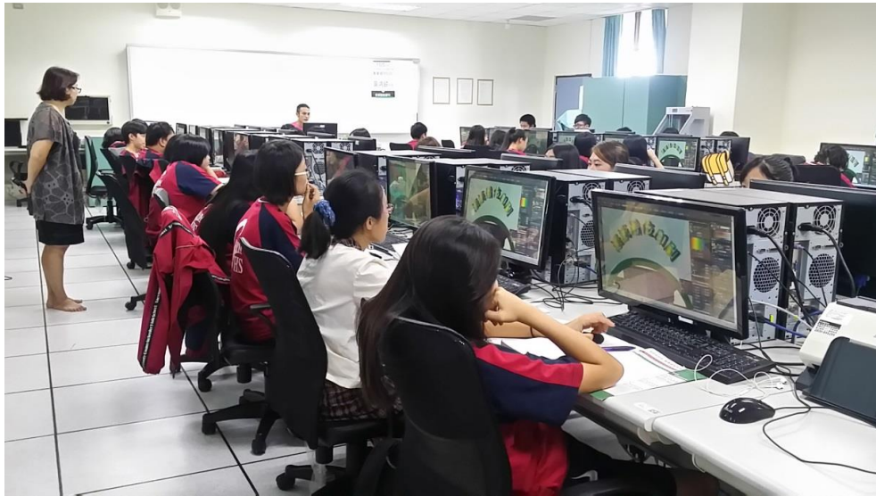
助理講師之實作督導。