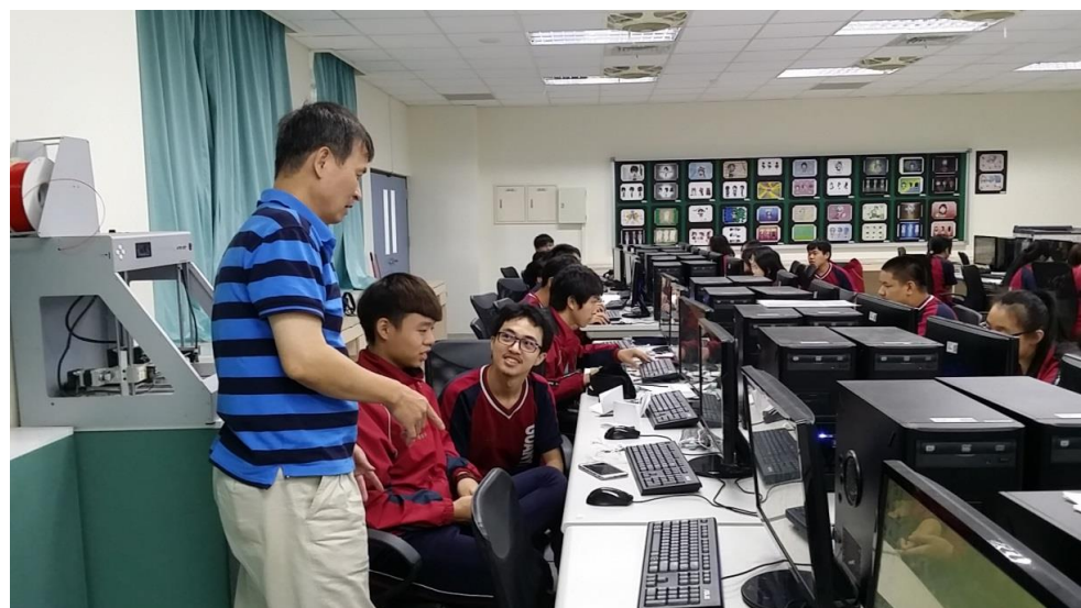
助理講師之實作督導。