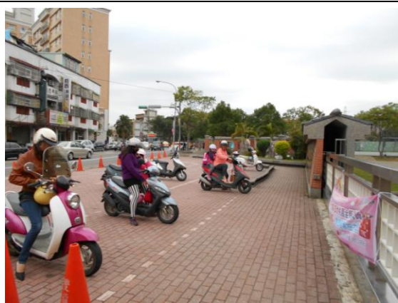
圖十 學生放學機車接送情形