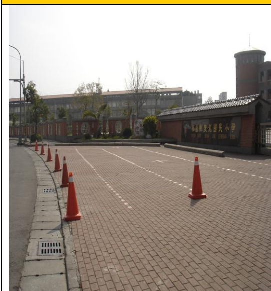
圖一 家長機車接送區入口