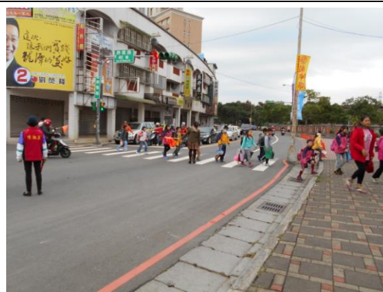
圖九 學生放學過馬路情形