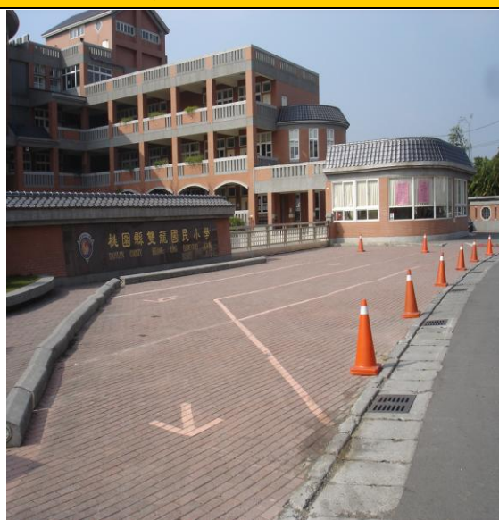
圖二 家長機車接送區出口