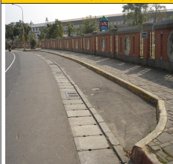
圖三 家長汽車接送區