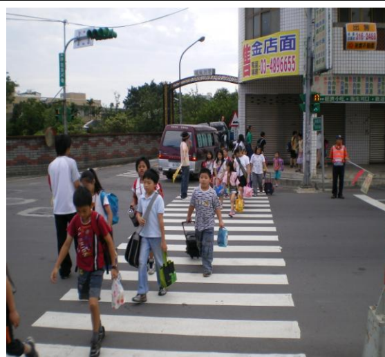
圖七 學生放學過馬路情形