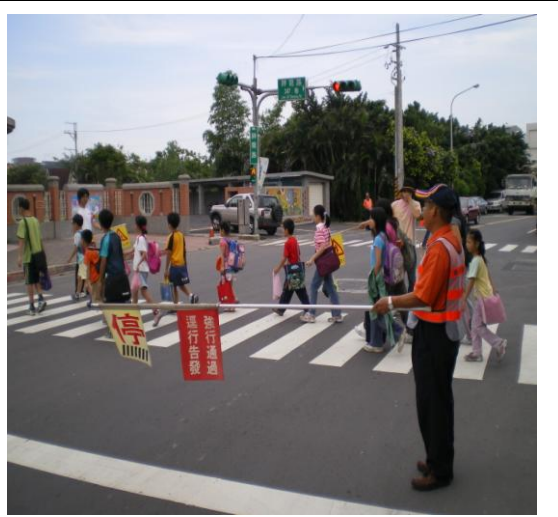
圖八 學生上學過馬路情形