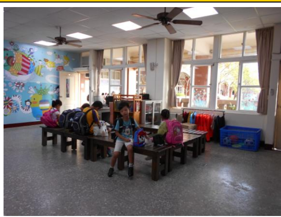
圖六 學生放學等候區等候情形