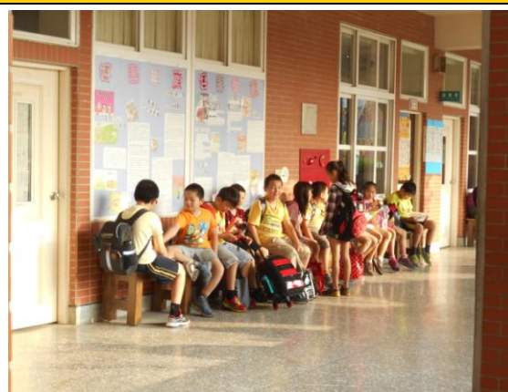
圖五 學生放學等候區