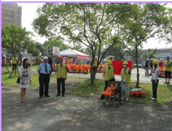
教育局長視導急救站