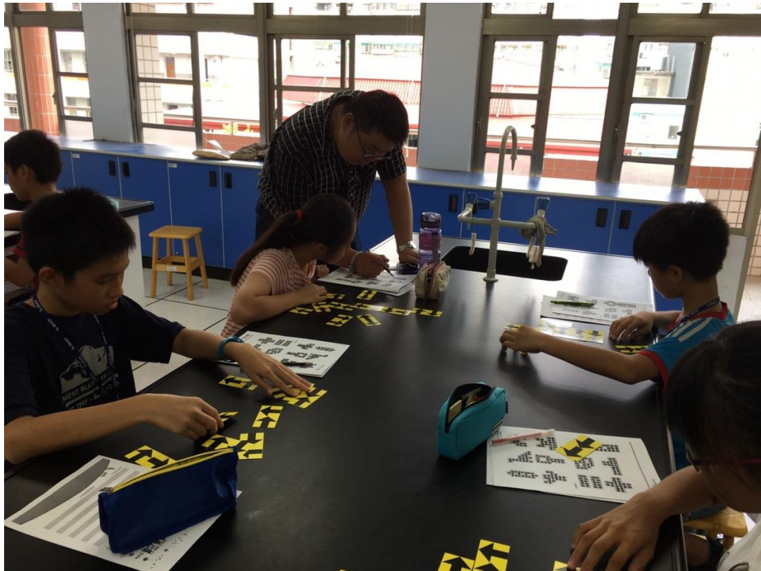
106 年度結合大學資源打造知識城-大成趣味數理語文營成果照片