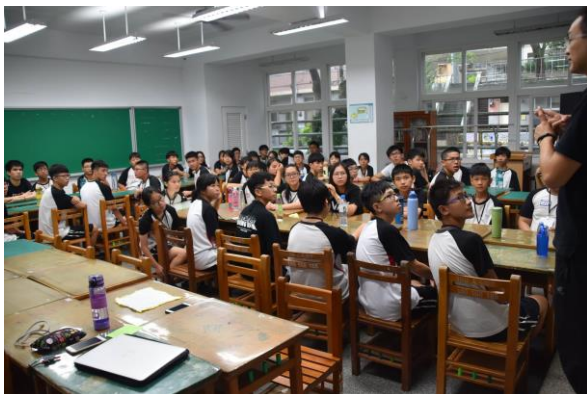
團體藝文賞析與樂理教學