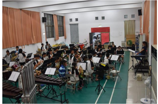
合奏練習-分部大集合驗收