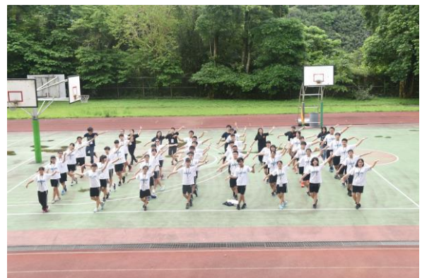
團體晨間活動-律動的森林舞