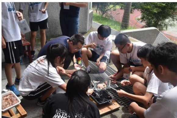
烤肉與野炊-覓食趣