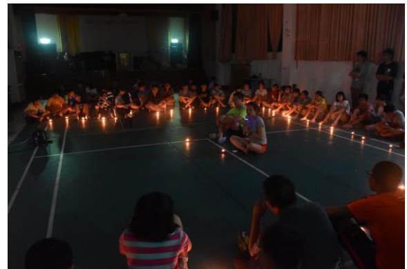
晚會團康與星空夜語呢喃-虔敬集會