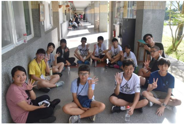
小組團康活動-紀律訓練