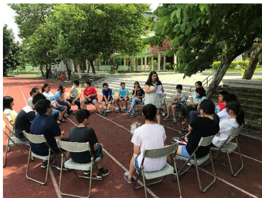
利用團體遊戲學英語