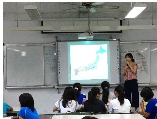
介紹日本地理位置、文化風情