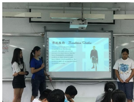
用英語介紹各地風俗民情