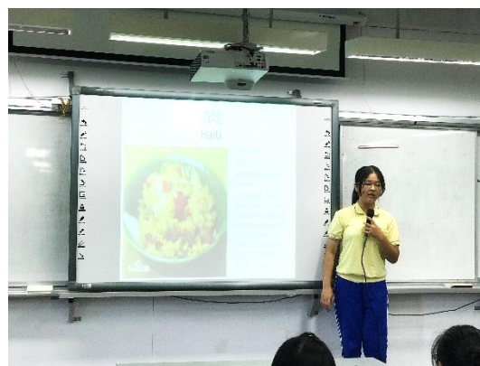
用英語介紹不同地區的美食