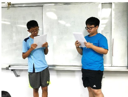
用英、日語自我介紹及介紹朋友