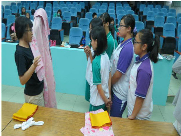
蘇老師介紹浴衣的穿法