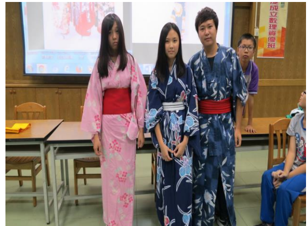
三橋老師帶領學生一起試穿