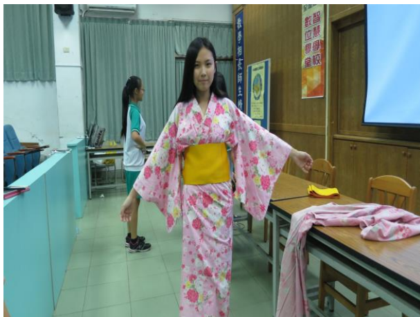
學生體驗穿著浴衣