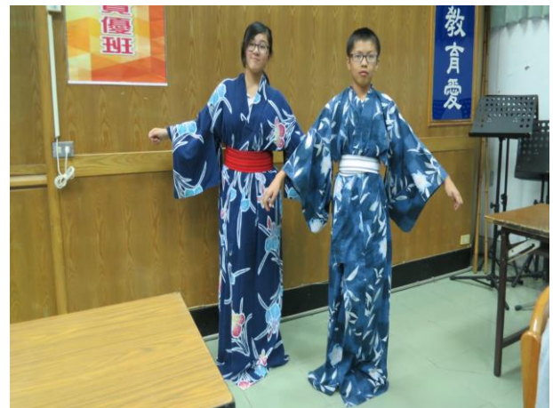
學生展示穿著浴衣的成果