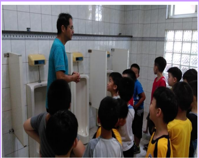
練習正確如廁方式