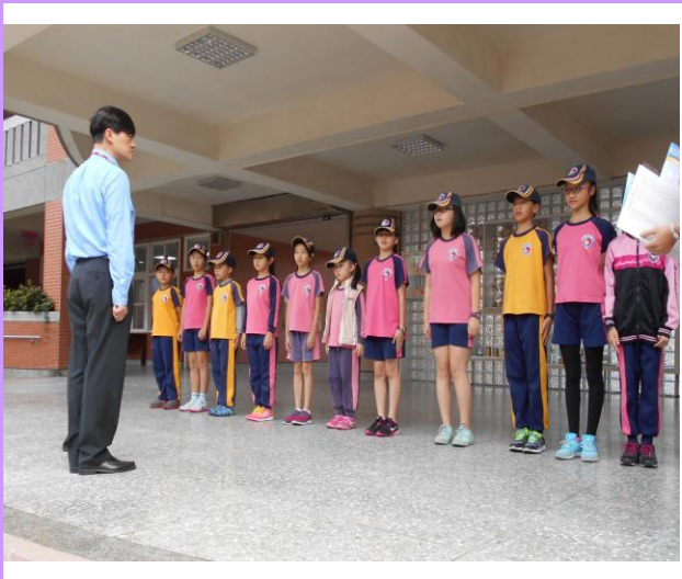
每週四的朝會頒獎給優質廁所獲獎的班級