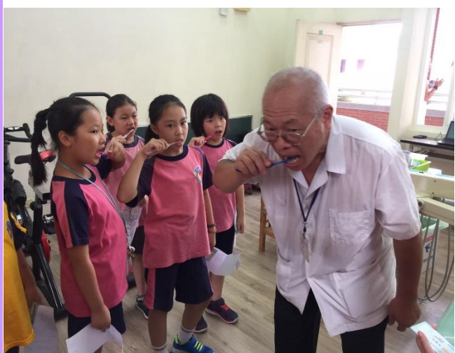
牙醫師認真示範給學生看如何正確潔牙並贈送學生牙刷牙膏。