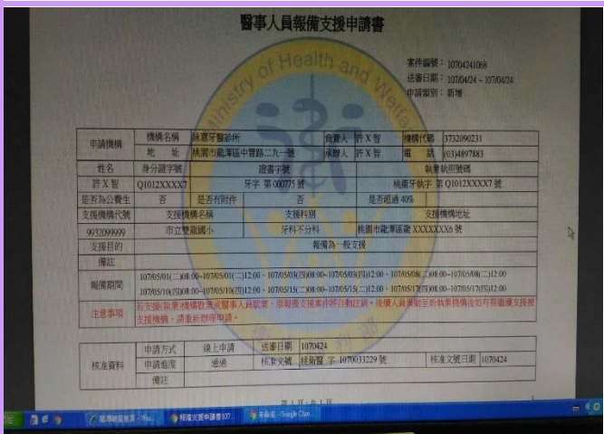
牙醫師到校服務行前衛生局資源報備