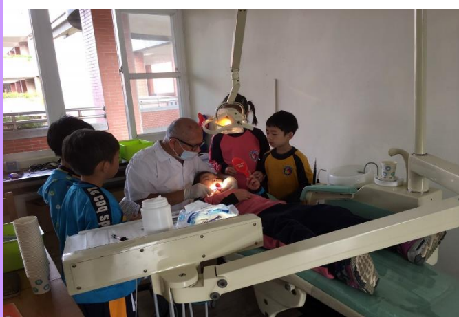
牙醫師為學生做口腔保健牙菌斑清除與免費塗氟，共同照顧學童牙齒。