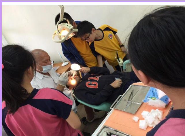
牙醫師為低學生施作窩溝封填、免費塗氟、牙菌斑清除與口腔保健衛教。