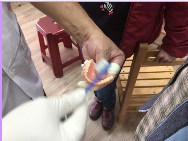
牙醫師親自示範潔牙技巧與常見疏忽的位置