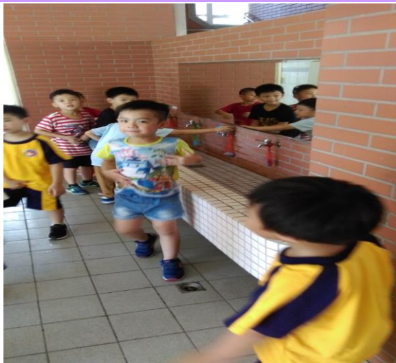
如廁禮儀—要洗手並不把水潑地