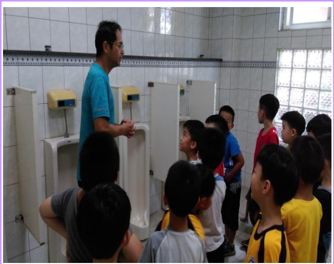
練習正確如廁方式