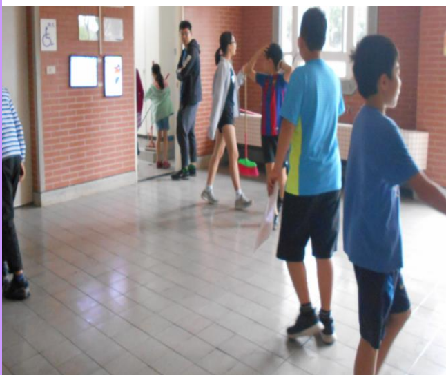
打掃時間老師實地到場指導清潔