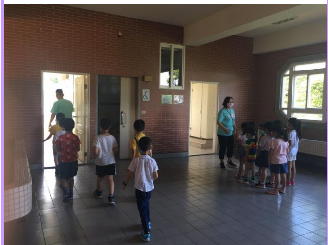
新生認識廁所的地理位置