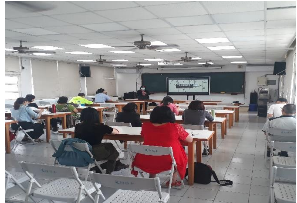
參與研習的教師在課堂學習情形