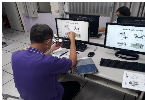
學員了解無人機各項構造