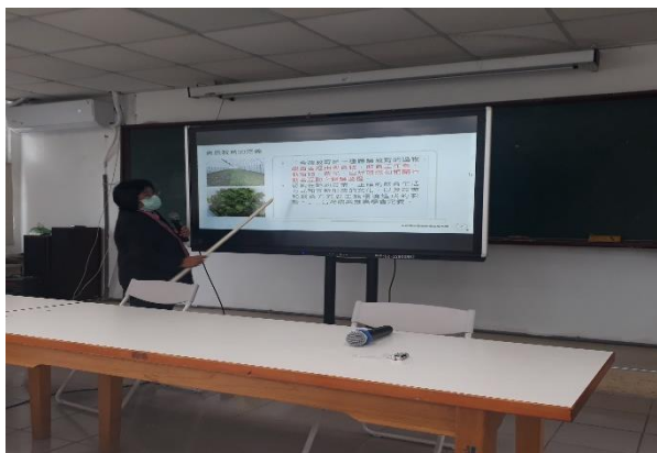
教導食農教育的應用