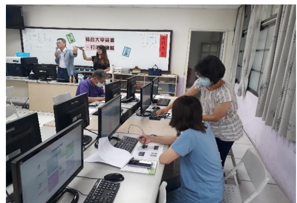
講師示範無人機操作