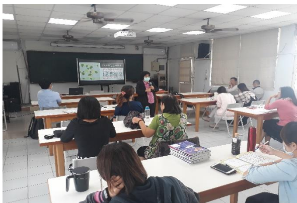
講授輪作與防治病蟲害議題