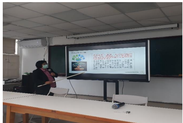
教導環境教育的議題