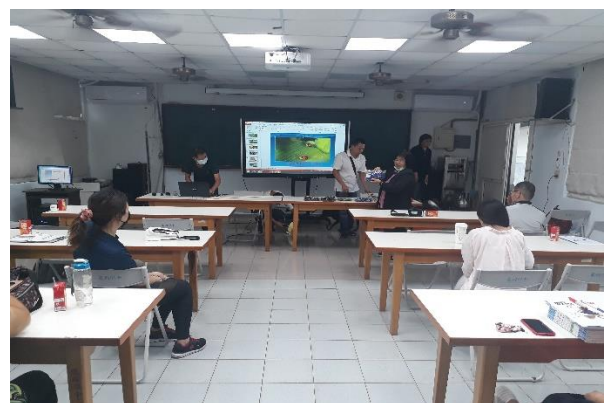
有機蔬菜栽種與方法