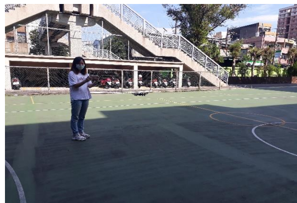
學員親自體驗無人機操作