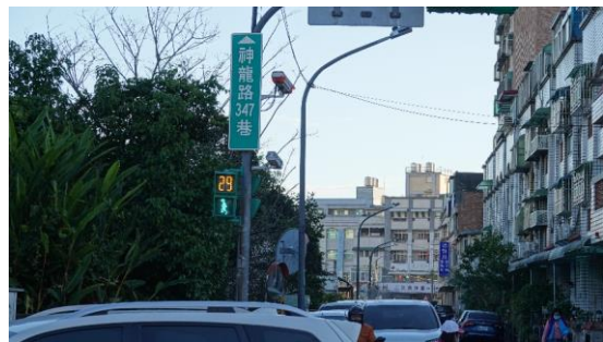
圖九 學生放學過馬路情形