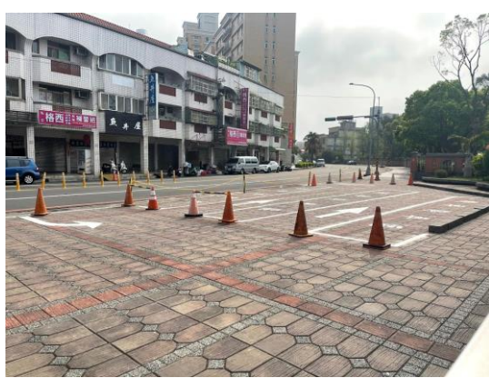
圖一 規劃家長機車接送區停車位