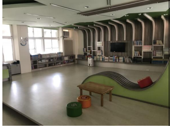
圖七 學生放學等候區