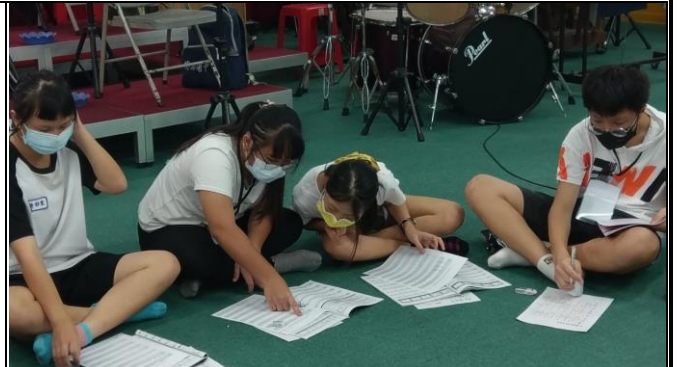
演出樂曲解析討論