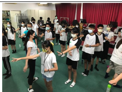
肢體律動/韻律呼吸教學