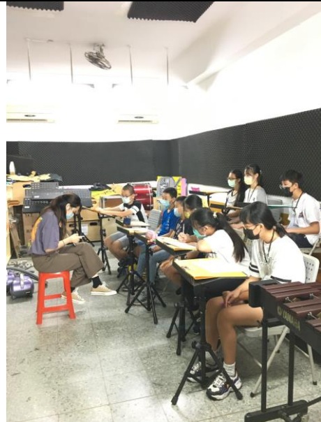
樂理引導分組學習