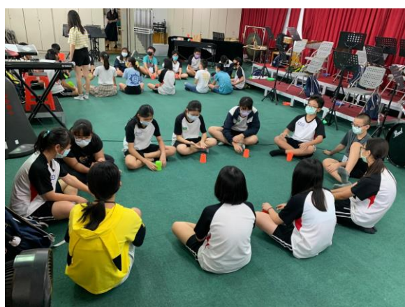
節奏創意發展活動