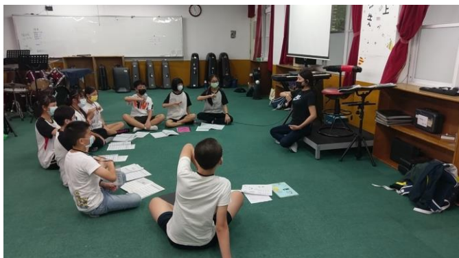
小組團康-節奏創意發展