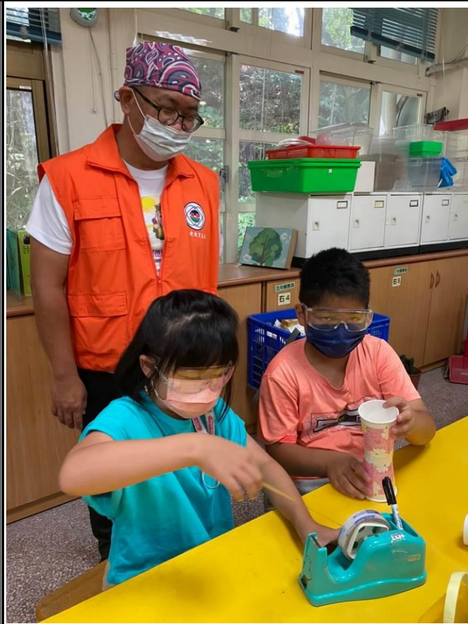
運用紙杯進行製作認識飛行原理