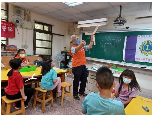
運用紙片製作迴力鏢