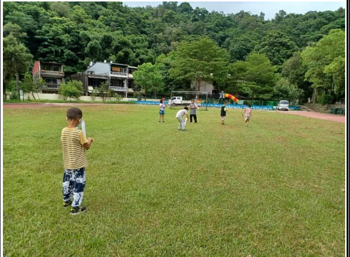
到戶外草地實際操作認識飛行原理