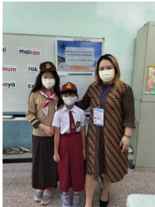
東南亞服飾介紹與體驗