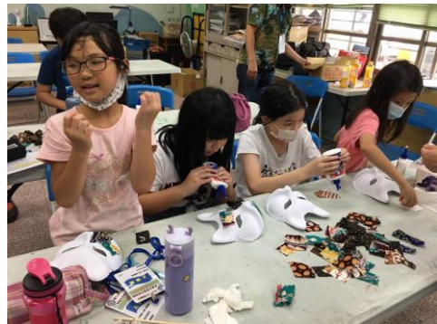
認識蠟染, DIY 手作面具