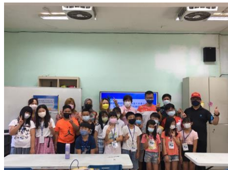
校長來為大家開場鼓勵