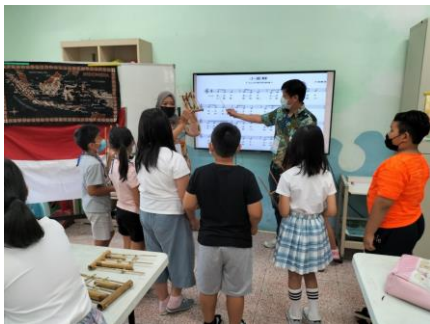
認識印尼文化, 搖竹