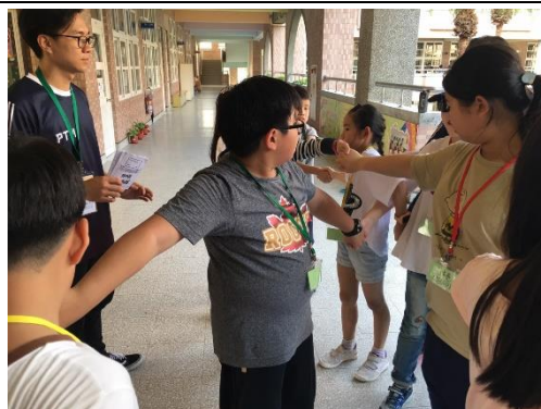
大地遊戲闖關活動