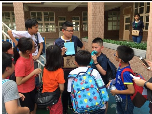
國際文化體驗營與孩子玩遊戲互動