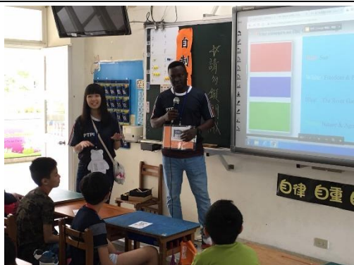
國際志工與孩子介紹他國文化