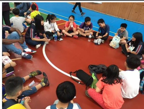
志工及小隊輔與孩子相見歡