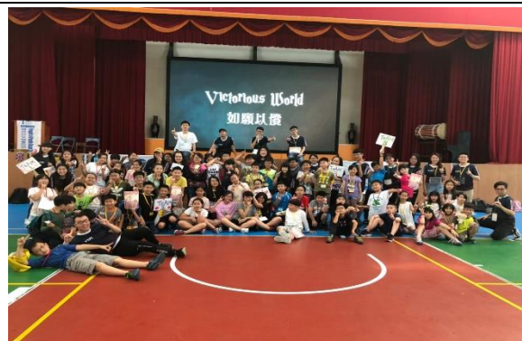
國際文化體驗營全體大合照