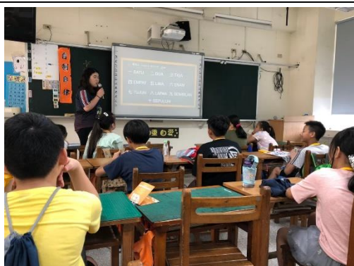
馬來西亞志工與孩子介紹異國文化