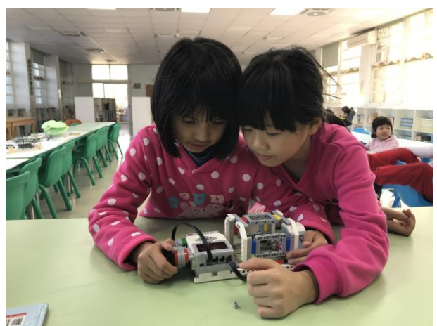
學生進行機器人組裝與程式設計