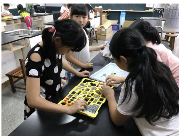
學生進行機器人組裝與程式設計