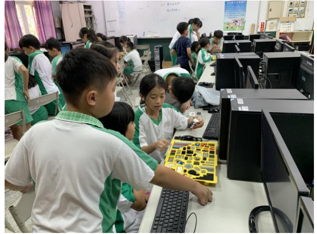
學生進行機器人組裝與程式設計