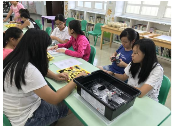
學生進行機器人組裝與程式設計