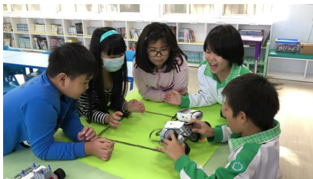
學生進行機器人組裝與程式設計