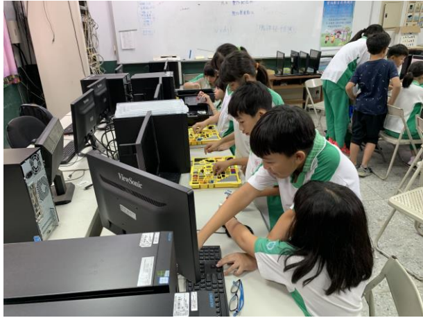
學生進行機器人組裝與程式設計