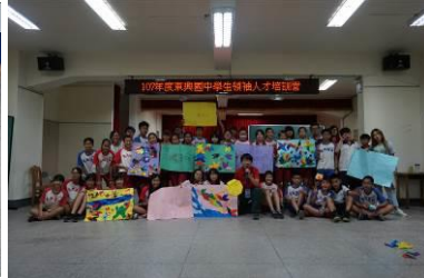
生涯規劃與人生哲學