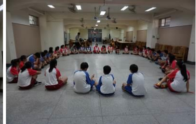
反思、回饋與綜合討論