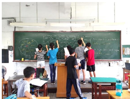
同學們上臺發表初體驗