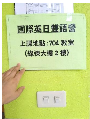
7/9 課程馬上要開始囉