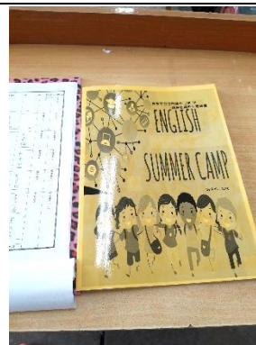
由新生醫校老師精心設計的自編教材