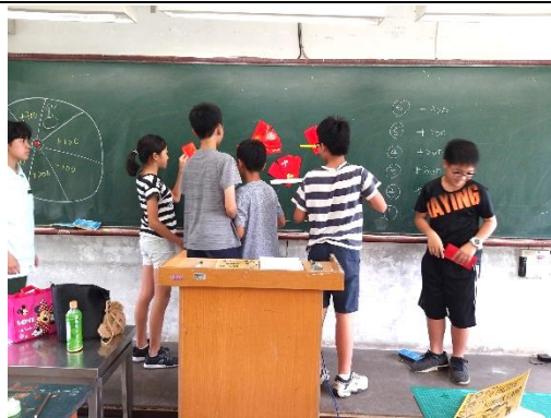
老師安排分組競賽，進行分組合作學習