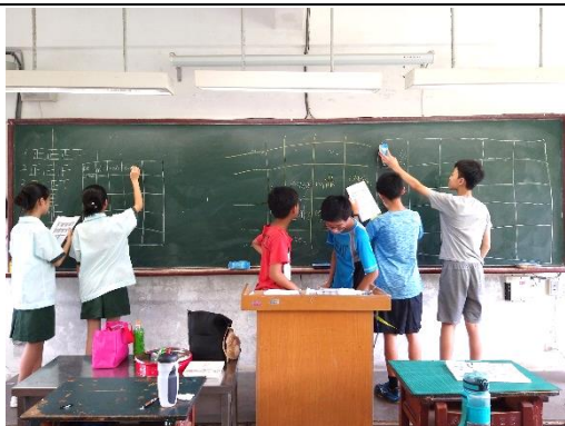
老師安排單字賓果，加強同學學習動機