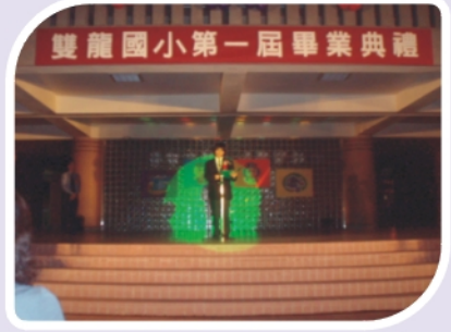
老師的祝福與叮嚀