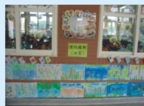
二年級生態學習成果展—水生小書及寫生作品