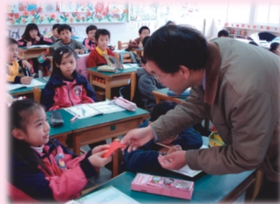
新年快樂~吉祥如意