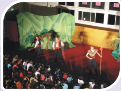
九歌兒童劇團展演