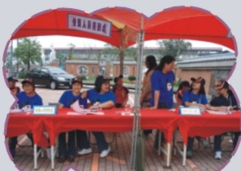
支援學校慶典活動