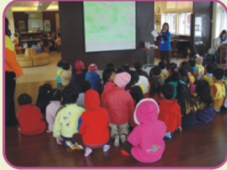
1/10諾貝爾幼稚園小朋友參訪本校圖書館，志工解說圖書分類及借用辦法