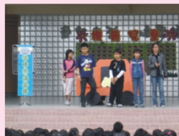
以戲劇方式宣導法律常識，落實法治教育。