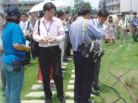
國立教育研究院率儲備主任們分組聆聽觀察與欣賞