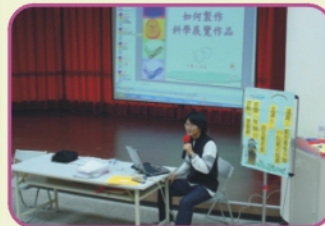
4/11保嘉老師分享科展指導心得科展是以學生為中心的主題探究教學