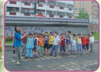
6/13志工為丹妮幼稚園小朋友導覽校園並介紹校園建築之美