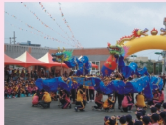
舞動雙龍慶讚落成