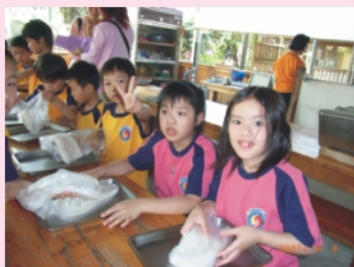
二年級-農場體驗做板條