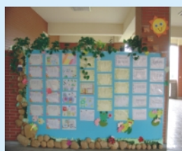
五年級生態學習成果展—水生池詩歌篇