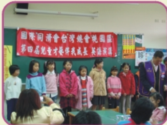
3/18同濟會在本校辦理「伴我成長」兒童才藝競賽，全縣選手齊聚一堂