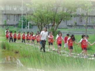
5/23文華幼稚園隊循序進入生態池觀賞生態池物種之美