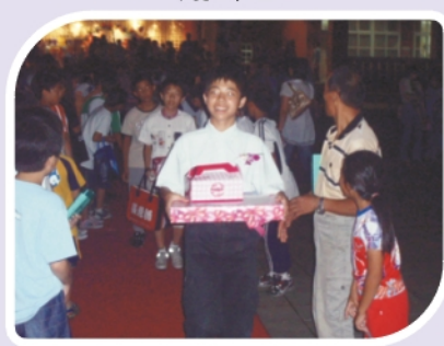
明日雙龍以你們為榮