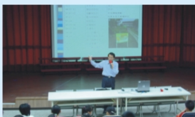
校長說明生態池的建造過程需感恩惜福