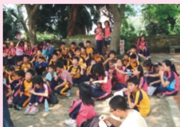
五年級-十三行博物館