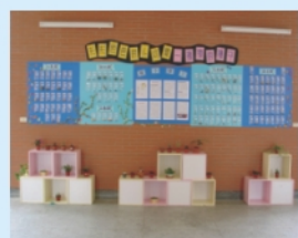
自然領域小組動員師生規劃布置的種子教室