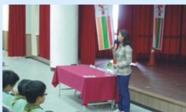
地球日當天講座桃園縣政府農業局長蒞臨指導