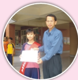
校長頒發當選證書