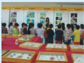
邀請志工為小朋友進行解說「精品香農場」借展蝴蝶標本

本學期在統一超商贊助經費及荒野保護協會志工協助指導下,本校生態活動更多元豐富,孩子及家長在此生態學習樂園中徜徉,進行每一堂知性感性兼具的生態課程,在大自然中學習生活、生態及生命的哲學。