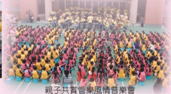
親子共賞管樂風情音樂會