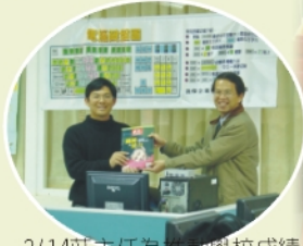
3/14莊主任為推動學校成績處理系統電腦化不遺餘力，辦理多場學務管理研習