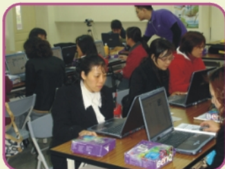
3/6 BenQ友達基金會規劃學習數位課程，提供志工一人一機操作練習網路運用並了解孩童上網行為