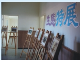
結合生物多樣性講座辦理生態攝影特展