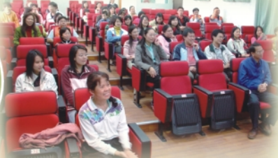
3/28由校長領軍與小而美的百吉國小交流生態教學的心得