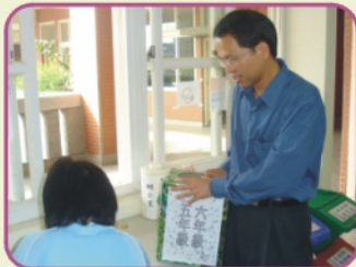
6/14為獎勵認真閱讀學生，本學期舉辦CD音響抽獎活動，校長抽出高年級閱讀活動中獎同學