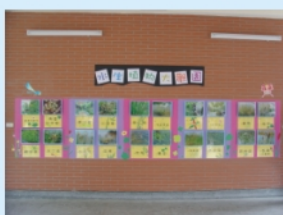
由自然領域教師共同布置完成的水生植物介紹