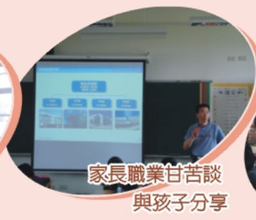
家長職業甘苦談 與孩子分享