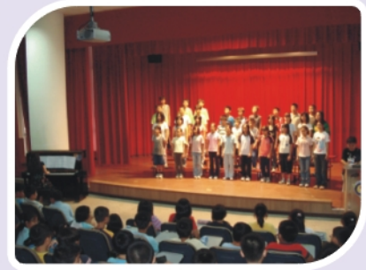
畢業生才藝發表會