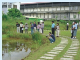
苗栗縣永續校園輔導團32位校長主任蒞校參訪