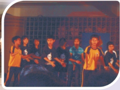
學弟妹賣力的演出