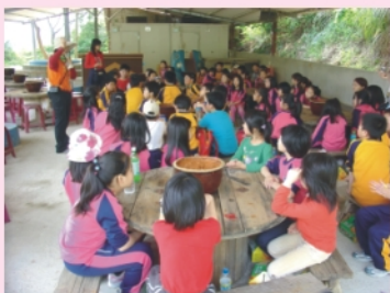
三年級-農場體驗做鹹蛋