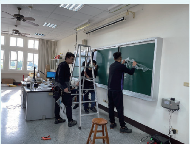
全校專科教室完成裝設86吋觸屏及開合式黑板