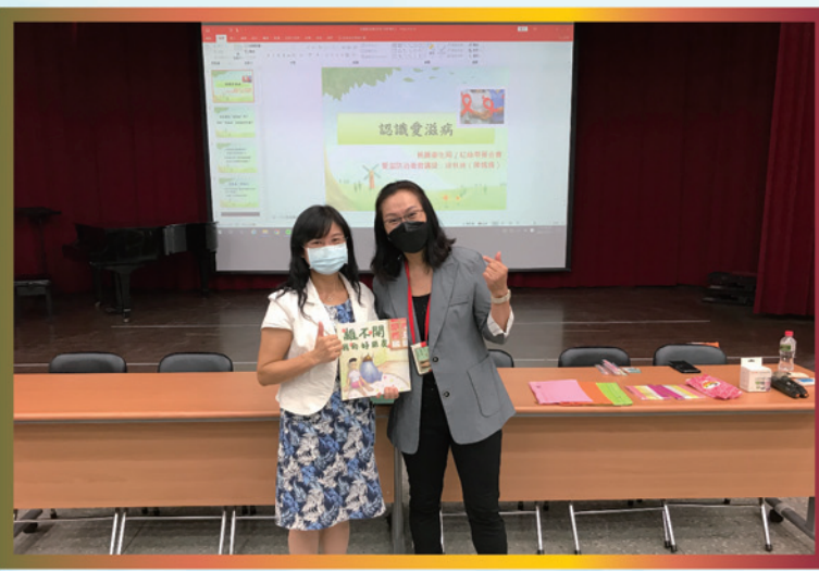
講師贈送有關愛滋病教育的相關書籍