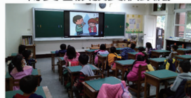
特教宣導活動-影片欣賞