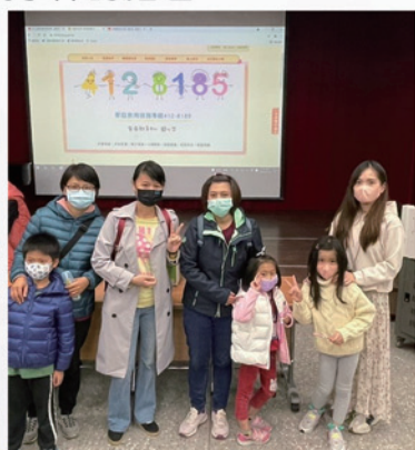
參加講座的家長， 獲贈家庭教育中心宣導獎勵品