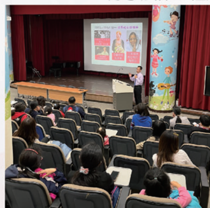
突破性別刻板印象 認識女性領袖典範