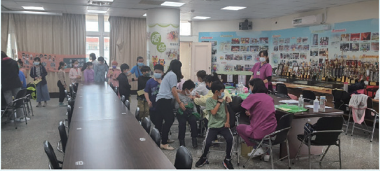
全校師生施打流感疫苗提升群體免疫率