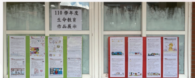
生命教育優秀作品展示