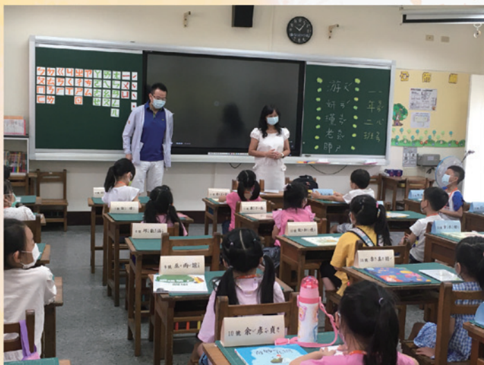
大家坐好，準備上課了！