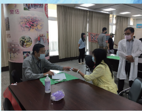
校長帶領師生施打流感疫苗提升群體免疫率