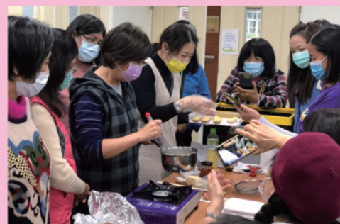
開心製作手工甜點