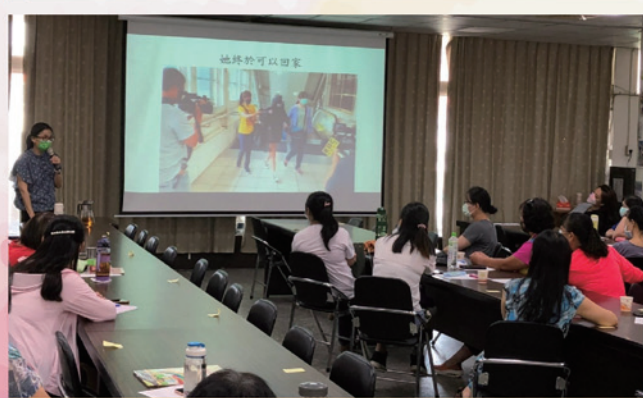
邀請古靜如調保官進行法律增能研習