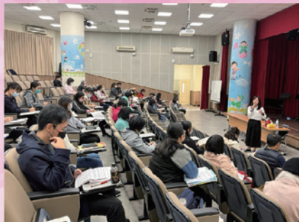
教職員工認真參與研習活動