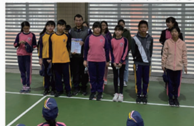
六年級30達人比賽 得獎者頒發獎狀鼓勵