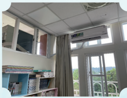
班級教室圖書角冷氣裝設