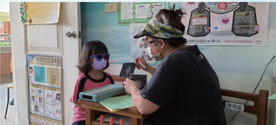
一年級新生進行立體圖篩檢