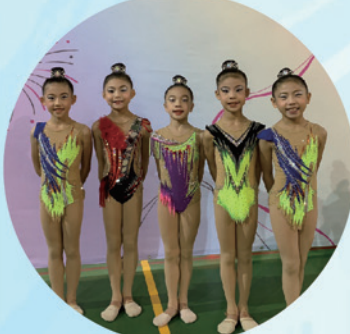
110全國韻律體操錦標賽剪影