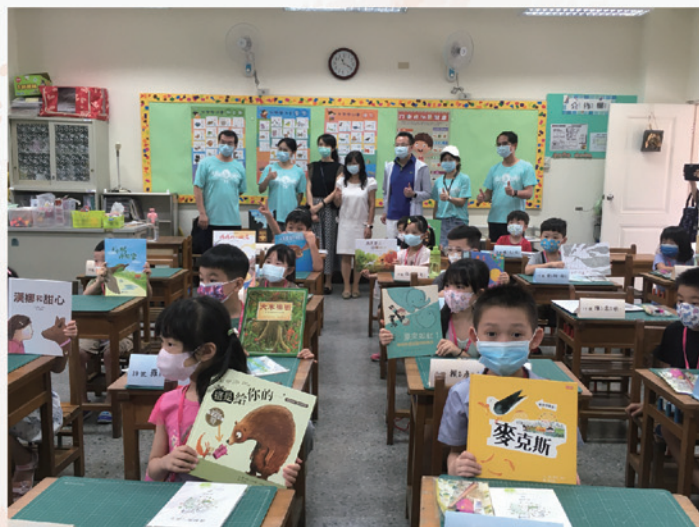
好棒！每個人都有一本繪本！