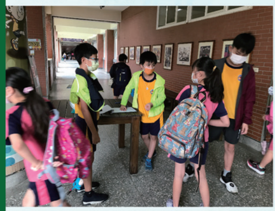
檢測完畢將書包交還給學生