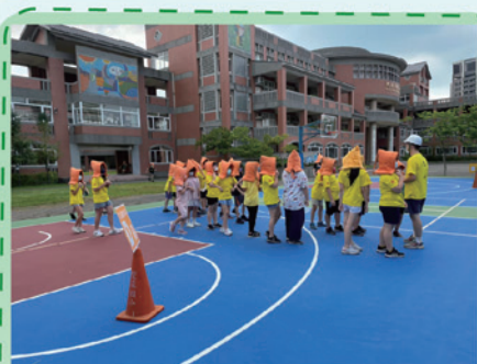
防災避難總集合區路線演練