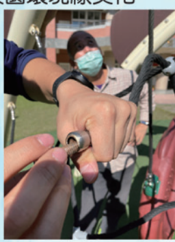
龍遊具攀爬架修復