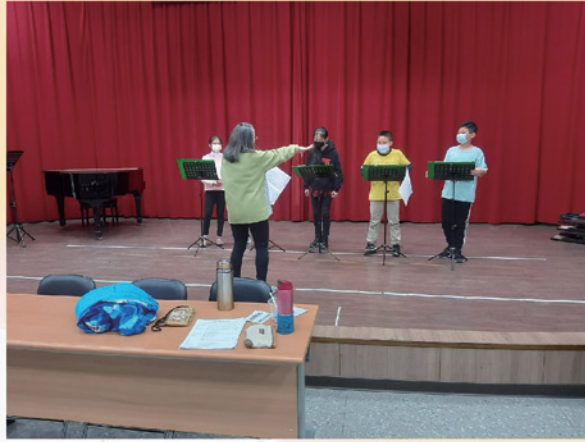
英語讀者劇場競賽平時練習