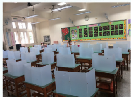
全校用餐使用防疫隔板，並於放學後進行清消作業