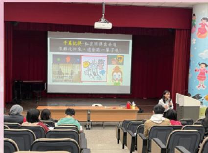
說明網路數位性別暴力的後果