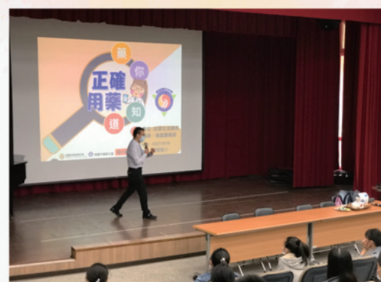
教導正確用藥的觀念