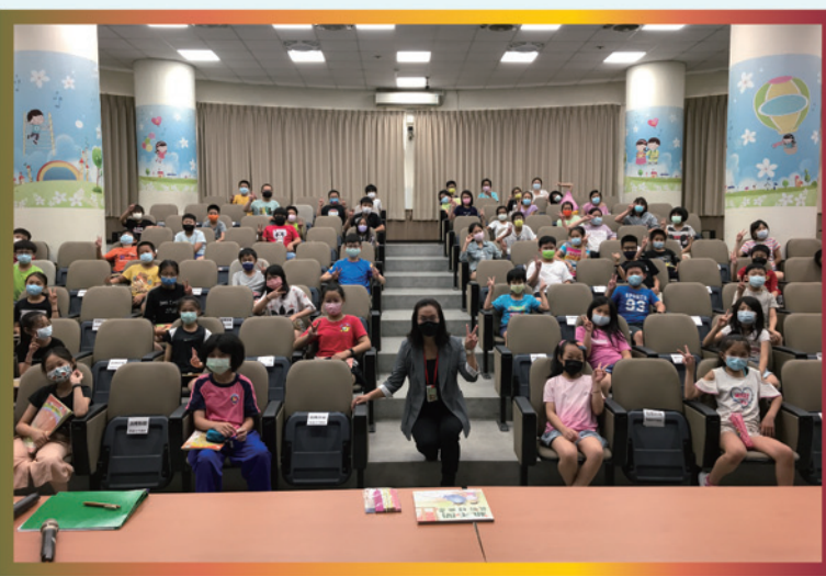
講師與全體學生合影