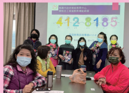
校長致贈親子雜誌給有獎徵答獲獎者