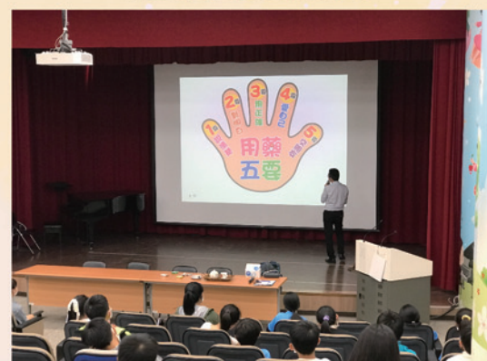
用藥的五大主題介紹