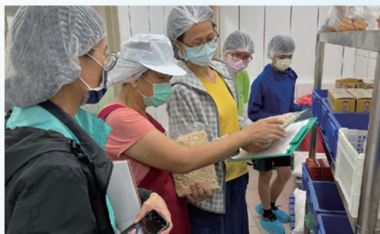
每學期不定期抽訪午餐廠商，查看環境衛生及烹煮工作等情形