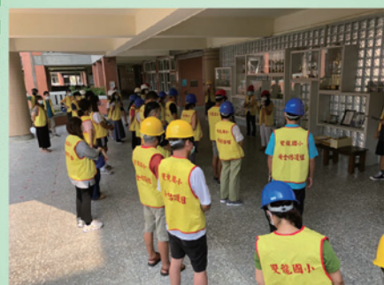
指揮官及各分組工作確認