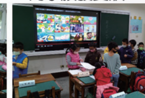
特教宣導班級活動