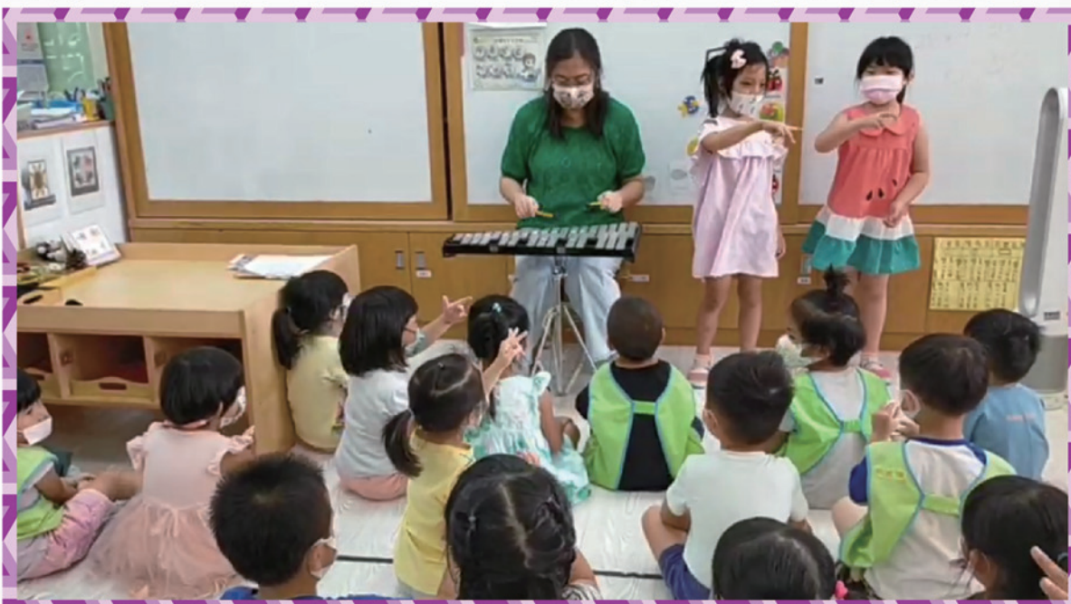
搭配樂器與手勢唱英語歌謠：Five little ducks