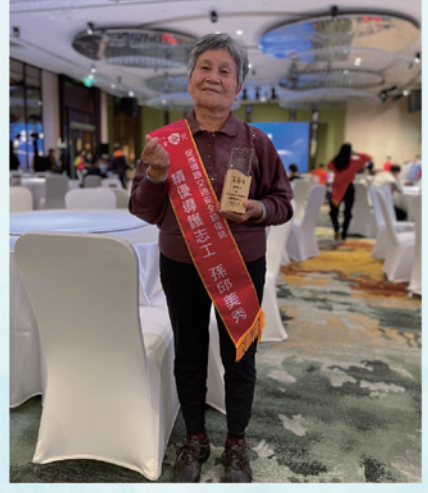
本校孫奶奶代表桃園市榮獲交通部110年金安獎-績優導護志工