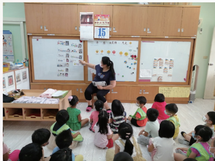
晨光時間：英語點點名