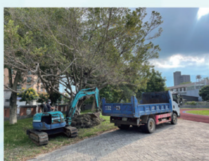
感謝家長會提供經費支援校園環境綠美化