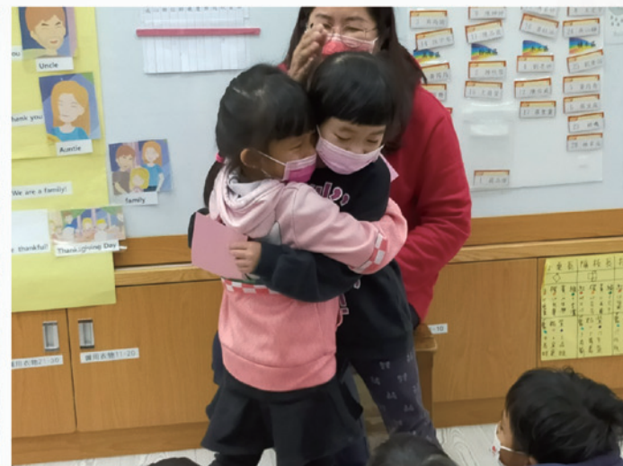
感恩節遊戲：小天使小主人相見歡