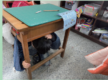
教室內防災避難動作演練