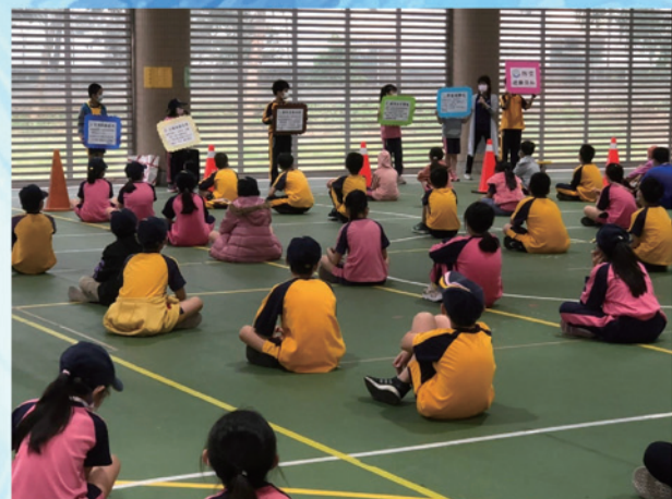
中年級防空避難須知宣導