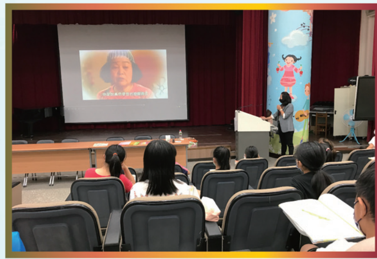
觀看愛滋病教育相關影片