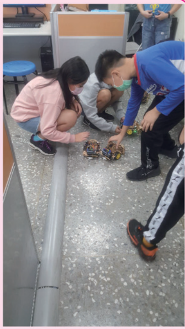
小朋友實際操作自動車