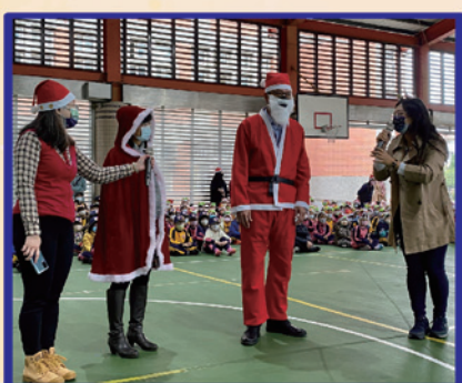
校長和家長會長 扮演聖誕老人與孩子同樂