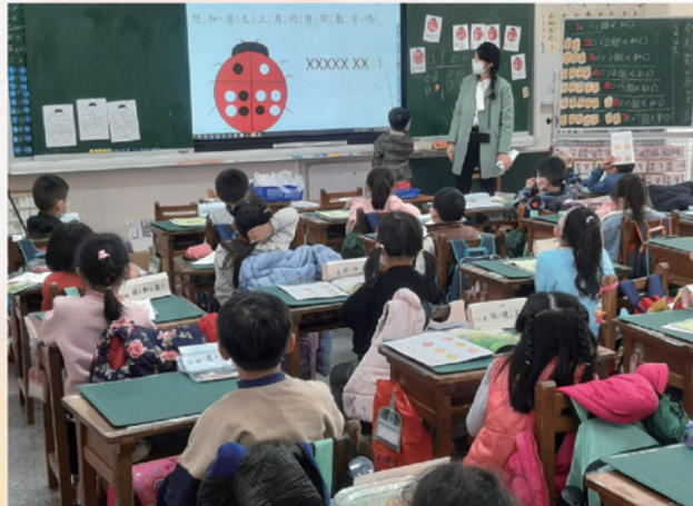
跨校公開觀課學生上臺點選正確答案