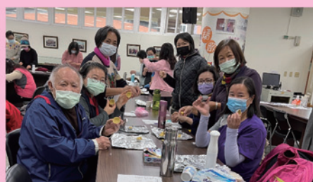
開心參與活動，樂在其中