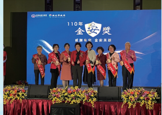
感謝孫奶奶為雙龍交通安全無私的付出與奉獻