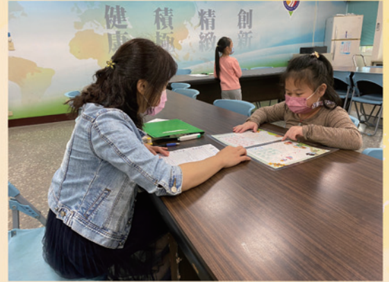
第一關攻佔城堡 能正確排出注音符號