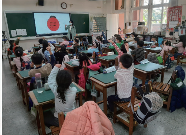
跨校公開觀課學生踴躍發表