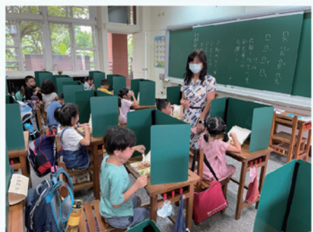
開學日校長關心一年級學生用餐情形