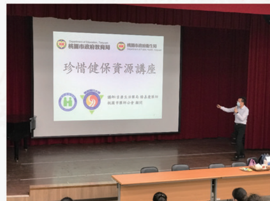
全民健保相關常識宣講