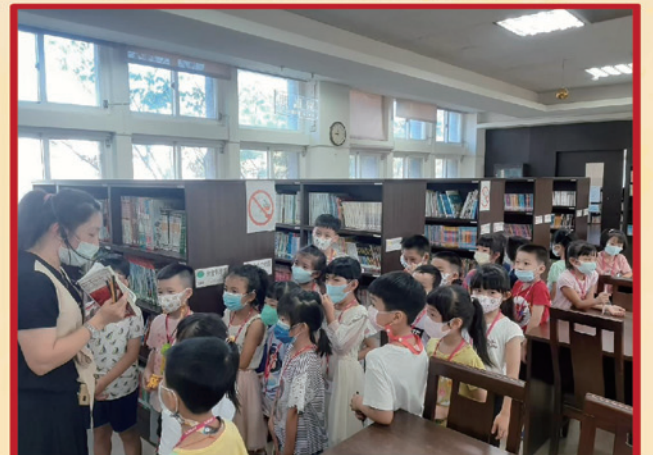
圖書館利用教育小朋友聽講圖書內容