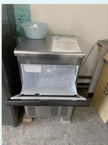
採購防護運動受傷專用製冰機