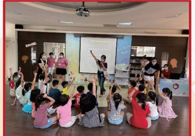
圖書館利用教育小朋友踴躍發表