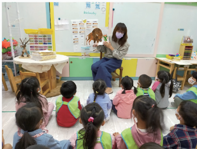
聆聽英語故事：From head to toe