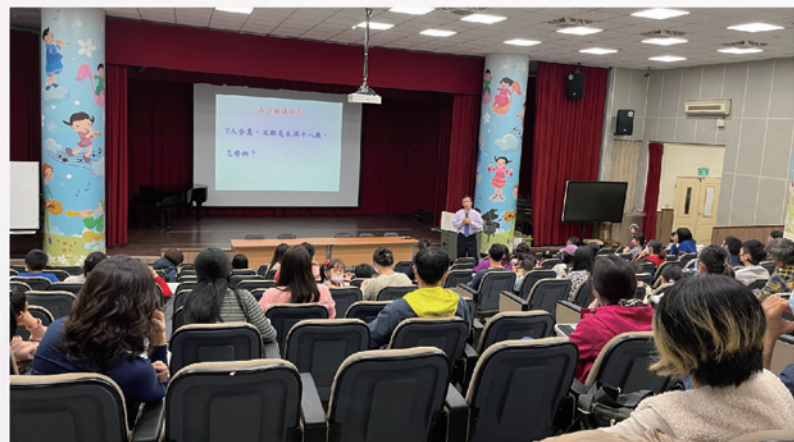
分享法律上性別事件的處理