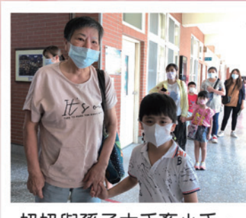
奶奶與孫子大手牽小手，一起到校參與新生入學活動