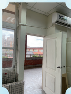
美勞專科教室冷氣裝設