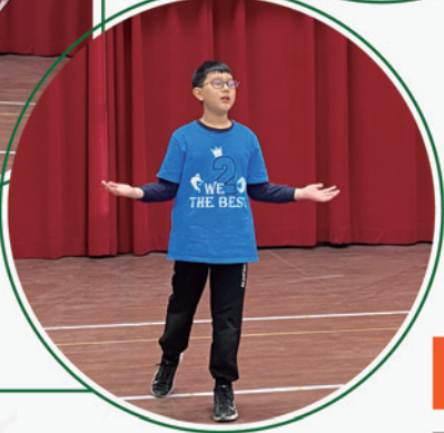
五年級 英語說故事比賽