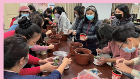
大家一起動手做，樂趣多