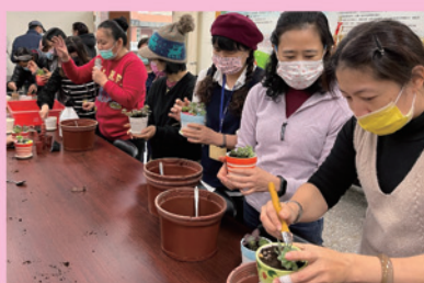
盆栽作品-慢慢成形