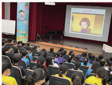
教導學生認識身體自主權