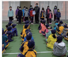
生命教育得獎的 同學頒發獎狀