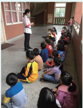
一、四年級全身健康檢查前詳細說明流程步驟