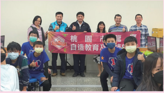
與龍潭國中自造中心進行跨校合作