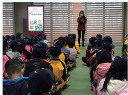
「飲食紅綠燈」營養教育宣講活動