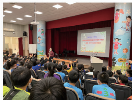
精采演說，吸引學生熱情參與