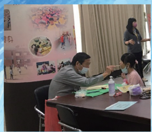
醫師看診後才給予醫囑實施注射