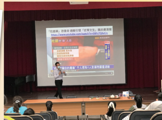
用錯藥的案例說明