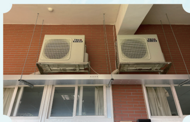
四樓自然教室室外機裝設