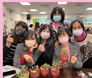
志工分享DIY的手作盆栽成品