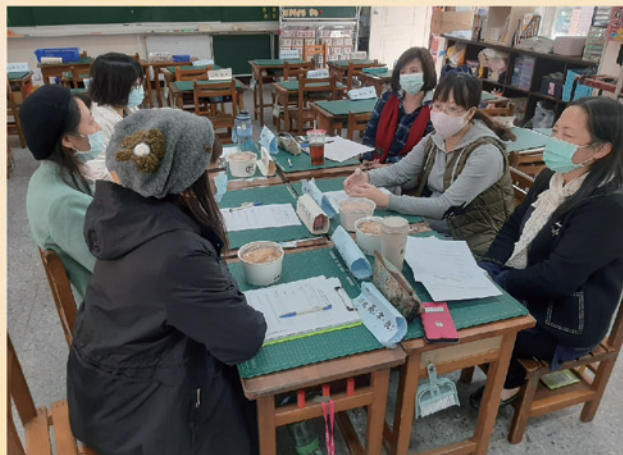
跨校公開課教師進行議課