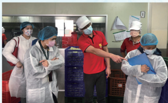
抽訪午餐廠商，了解午餐製備過程