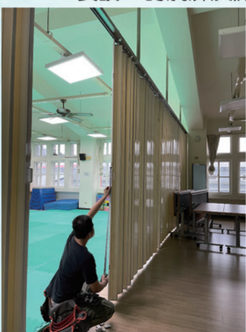
感恩樓三樓綜合教室增設拉門隔間