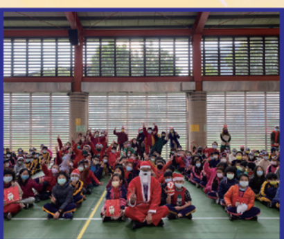
聖誕嘉年華聖誕老公公發禮物