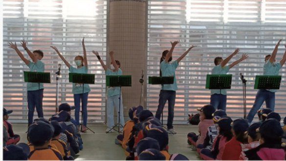
英語讀者劇場競賽場學生朝會表演