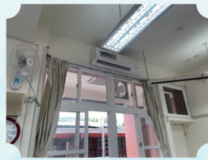
班級教室前方冷氣裝設