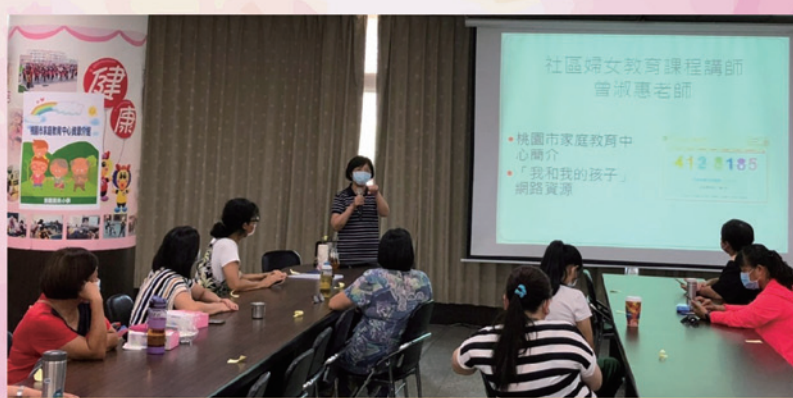
講師介紹家庭教育中心的功能與應用