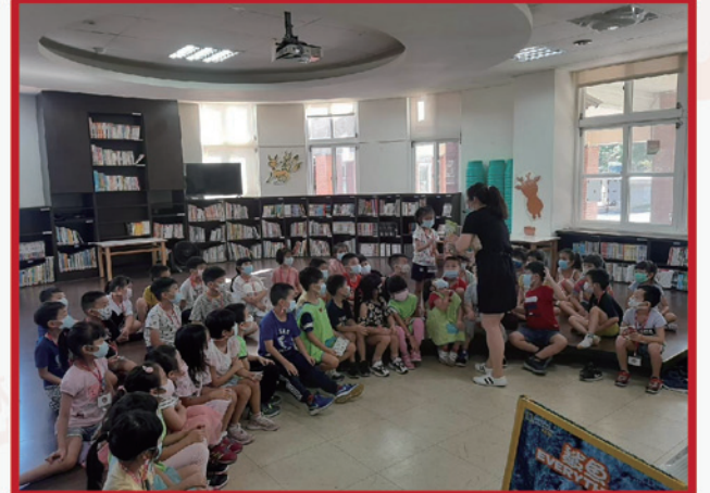
圖書館利用教育小朋友專注聆聽講解