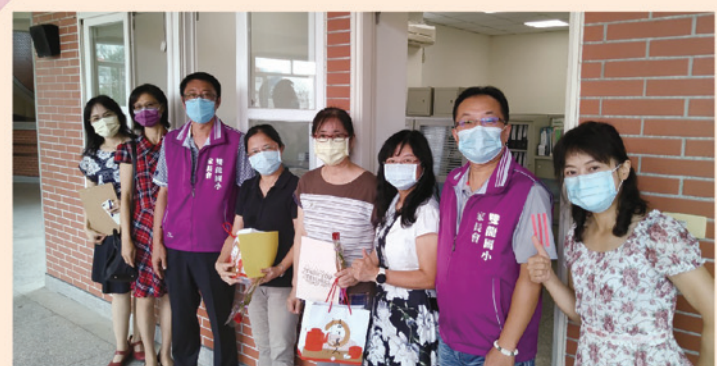
校長與家長會委員致贈教師節禮物