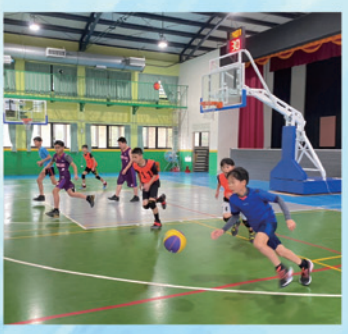
迅速敏捷的籃球隊