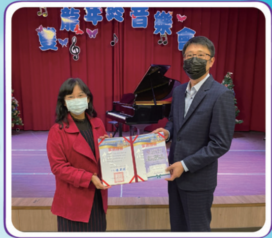
桃園市龍潭區雙龍國小 110學年度家長會常務委員名冊