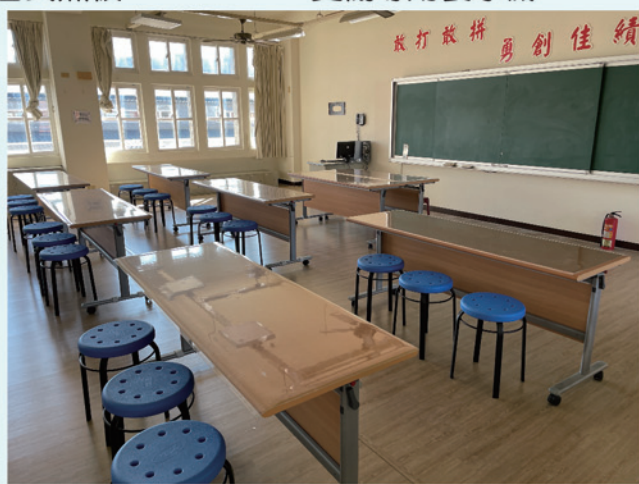
感恩樓三樓綜合教室部分規劃為中年級自然課使用