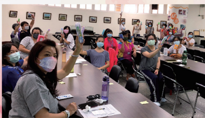
全程參加研習者獲贈家庭教育中心宣導獎勵品