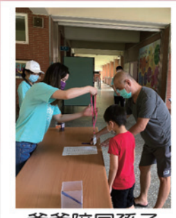
爺爺陪同孫子到校參加新生活動