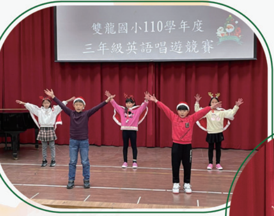
三年級英語唱遊比賽