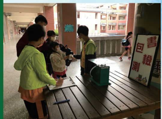
登錄學生基本資料