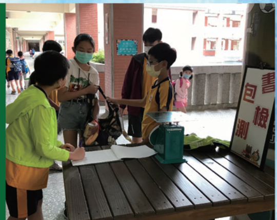
仔細核對相關資料