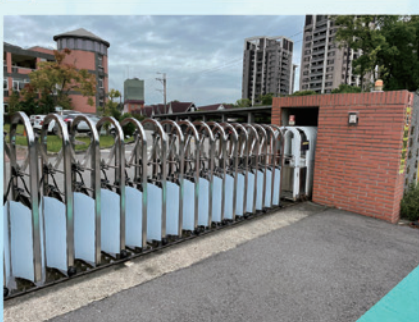
加裝紅外線感應及車道伸縮門更新