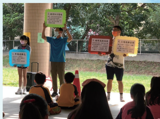
高年級防空避難須知宣導