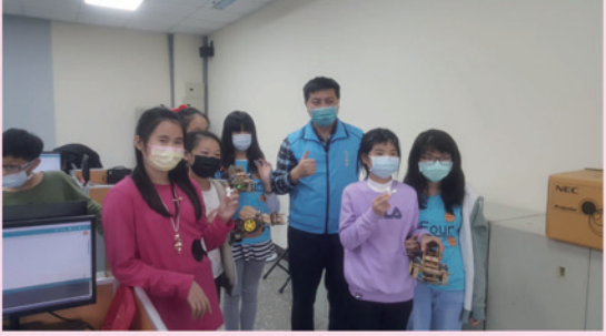
小朋友進行自動車體驗課程