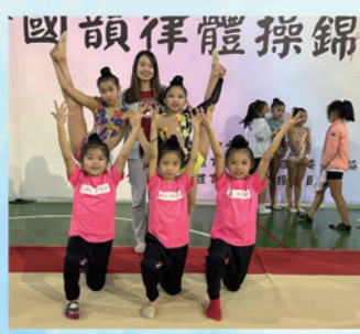
110全國韻律體操錦標賽剪影