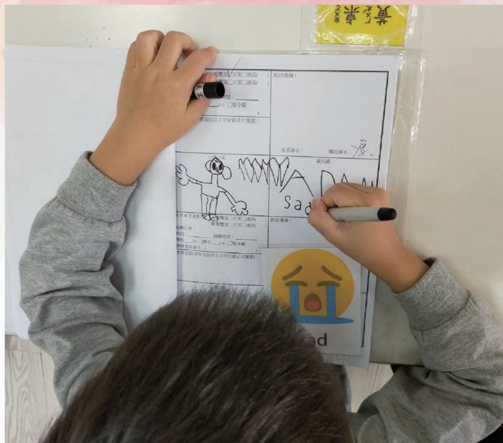
心情畫融入句型：How do you feel today?

幼兒園依現行幼兒教保及照顧服務實施準則規定，可以由班級教師採融入非分科的方式實施英語教學，鼓勵幼兒探索多元文化、培養學習興趣，以聆聽歌謠、說故事及玩遊戲等適合幼兒學習之方式融入教學。依據此原則，我們於109學年度開始嘗試在原本的課程架構下，適當的融入英語教學，更是桃園市第一間受推薦參與國教署英融試辦計畫的公幼（配合2030雙語國家政策），在教室情境中營造多元文化的情境，建立重溝通的語言學習環境，讓幼兒樂於探索英語不害怕！而教師群也透過輔導的機制，每月固定與教授進行專業對談，以掌握英融的教學品質與內涵精神。110學年度起，除了原有的例行性活動融入和文化節慶體驗之外，我們還新增了歌謠部份：選擇簡單有趣的兒謠，讓幼兒先聆聽歌詞，透過動畫幫助理解意義，接著是老師逐句示範，搭配手勢動作或樂器，遊戲來讓幼兒跟唱，抓出關鍵字進行單字替換，多利用轉銜的時間來聆聽與說唱，發現不同語音營造出來的趣味性，漸漸將這些內化到腦袋中，就能自然而然的培養出幼兒的好語感！