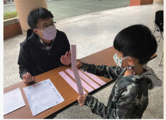
第三關我讀我說 能正確讀出句子