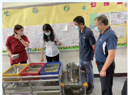
110學年度家長會長及委員入班關心師生用餐情形