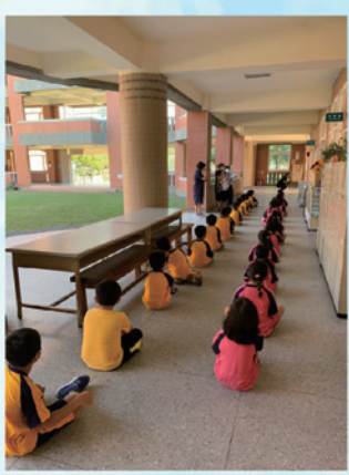
視力保健衛教及宣導