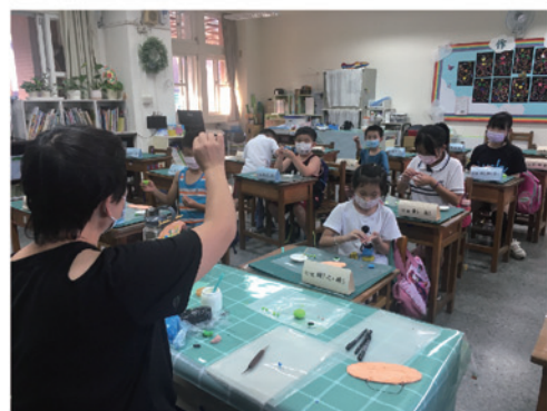
好玩黏土生活拼貼