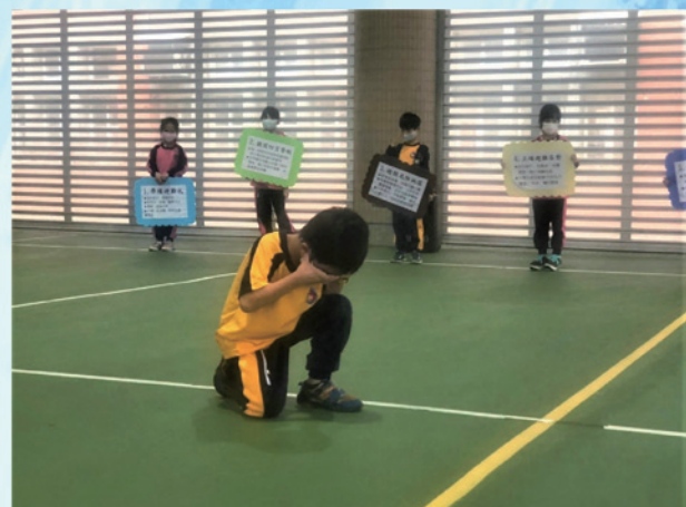
低年級防空避難動作示範