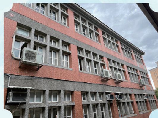
專科教室冷氣室外機裝設