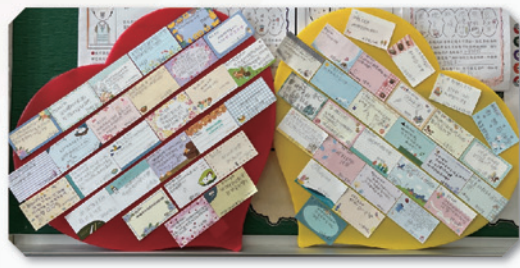
學生精心製作教師節敬師卡片