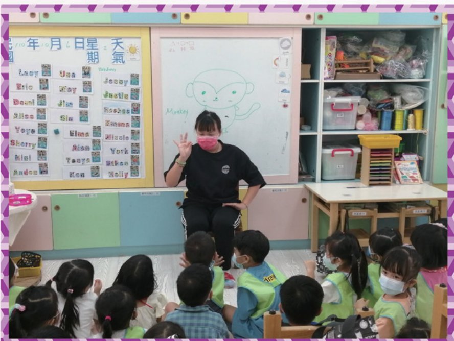
教師示範逐句教唱英語歌詞：Five Little Monkeys