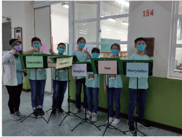
英語讀者劇團隊參加全市競賽