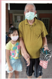
新生入學，一起手牽手進入校園