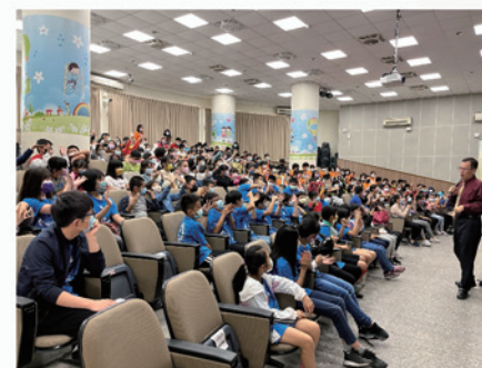
講師生動的演說，學生獲益良多