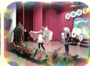
透過精彩的展演和團員們的精彩表現，體驗到每一個人存在的價值