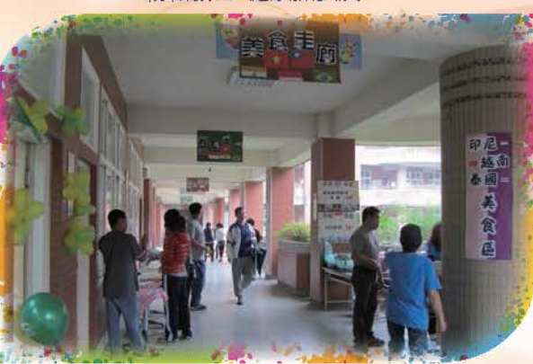
親職教日-異國美食區