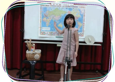
穩健的台風和豐富的內容，看到雙龍國小的朋友語文素養潛力無窮