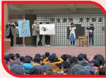
愛眼守則—四電少於2：少接觸聲光電器。介紹眼睛穴道按摩運動，動作示範與圖示說明