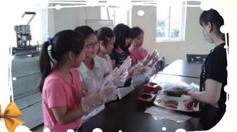
辦理暑假客家美食夏令營，小朋友親手製作甜美的點心