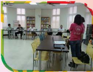
評選午餐供應廠商

從評選優良供應廠商、嚴謹的供餐與驗核計畫、學童營養衛生教育及用餐禮儀指導等，踏實的執行每一個環節，縣政府訪視委員一致肯定，本校再度榮獲評選為特優。