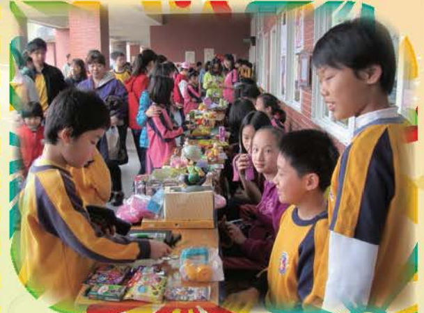
親職教日-家長熱烈參與跳蚤市場