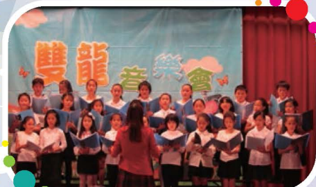
102. 05. 10合唱團演唱「媽媽謝謝您」表達感恩生