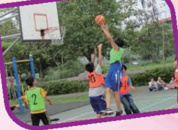
三對三籃球賽，戰況激烈，高手備出