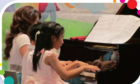
母子女六手聯彈輕快的「圓舞曲」