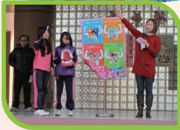
護理師及小護士於朝會時間進行宣導，教導全校同學正確刷牙的方式