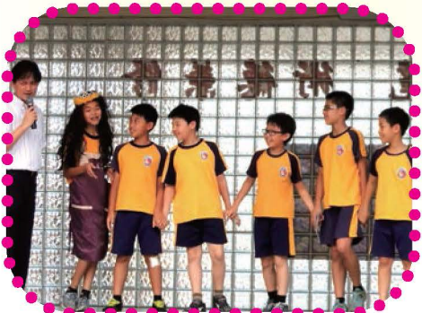
韻竹老師帶領學生參加全縣英語朗讀與說故事比賽，表現優異