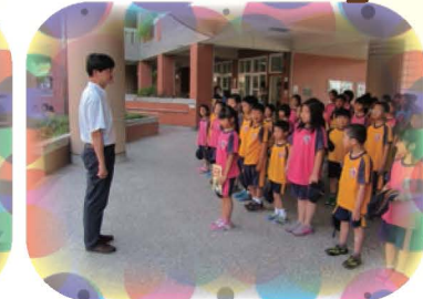
校長將優良圖書贈送給小朋友，希望大家都是惜書愛書的小天使