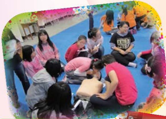
學利來 安妮考 六年級 依安操 用作者 及口試