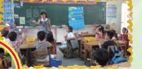
暑期閱讀與文學創作營，同學享受一週免費的文學饗宴