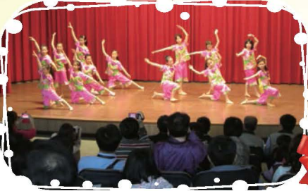
在優美的儀態與歌聲中，台上與台下和樂融融，師長們也看到我們練習的成果