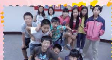
本校辦理環保擂台賽初賽，學生在寓教于樂中學習環教知識