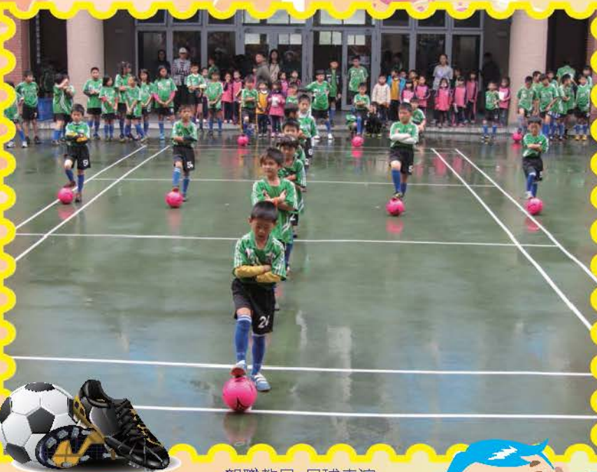
親職教日-足球表演