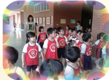
志工媽媽擔任解說員，帶領文華幼稚園的小朋友參觀本校校園