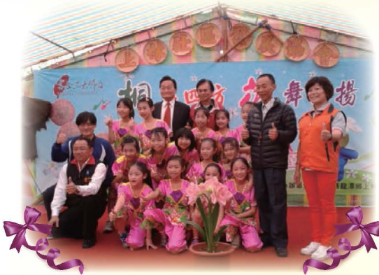
學生客語合唱團同學於2013客家桐花祭活動演出後，與鄉長議員合影