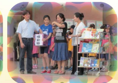
辦理圖書館好書摸彩活動，讓書香飄散在雙龍的角落