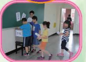
聽完政見發表後，全校每一位同學都擁有神聖的一票，投給心目中理想的候選人！