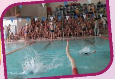
選手們奮勇向前，同學們積極加油的情景！