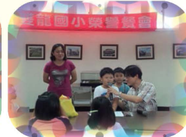
每學期的閱讀榮譽餐會，獎勵愛閱讀樂學習的小朋友