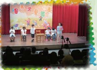
畢業生才藝發表精彩的戲劇表演，博得觀眾的笑聲！