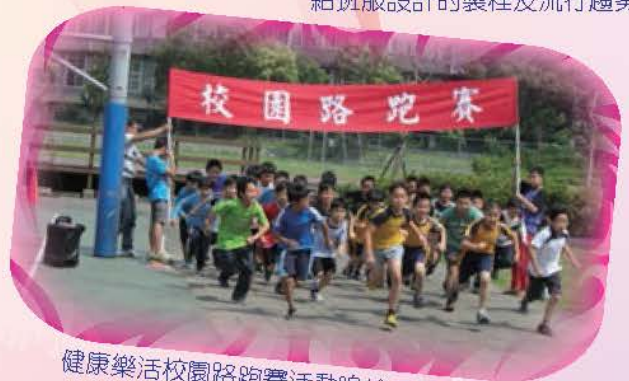
健康樂活校園路跑賽活動鳴槍揭開序幕