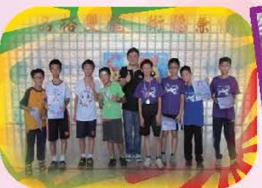
所有參賽選手都可獲得獎勵，前八名同學頒發獎牌或獎狀