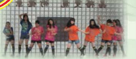
畢業生在兒童朝會表演自編的舞蹈創作