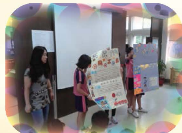
透過一次又一次的演練，小達人們逐漸掌握報告的技巧