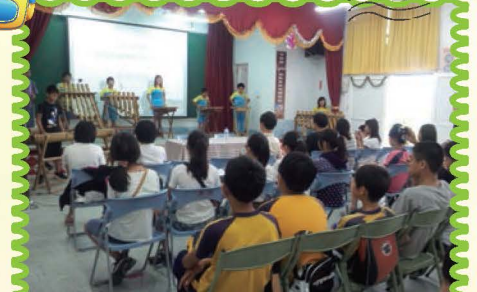
帶領學生參觀復興鄉長興國民小學，辦理「英原際會」教育參觀活動