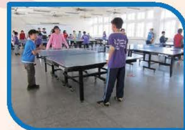
桌球排名賽讓高年級學生體會班際比賽的樂趣