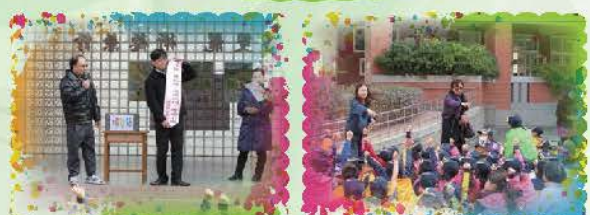
第一週還有過年的氣氛大家一起來猜謎，校長另外出加碼題活動更掀高潮，校長抽出謎題唸出謎面 同學們熱烈舉手踴躍搶答，由導師協助指定猜答同學