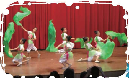
親職教育日中學生舞蹈社熱情演出，將優美的儀態和動作展露無遺