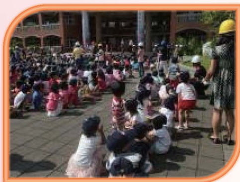
參與防震逃生演習