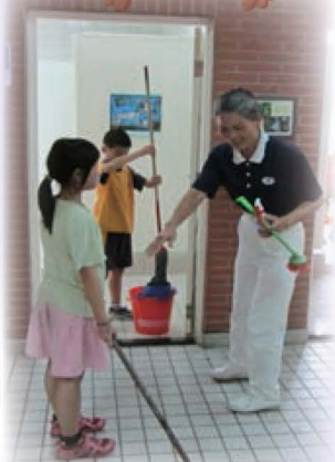
辦理高年級「潔廁達人廁所清潔活動」教導廁所清潔技巧