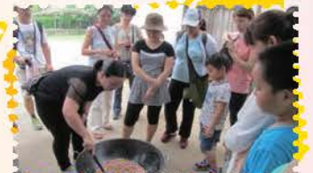
認識在地文化-龍潭名產花生糖大家動手學炒花生糖