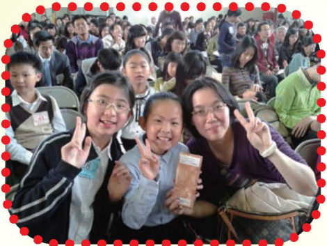
英語品格故事劇團於學生朝會演出