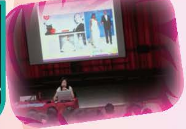
邀請麗嬰房采衣館館長蒞校介紹班服設計的製程及流行趨勢