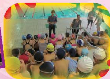
雙龍盃游泳錦標賽開始前，校長為選手們勉勵！