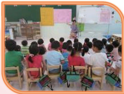
師生共同討論建立班規