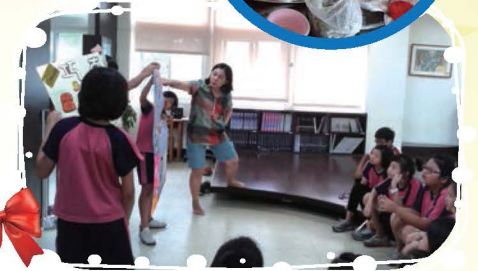
辦理暑假客家美食DIY夏令營，同學們親手製作客家點心