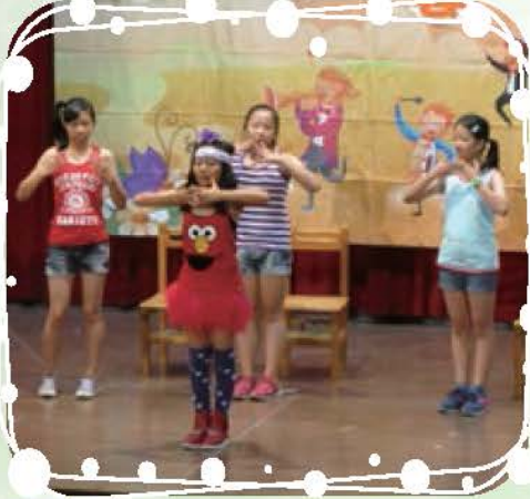
畢業生自導自演的戲劇演出，充分感受同學的創意！