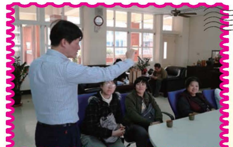
與長興國小蒞校參訪，辦理族客原融交流活動