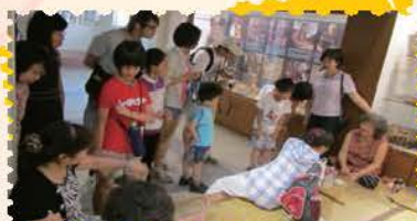
蘭草文化館參觀導覽並由達人現場編織