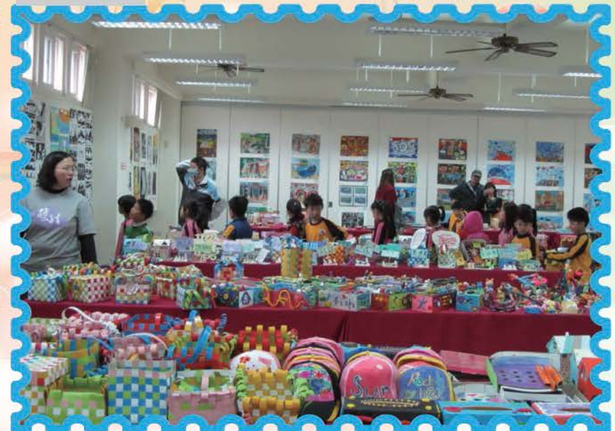
親職教日-學生作品展覽