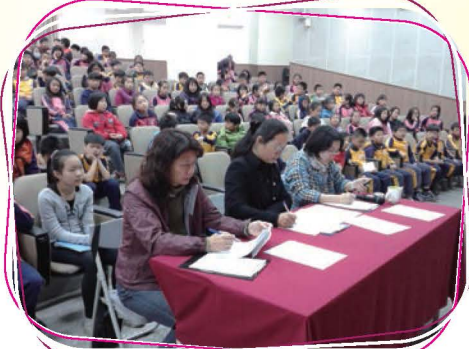
辦理102學年度校內語文競賽，由專業的裁判評選表現優異的同學