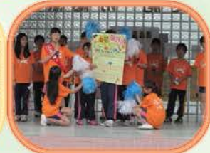
各班候選人，卯足全力進行輔選，以公平、公正、公開精神進行民主選舉程序