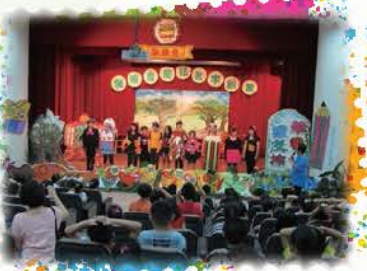
志工劇團兒童戲劇演出，獲得同學熱烈的掌聲