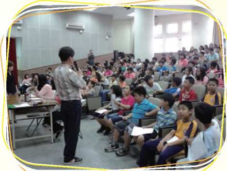
校長勉勵參加國語文競賽的小朋友，不管參賽還是觀摩，都要有最高品質的表現