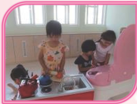
幼兒在娃娃家進行扮演遊戲