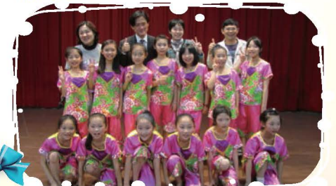
客語合唱團學生於親職教育日表演，展現平時練習的成果