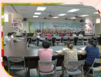
午餐工作推行委員會議