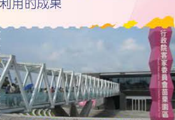
客家文化園區中以苗栗園區規模最大，展品豐富具國際性，值得一遊