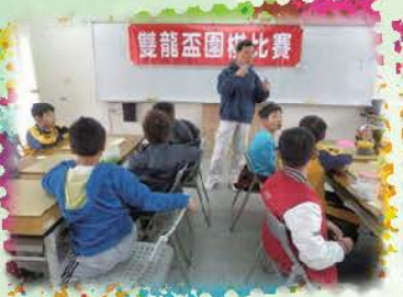
第三屆雙龍盃圍棋比賽，歷經三場初賽及最後決賽，選出各年級得獎學生