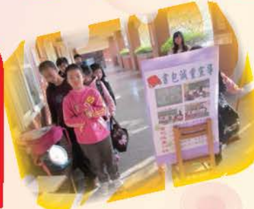
書包的重量不可以超過體重的1/8，書包過重會影響骨骼發育等身體健康，本校每2個月舉行一次書包抽測