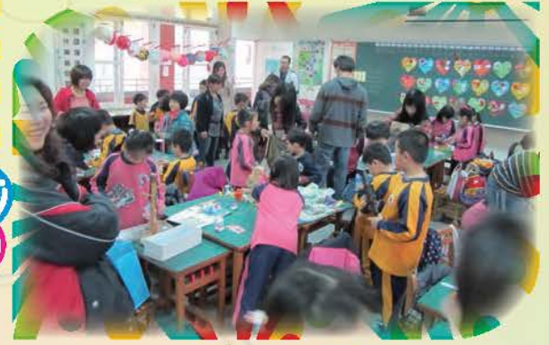
親職教日-班級活動