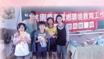
三坑國小擂台賽初賽，學生榮獲前三名老師頒發禮物