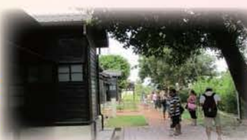
山腳國小創校百年，日式宿舍建築群是全國知名的古蹟，本次參觀重點為永續校園之環境活化再利用的成果