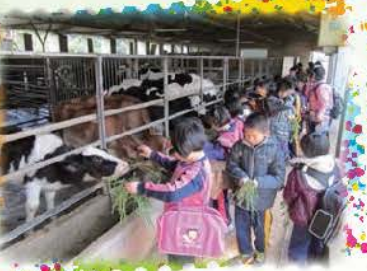
三年級校外教學到埔心牧場一遊