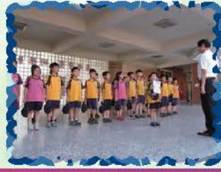
集滿榮譽貼紙的同學，上台由校長親自頒獎