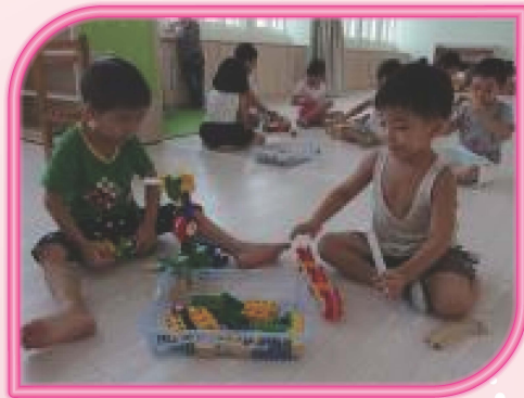
幼兒在積木區進行建構遊戲