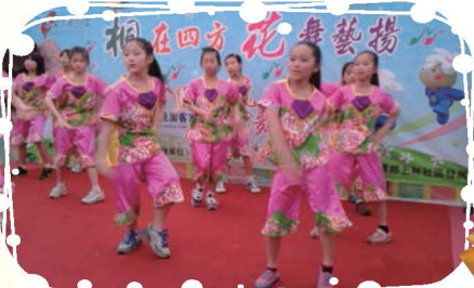
客語合唱團學生參加2013客家桐花祭演出