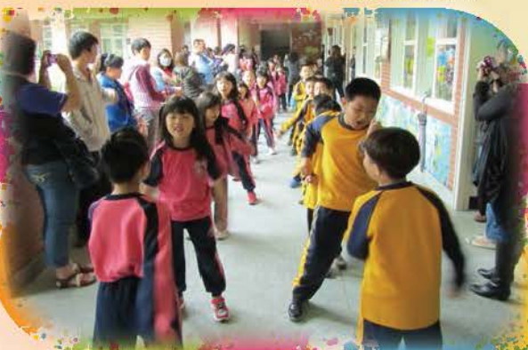
親職教日-健康操表演