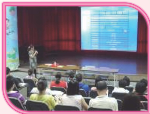
高參與度的新生座談會

102年的炎炎夏日，在楊校長和各處室主任的大力推手之下，雙龍附幼終於熱情滾滾的成立了！從教室的硬體設備開始，我們就決心打造一個專屬於幼兒的優質學習環境—寬敞、明亮、通風！所以幼兒園的孩子們十分的幸福，能夠在兩間大的木質地板教室中盡情探索學習！還有幼兒專用的廁所、烹調美味點心的廚房，在在顯示出學校對幼兒園的用心。而除了大環境沒話說之外，也感謝教育部及教育局、鄉公所、家長會等，給予我們經費上的補助，讓雙龍附幼的孩子們能享有空調睡眠區、互動式電子板、以及各個學習區內豐富又多元的教具、體能器材，可以充分的在遊戲中學習，培養健康的身心！