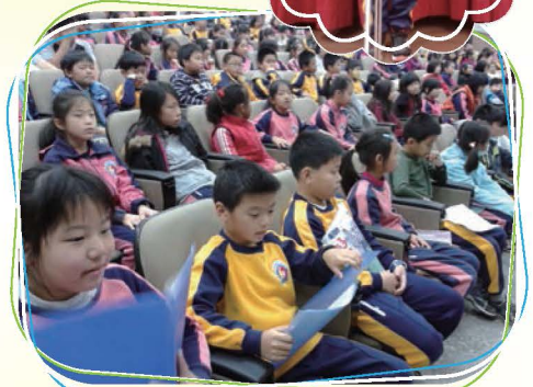
語文競賽的選手與觀眾們，都是活動的主角，大家都是最棒的