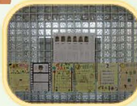
各班候選人，集結眾議，寫出自己的政見，並籌組助選團，讓校園的民主掀起熱潮！