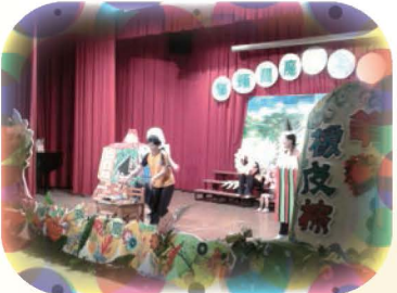
由志工媽媽組成的貓頭鷹故事劇團，打造豪華場景與故事內容