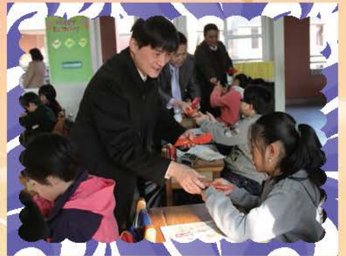
開學校長至各班發紅包