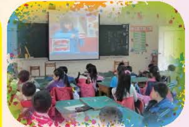
一~四年級進行各班衛教藝文宣講，與同學們有獎徵答互動增進學習效果