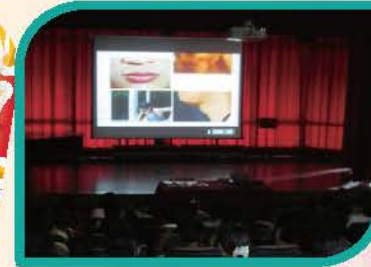
辦理性教育暨愛滋病防治宣導