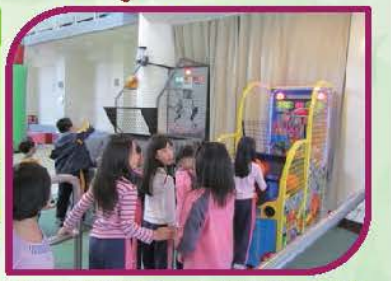
運用投籃機「小小林書豪」看誰投籃最神準