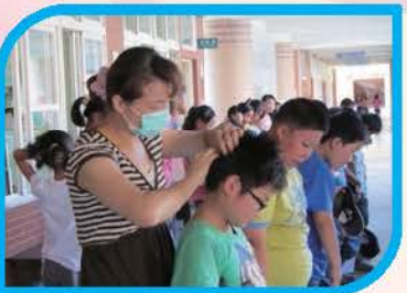
護理師宣導注意個人衛生維持頭髮的清潔最健康！