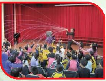
同濟會贊助邀請魔術師羅賓蒞校演出