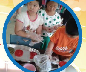
這是我們製作的客家小點心，相信大家也可以做到喔！