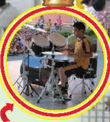
同學上台分享爵士鼓的學習成果