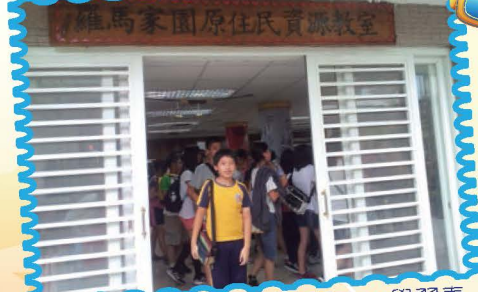
參觀羅馬家園原住民資源教室，學習泰雅原住民的文化資源