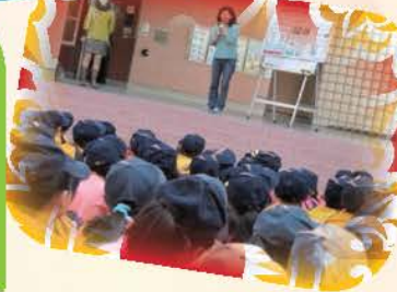
午餐秘書邀請營養師蒞校進行宣導活動，宣導講題為預防食物中毒需遵守五要原則