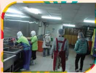
查核午餐廠商廚房