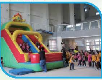
氣墊溜滑梯百玩不厭是全校同學的最愛