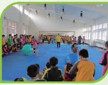
安排班際「滾球大作戰」競賽既熱鬧又激烈，同學們玩得不亦樂乎！