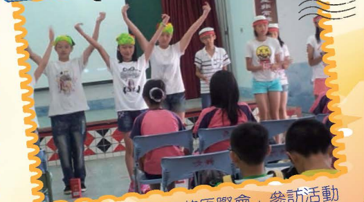
與長興國小辦理「英原際會」參訪活動，學生展現英語律動與詩歌吟唱的成果