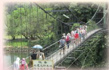
明德水庫有三座島海棠島是其一，島上風景宜人，生態資源豐富，並有客家文物展，資源豐富