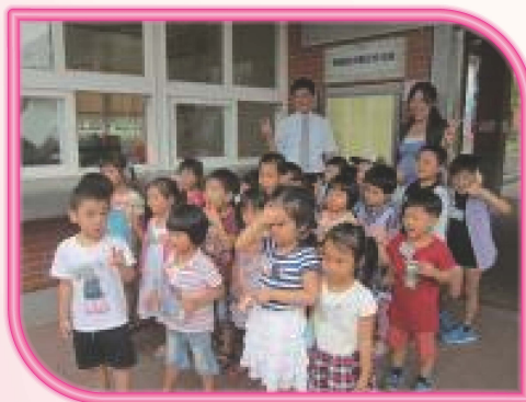
熱鬧滾滾揭牌儀式