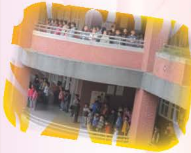
視力保健—戶外遠眺120暨視力保健3010活動