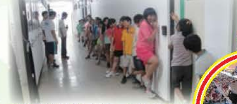
中央大學科學之旅，參訪天文台、氣象站及科學DIY，學生正用單腳體驗重心的掌握