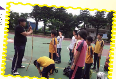
學生透過體驗活動，學習原住民打獵為生的傳統生活方式