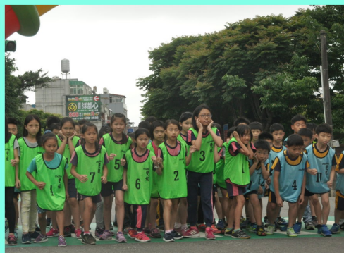
四年級組準備起跑