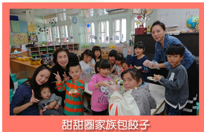
甜甜圈家族包餃子