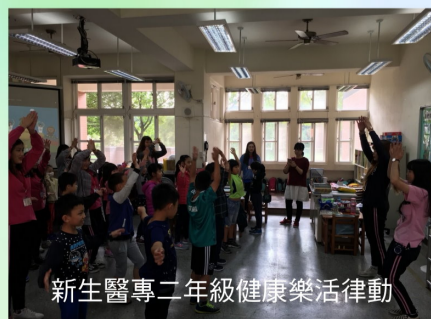
新生醫專二年級健康樂活律動