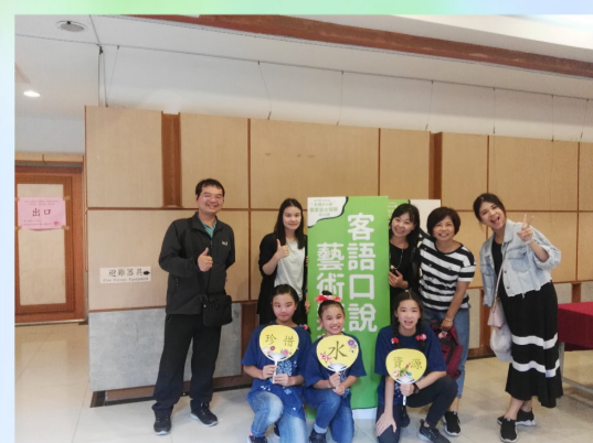
客家藝文競賽榮獲全國第5名