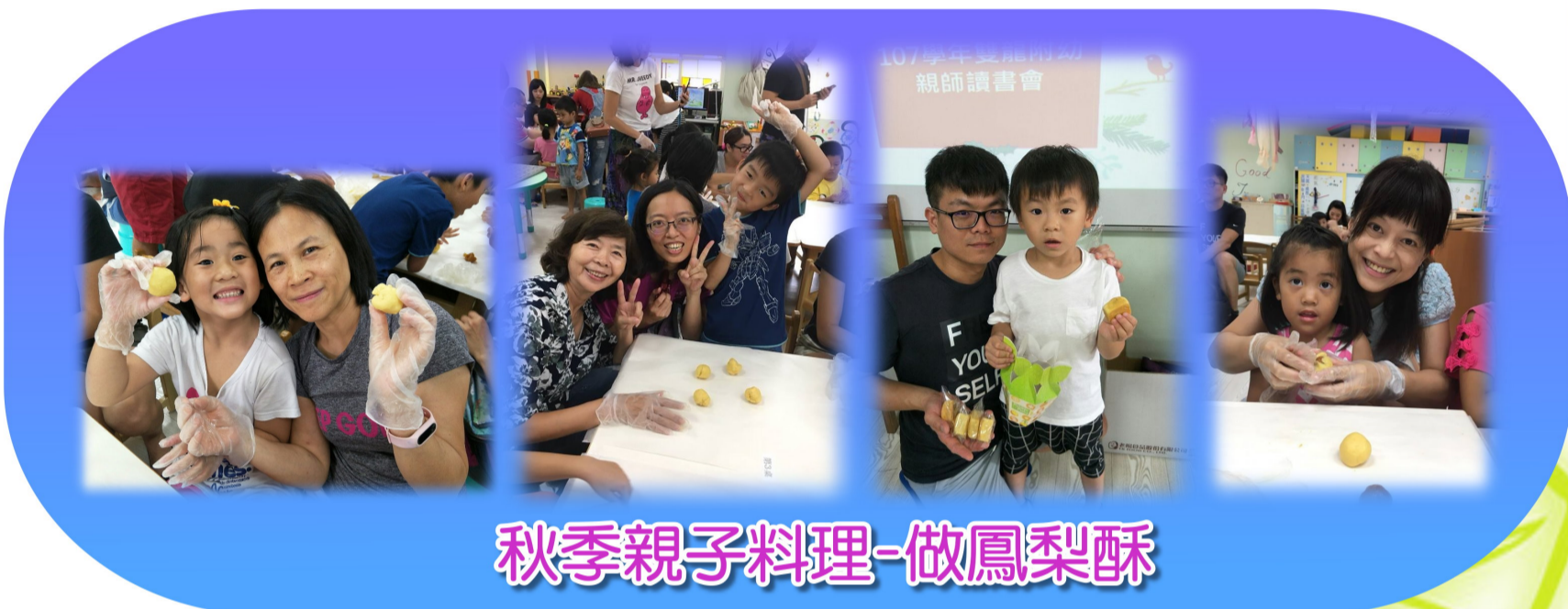
秋季親子料理-做鳳梨酥

先人對食物及土地的感情與尊重，現在我們透過共讀、共耕與共食，賦予了四季新的視野與生命力！