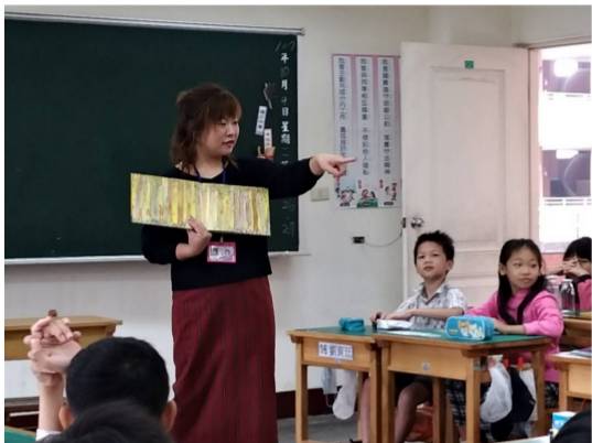
一到三年級每週二故事志工好書分享