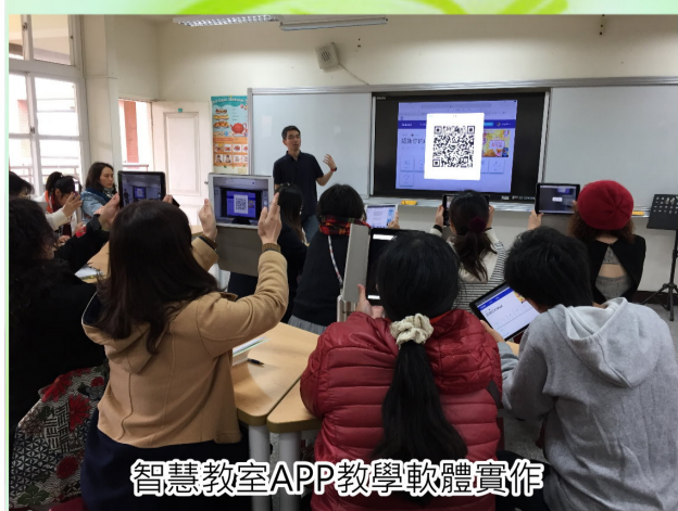
智慧教室APP教學軟體實作