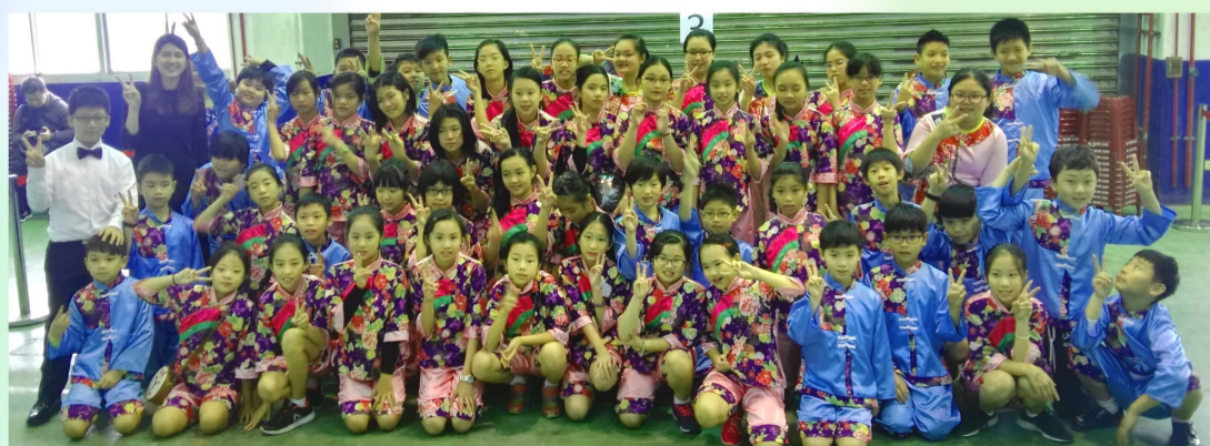
鄉土歌謠比賽榮獲桃園南區優等