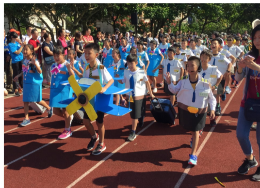
401帥氣的空少和美麗的空姐