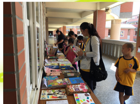
暑假作業暨親子繪本共展