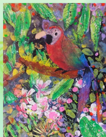
106 陳品睿桃園市學生美展 繪畫類低年級組佳作