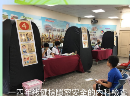
一四年級健檢隱密安全的內科檢查