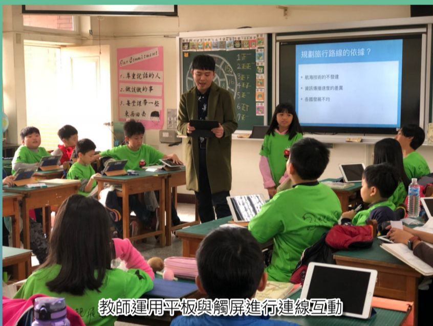
教師運用平板與觸屏進行連線互動