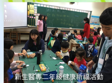
新生醫專二年級健康祈福活動