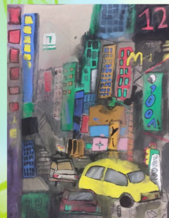
502 張梓麟桃園市學生美展 繪畫類高年級組第二名