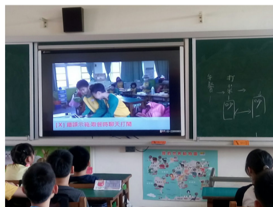
高年級午餐指導現況