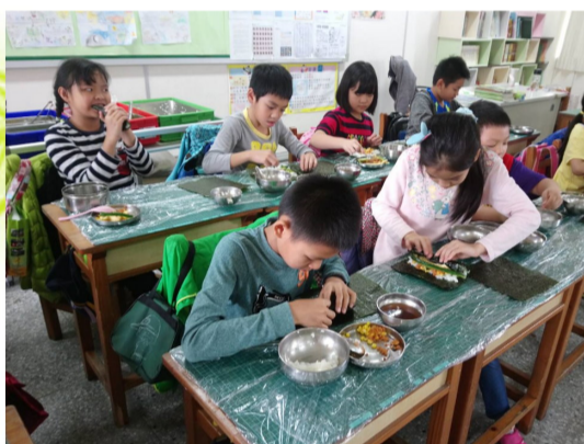
四學年配合領域教學-健康壽司DIY