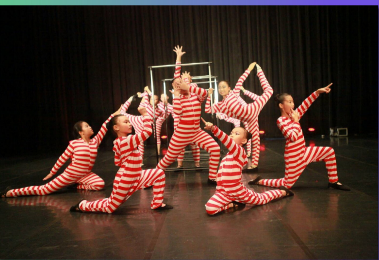
本校舞蹈團參與桃園市舞蹈比賽 榮獲現代舞優等第一名