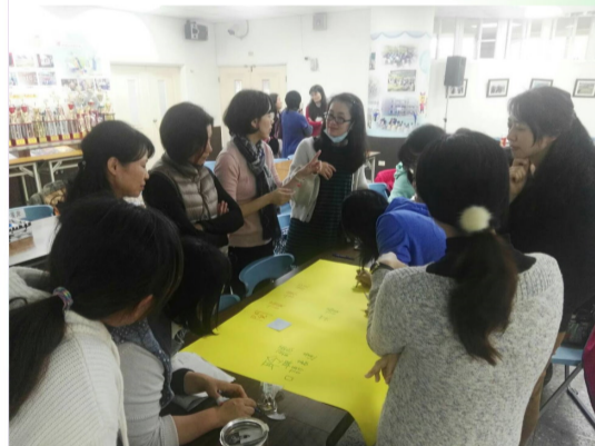
十二年國教課綱教師研討