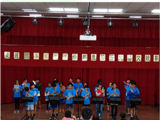
六年級英語競賽-標準的發音、專注的眼神，他們是神采迷人的劇場朗讀者。