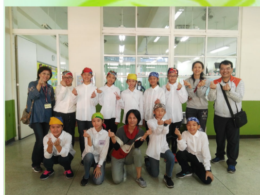
六年5班參加桃園市英語藝文競賽榮獲佳作