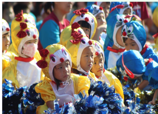
幼兒園可愛的哆啦美