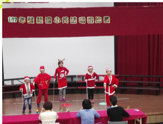
三年級英語唱遊比賽-宏亮的歌聲，活力十足的舞蹈，引爆會場的氣氛