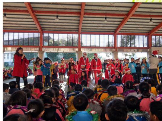
聖誕嘉年華-全校師生全心的投入，讓學校充滿濃濃的歡樂氣氛。