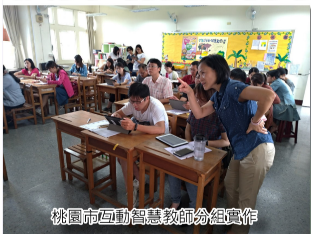
桃園市互動智慧教師分組實作