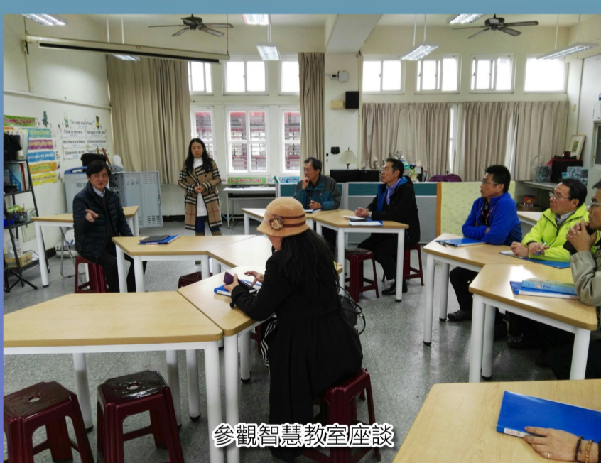
參觀智慧教室座談