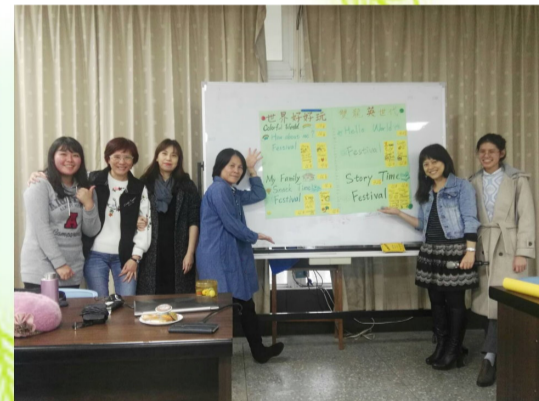
十二年國教課綱課程發表 (英語文)