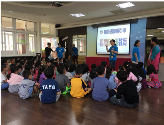
幼兒園及一年級新生圖書館利用教育