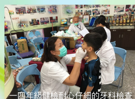
一四年級健檢耐心仔細的牙科檢查