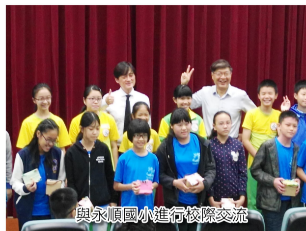
與永順國小進行校際交流