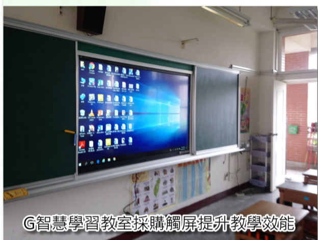
G智慧學習教室採購觸屏提升教學效能