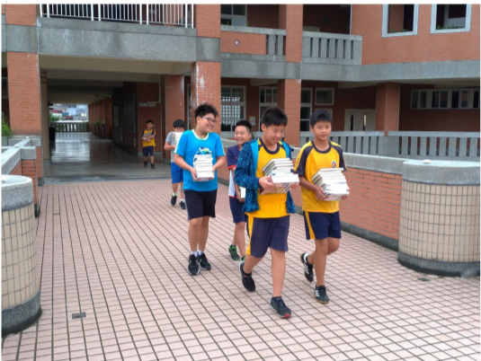
班級圖書交換，享受共讀與聊書