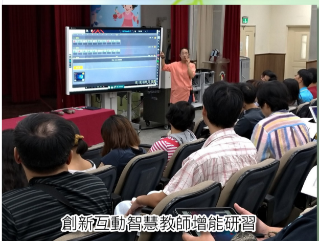
創新互動智慧教師增能研習