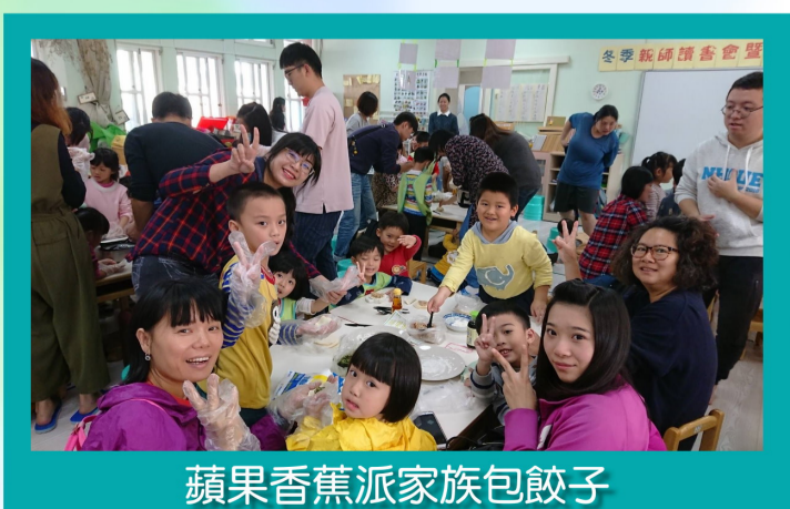
蘋果香蕉派家族包餃子