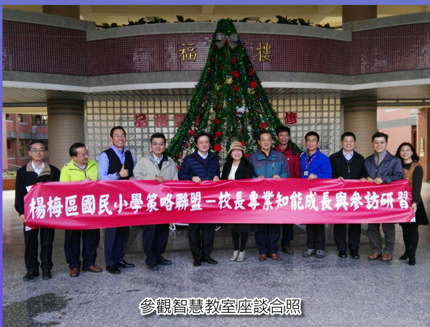
參觀智慧教室座談合照