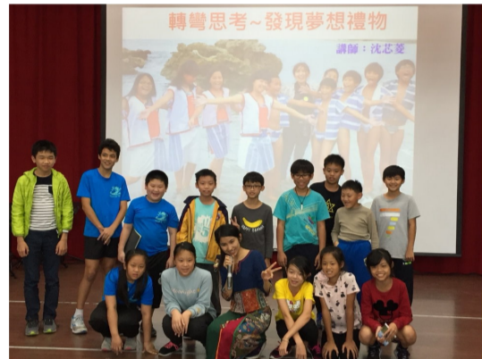
與作家有約~沈芯菱姐姐