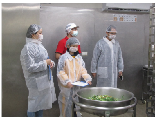
由家長、學生及行政代表抽訪午餐廠商鮮口味公司，讓師生食的安心。