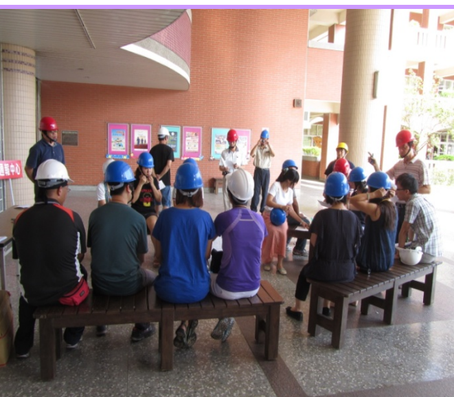
校長主持準備會議