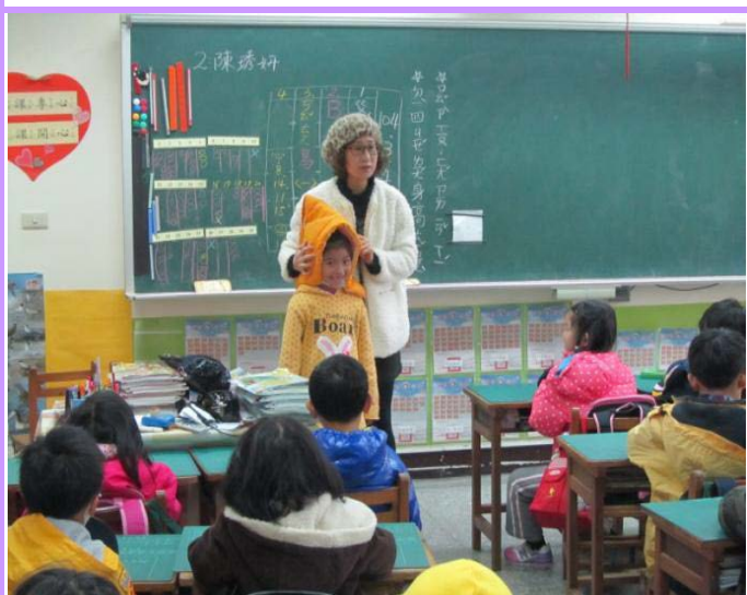
老師解說防震頭套的正確使用