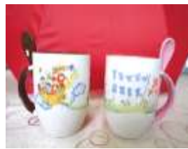
東安世界城，飛向 未來世界馬克杯 發行