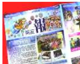
發行「東安報世界」 平面報導行銷東安 世界城