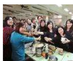
桃園縣第 17 期校長主任儲訓班參訪