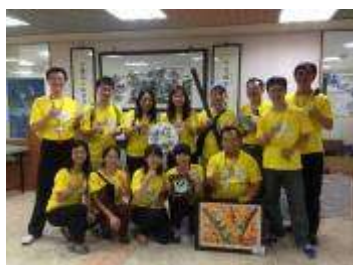
InnoSchool 2014 全國學校創新經營獎 KDP 國際認證最高榮譽