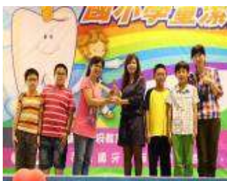
102 年桃園縣國小學童潔牙比賽團體組第一名