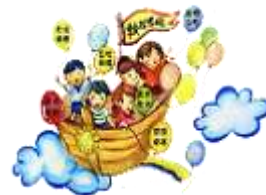
學校處處可以 可見「願景飛行 船 LOGO 圖」意 象與實際結合

引進新住民、國際志工等異文化，拍攝多元文化微電影，形塑學童尊重理解及接納的多元文化氛圍。