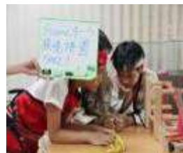
多元文化微電影 拍攝實錄