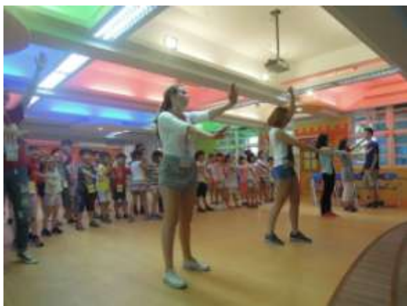
德國與荷蘭姊姊帶領分享各國早操舞