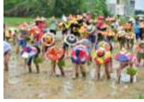
稻香插秧 體驗繽紛新世界