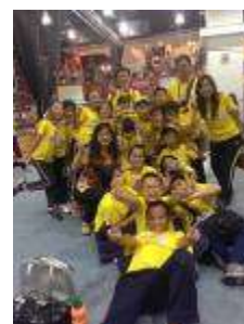
102 學年度第 5 屆健身操桃園縣決賽優等