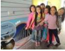
語音情境學英語 認識全世界