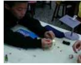
LED 聲光探索課 體驗聲光科技