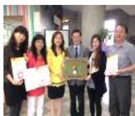
103 年度教育部校園空間美學暨發展特色學校全國特優