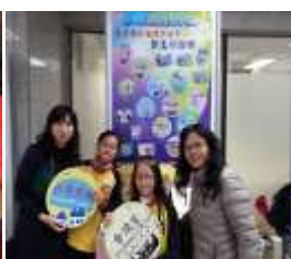
102 年度校園綠點子「我是東安世界王」地球儀創意班級牌優勝