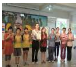
2013 IEYI 世界青少年發展展台灣選拔暨展覽會銅牌獎