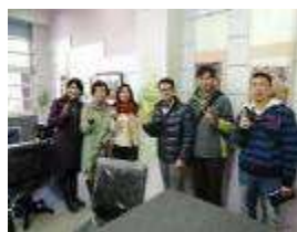
新北市永吉國小教師團隊參訪