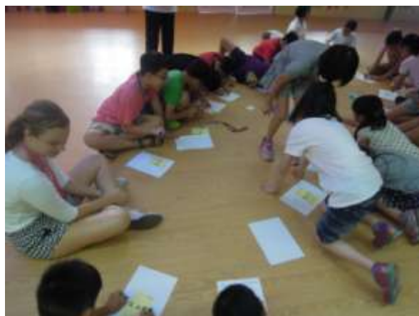
德國姊姊帶領製作雙語名牌