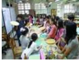
地球儀 世界班級牌繪製