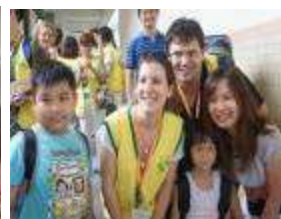
國際志工駐校深 耕文化交流