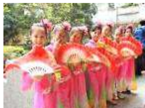
新住民組成新光舞 蹈團耀眼登場