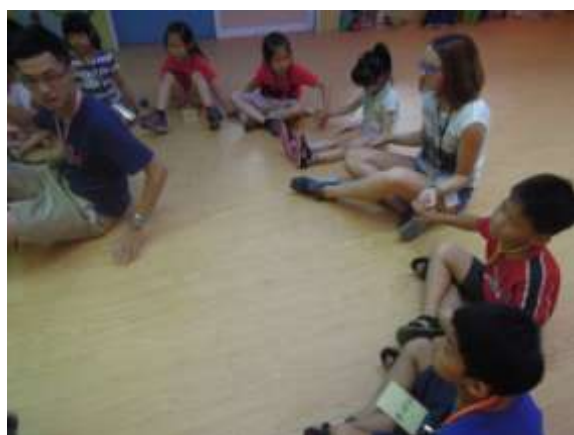
元智大學哥哥與荷蘭姊姊帶領分享荷蘭民俗文化