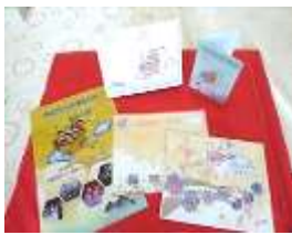
印製東安世界城 L 夾、飛行護照 及城市簽證、閱 讀護照