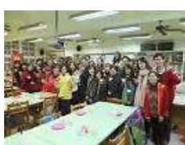
新北市國際教育空間美學參訪