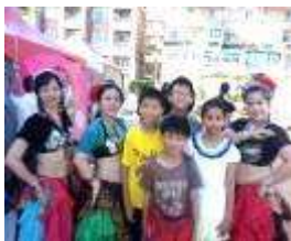
參與社區雲南 文化火把節活動

引進新住民、國際志工等異文化，拍攝多元文化微電影，形塑學童尊重理解及接納的多元文化氛圍。