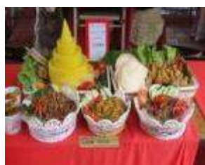
102 年內政部新住民多元創意美食競賽全國第一名