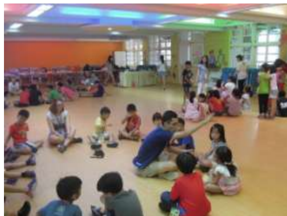
元智大學哥哥與荷蘭姊姊帶領分享：如何對這個世界做出貢獻