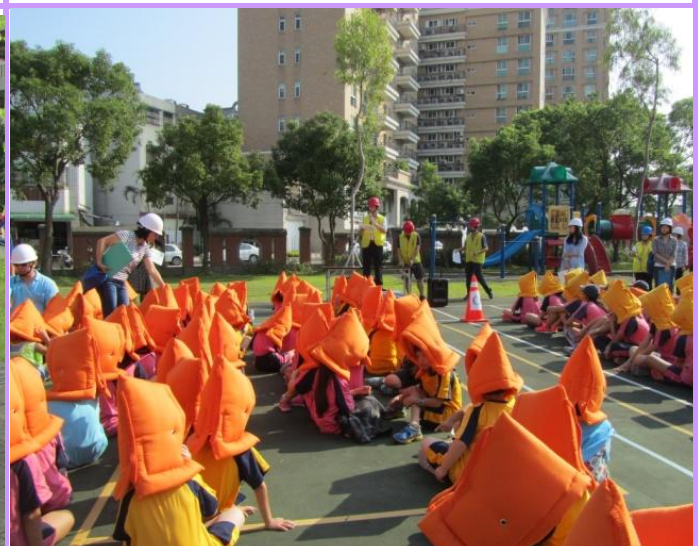
至避難點後校長進行防災教育