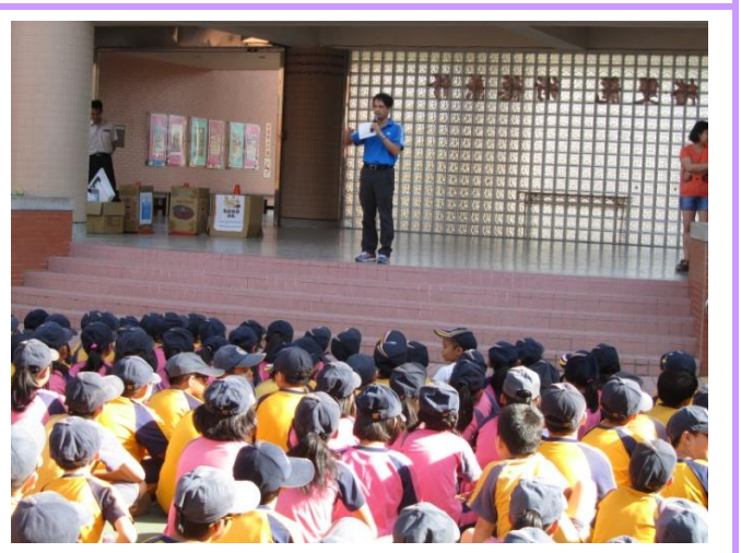
主任於升旗時進行防災教育