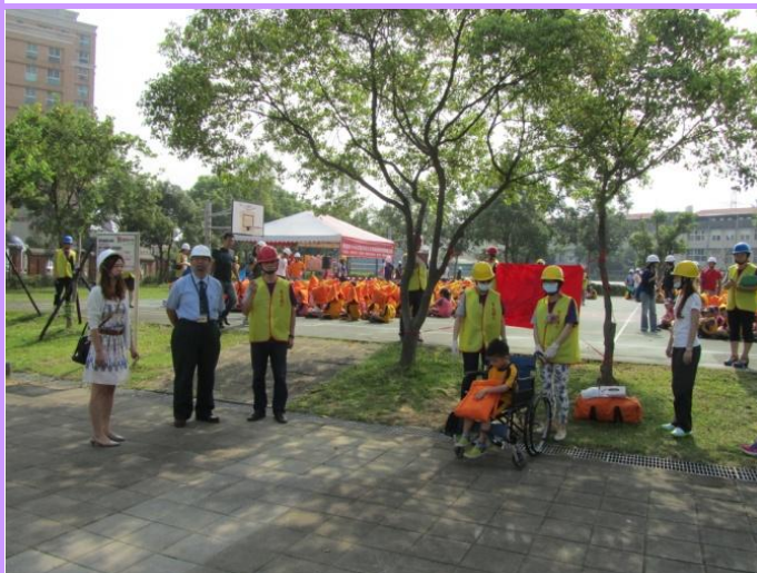
教育局長視導急救站