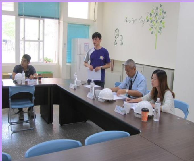
演練前向教育局長官簡報