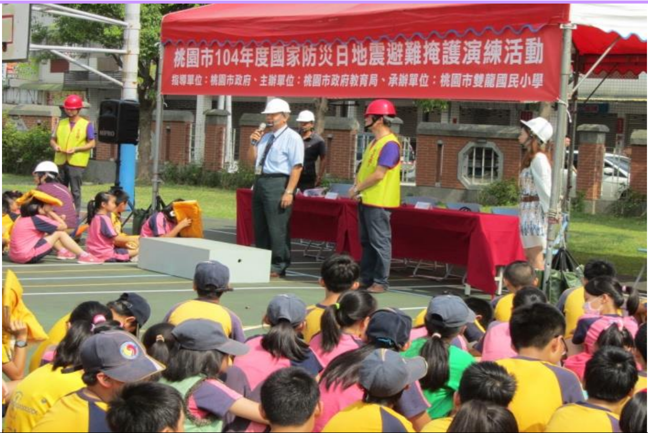
教育局長勉勵全體師生認真演練