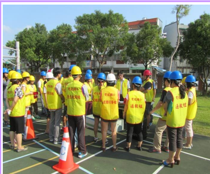
演練後的檢討會議