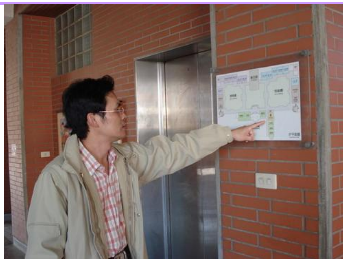
避難路線公告於各樓梯口