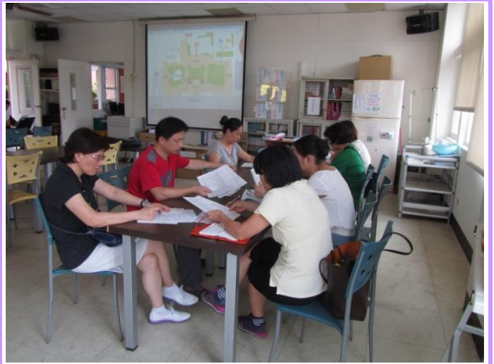
防災小組成員討論逃生動線