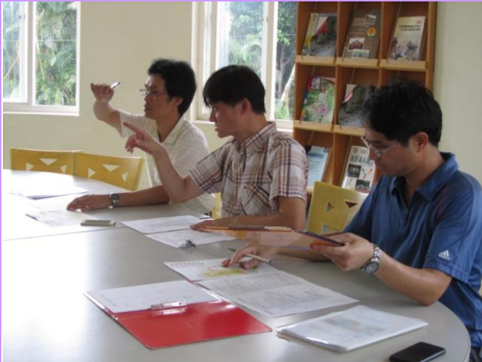
由校長防災小組會議