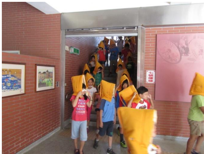
學生進行避難疏散路線