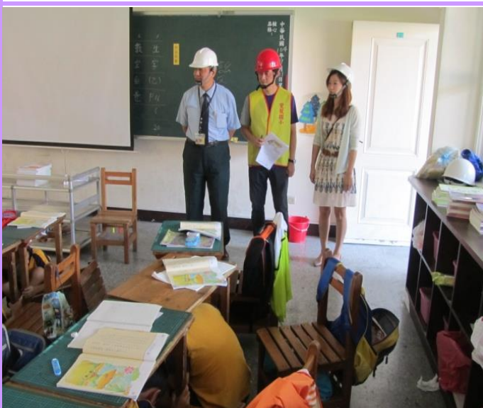
教育局長視導學生就地避難