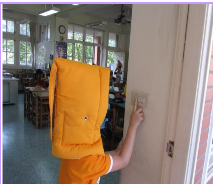
避難時的注意事項-關燈