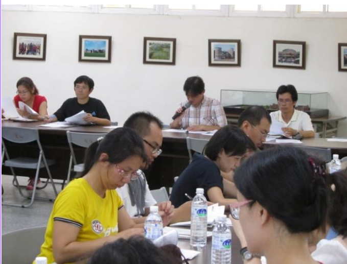
防災小組結論於教師會議轉達