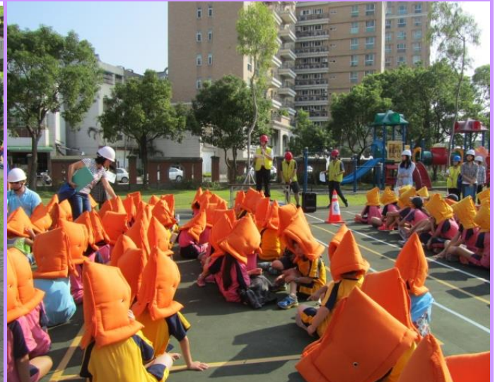
至避難點後校長進行防災教育