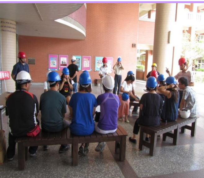
校長主持準備會議