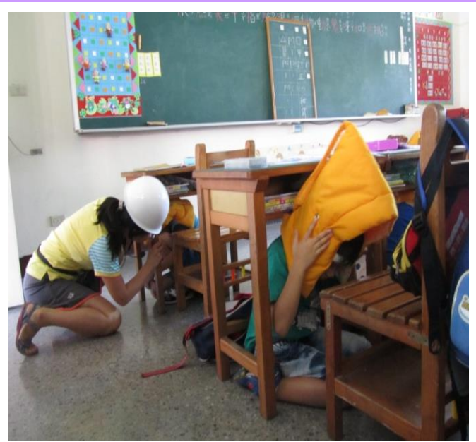
低年級老師指導學生就地避難