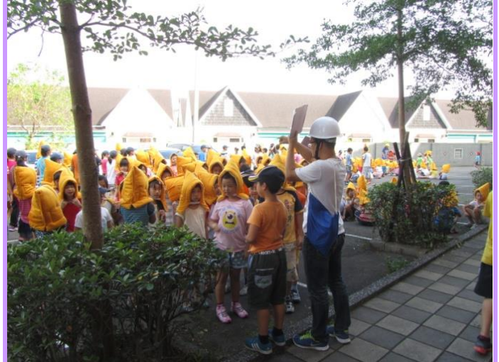
避難點老師集合與點名