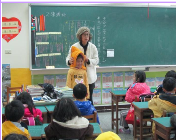
老師解說防震頭套的正確使用