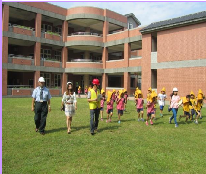
教育局長視導學生疏散過程