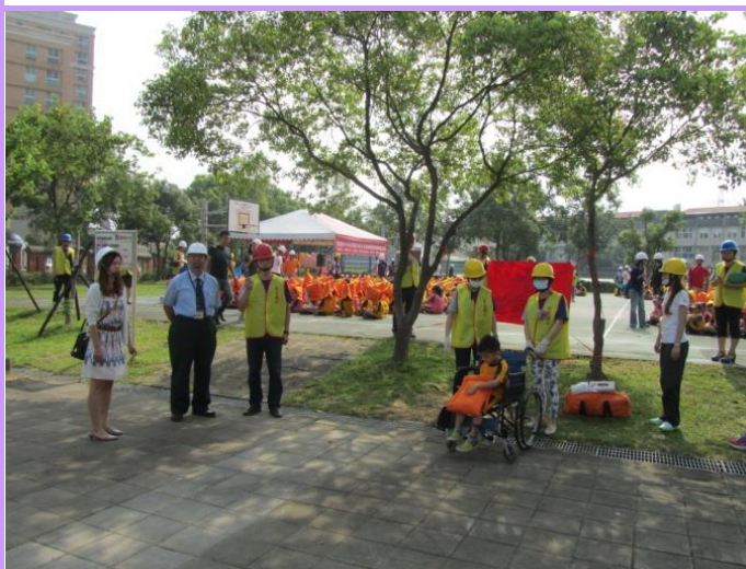
教育局長視導急救站