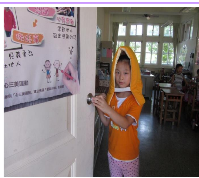
避難時的注意事項-開門