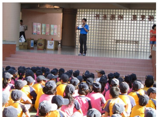
主任於升旗時進行防災教育