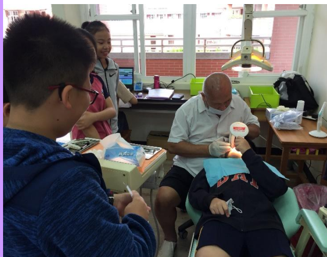
牙醫師教導學生如何檢查自己牙齒刷乾淨了嗎？