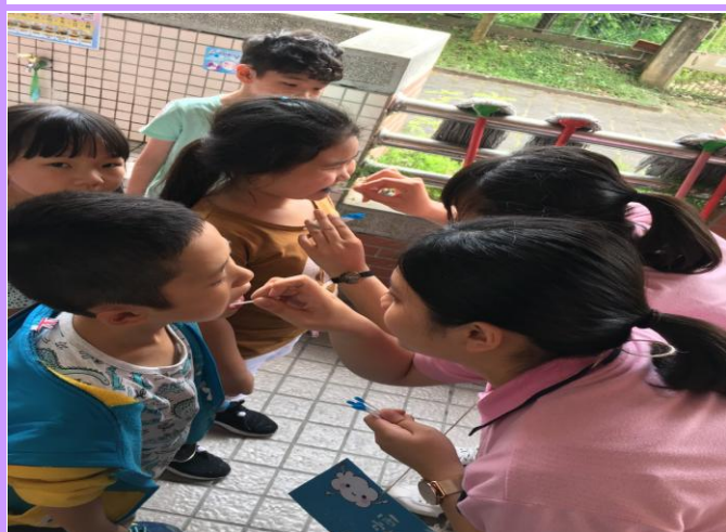
學校護理師入班牙菌斑抽查