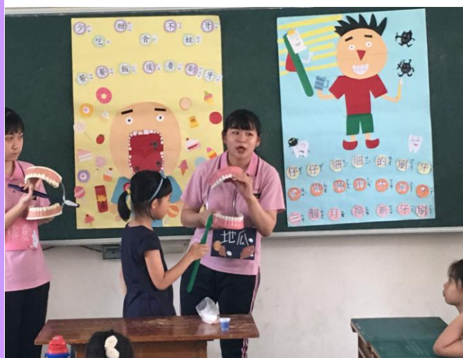
新生醫專護理科入班宣導潔牙知識