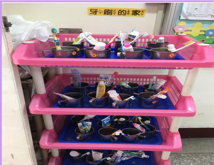
班級潔牙用具專區擺放