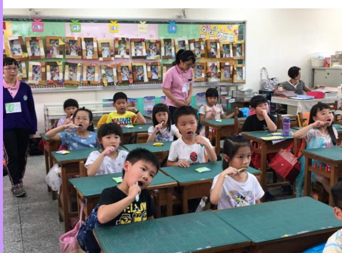
乾式貝式潔牙，「兩顆兩顆…貝氏刷牙」