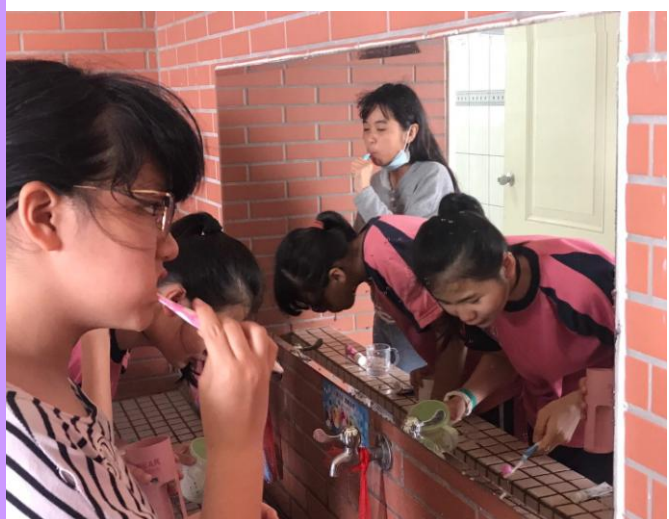
餐後潔牙我最確實