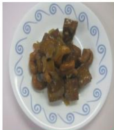
主菜 腰果蜜燒豆干