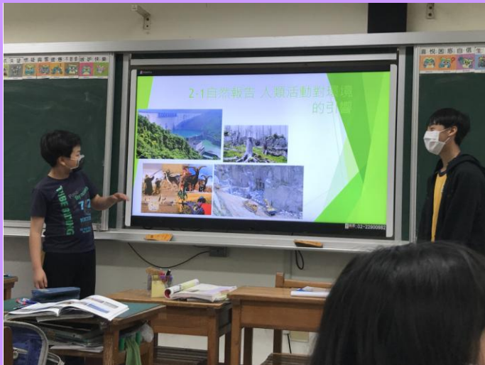
人類活動對環境的影響