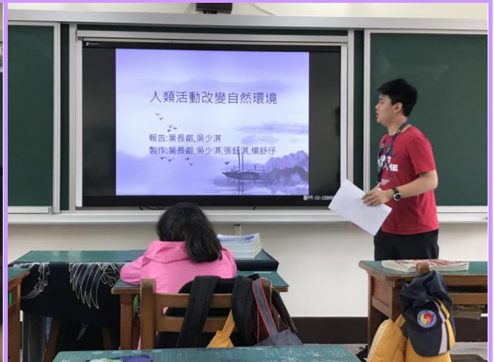
人類活動改變自然環境