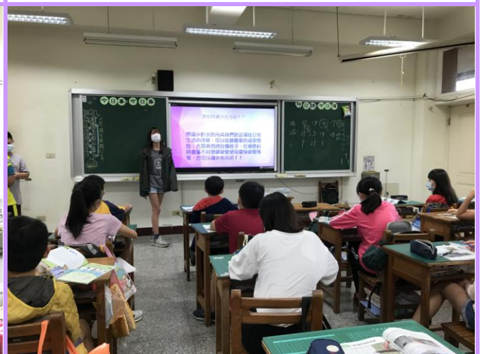
針對環境議題大家一起討論