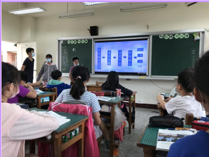
全班師生專心聆聽學生講解