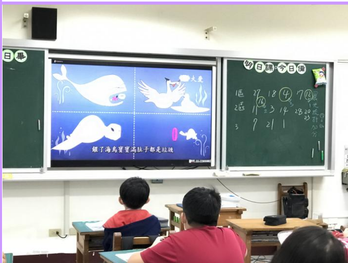
結合媒體了解海洋生態面臨的問題