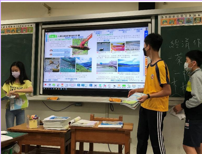
每一個主題都是一個團隊的作品