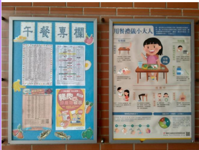
校園穿堂規劃午餐專欄公布菜單等資訊