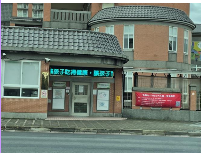
校門跑馬燈摘錄部長給家長的一封信