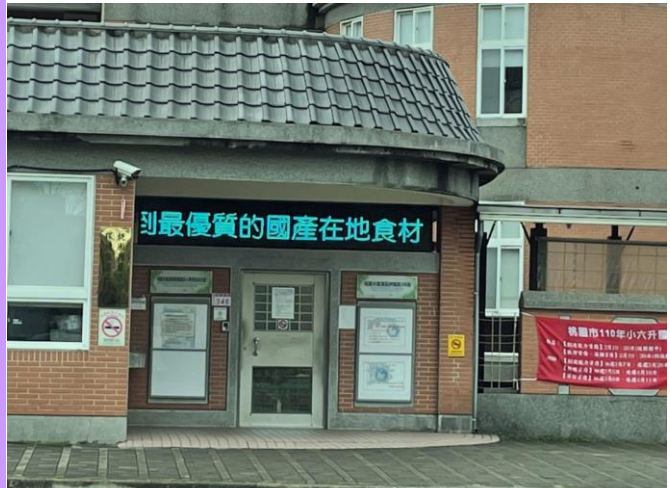
強調讓孩子吃最優質的國產在地食材