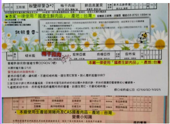
三家菜單都加註一律使用國產生鮮肉品