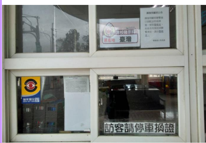
警衛室張貼「本校豬肉原產地臺灣」海報