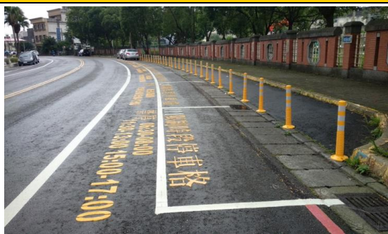
圖三 家長汽車接送區