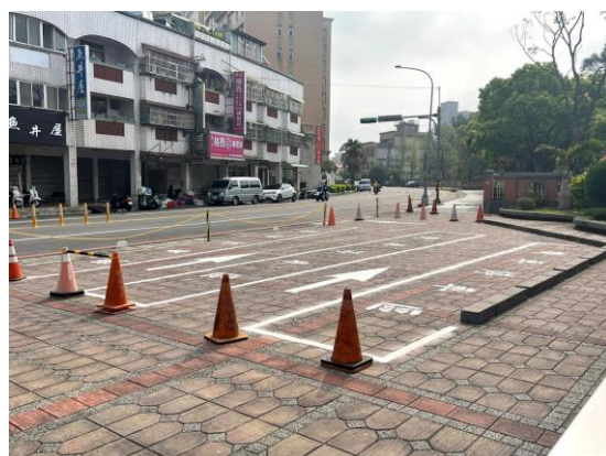
圖二 機車接送區方便家長接送學生