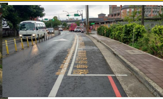
圖四 家長汽車接送區接送情形