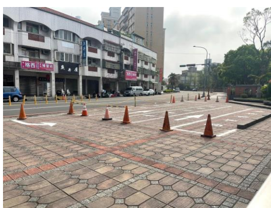
圖一 規劃家長機車接送區停車位