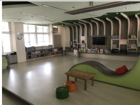
圖七 學生放學等候區