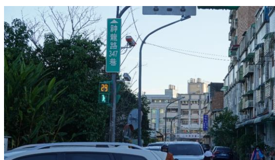
圖九 學生放學過馬路情形