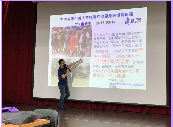
利用生活周遭的案例做講解