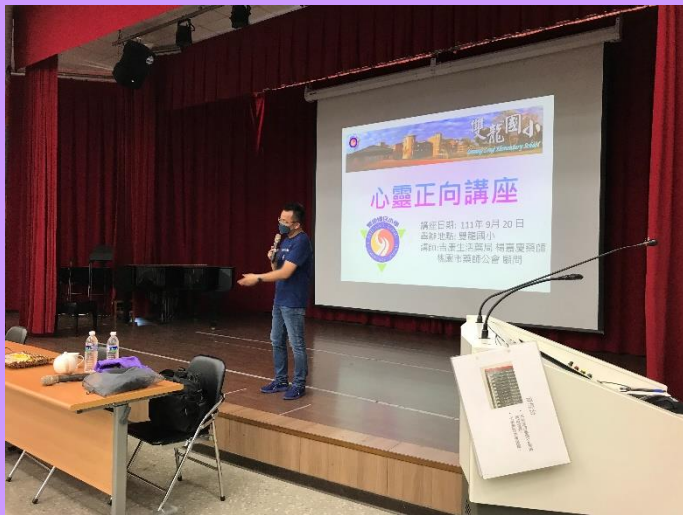
講師對學生進行正向心靈講座