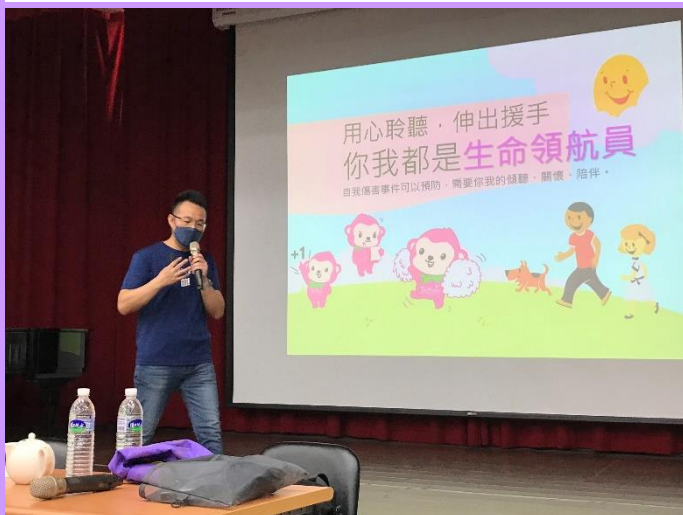
每一個人都是重要的