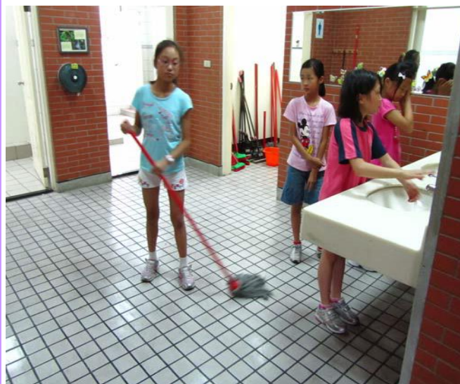
打掃的學生以維護廁所環境潔淨為目標