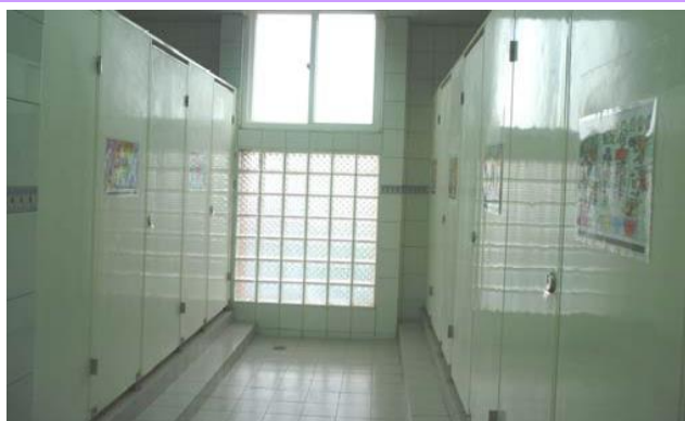
寬敞明亮又潔淨的六星級廁所