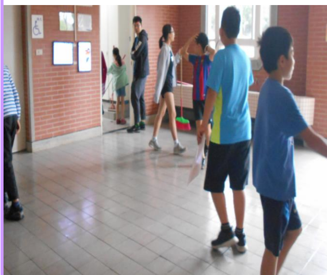
打掃時間老師實地到場指導清潔