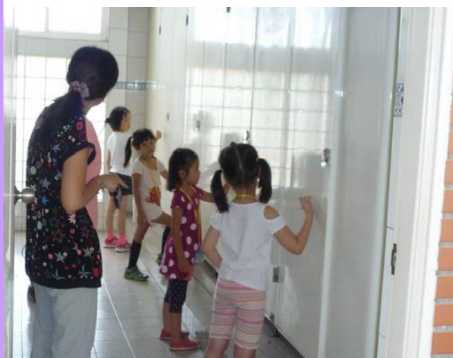
廁所禮儀—應先輕輕敲門看是否有人