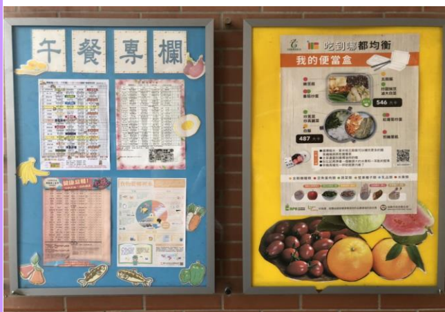
午餐專欄公布菜單及營養小常識等資訊