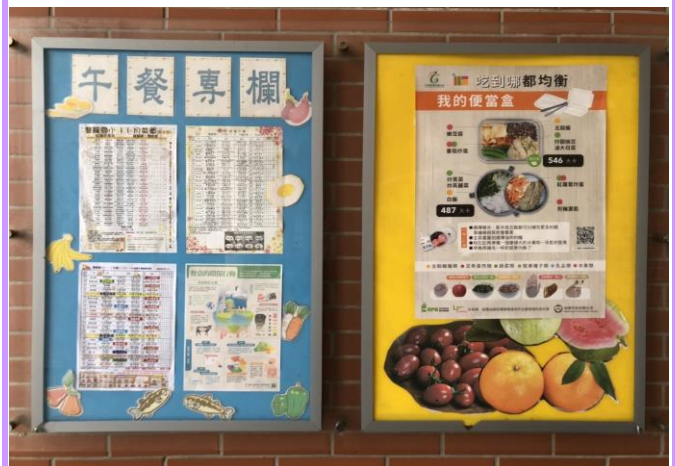
我的餐盤說明餐食各大類食物攝取量