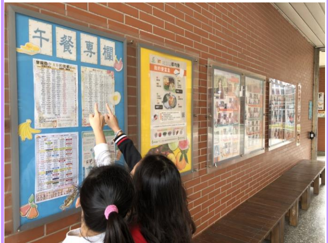
同學在午餐專欄前查看菜單了解吃什麼