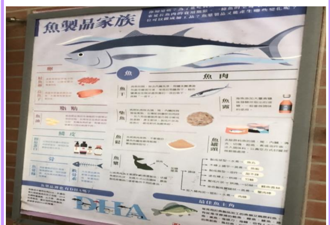
豐食良食圖譜大海報說明各食物家族