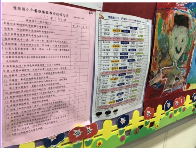
教室班級張貼菜單及午餐進餐指導備忘表