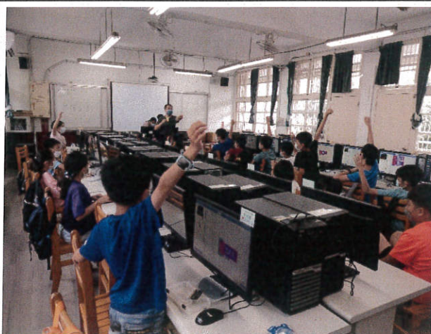
建國國小四、五年級 23 位同學參與