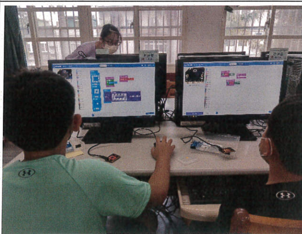
學生可以清楚理解參數設定步驟