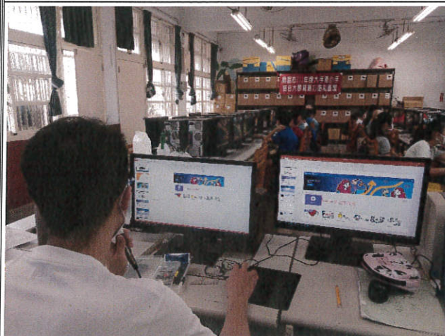
講師教學操作步驟明確