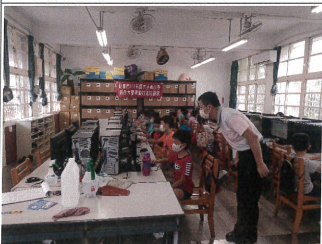
校長到場關心了解學員學習狀況