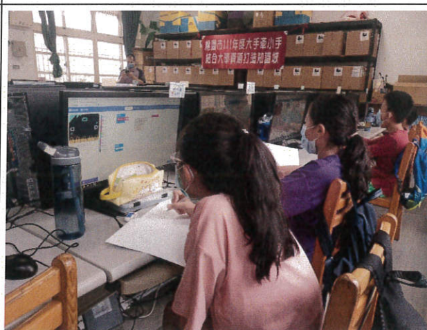
教授講授簡潔易懂學生學習認真