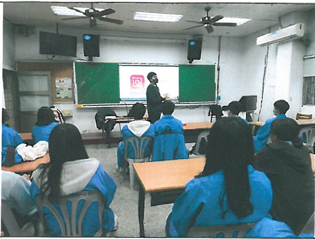
111. 04. 07 拍攝實作課程