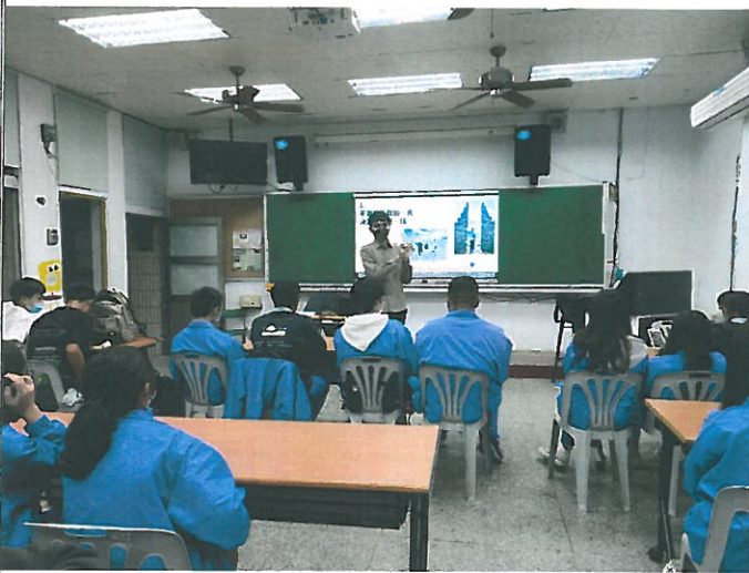
111. 04. 28 影像後製課程