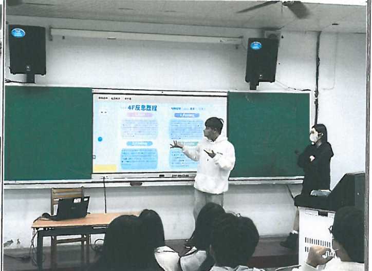
111. 06. 11 成果發表