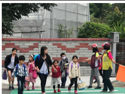
圖九 學生放學過馬路情形