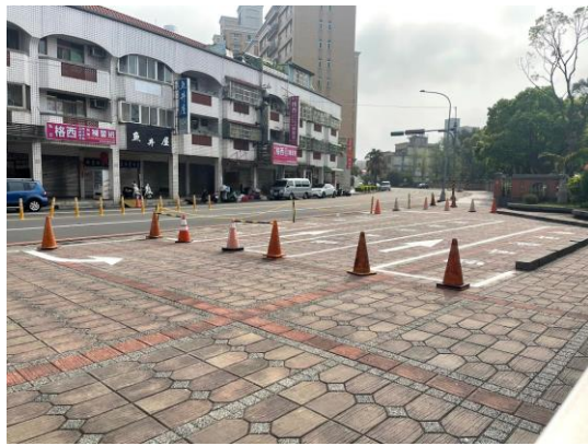
圖一 規劃家長機車接送區停車位