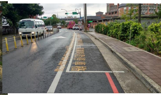
圖四 家長汽車接送區接送情形