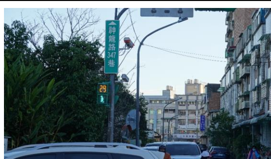
圖十 紅綠燈號誌改為全時段