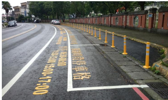
圖三 家長汽車接送區