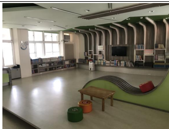
圖八 幼小閱覽室提供學生等候