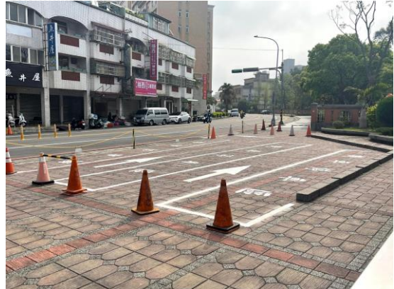
圖二 機車接送區方便家長接送學生