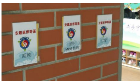
圖五 學生安親班等候區