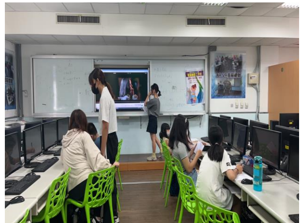
學習撰寫分鏡腳本