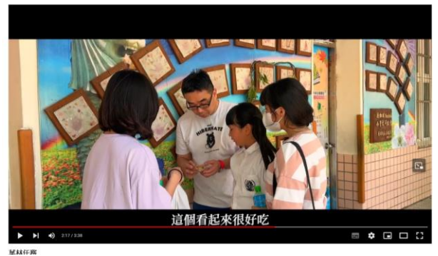
成果影片 ( https://youtu.be/IJYFupR161k )