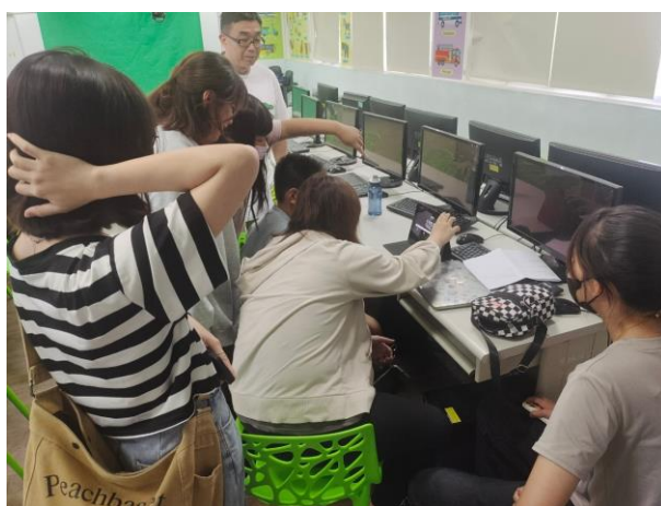
學習剪片基礎技術-影片後置剪輯