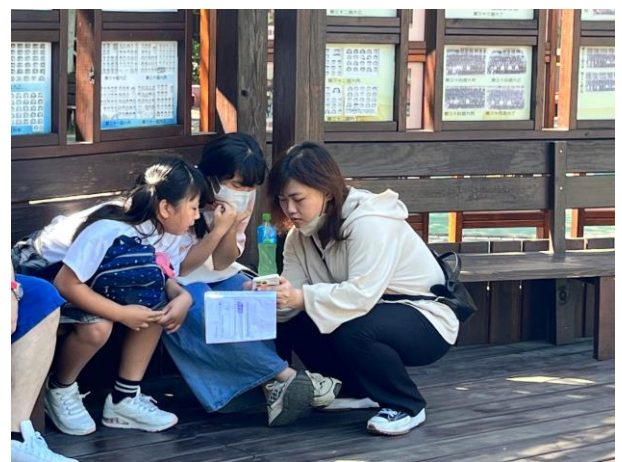
開拍啦-實際拍攝劇情指導