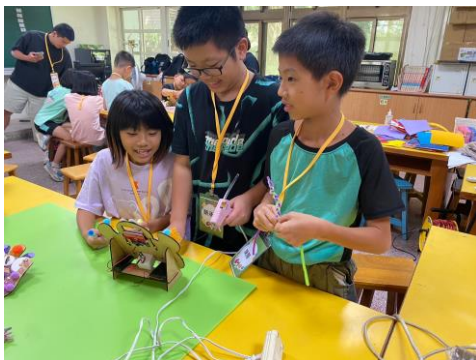
創作 microbit 的大溪小小怪