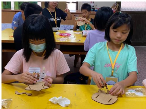
組裝大溪小小怪模組零件