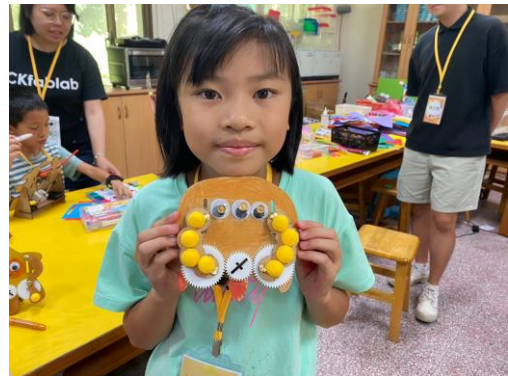
大溪小小怪成果展現