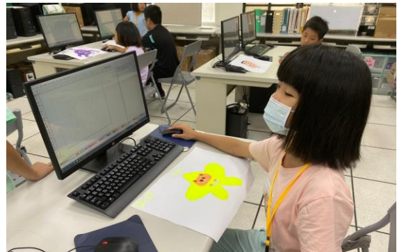
用電腦繪製大溪小小怪