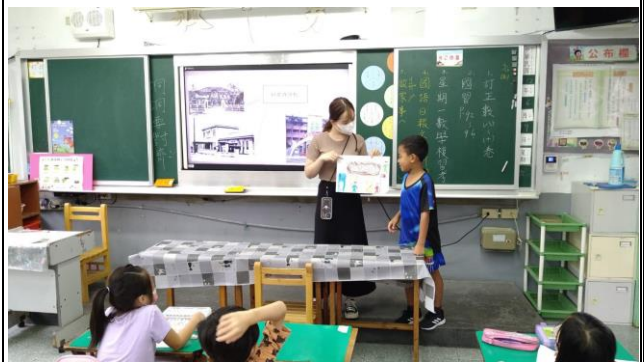
請學生上台發表自己印象最深刻的部分