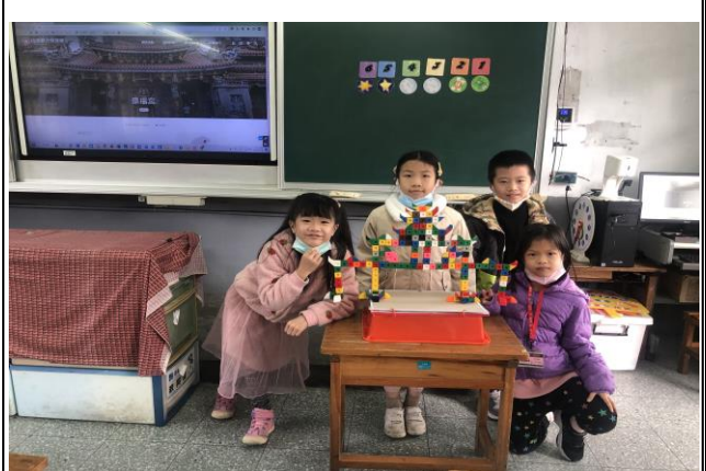
讓學生用積木創作自己心目中的景福宮