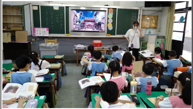
長庚科大學生講述傳統文化故事