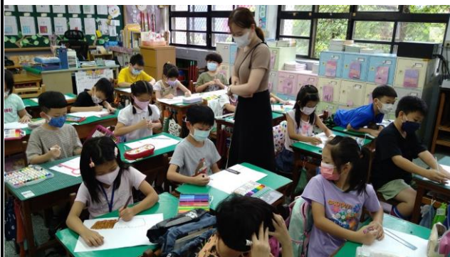
讓學生進行廟宇創作