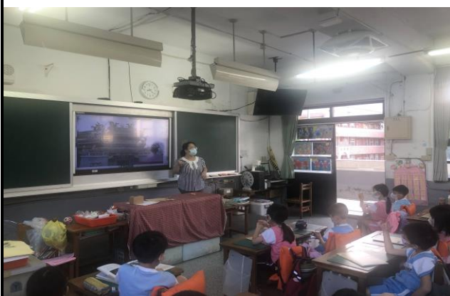
本校資深教師介紹在地文化資產景福宮