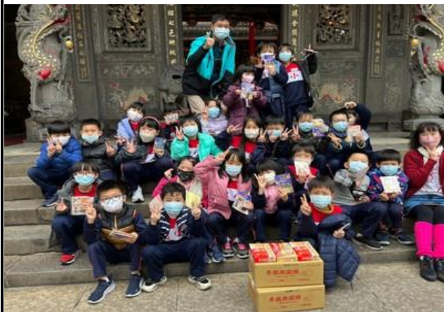
帶學生一同參訪景福宮